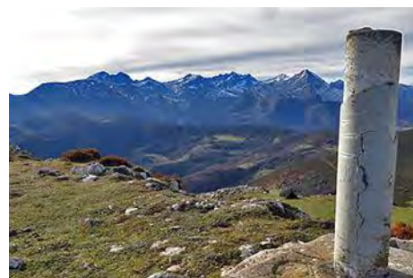
En el vértice, mirando a las Ubiñas