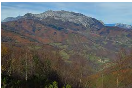
Al Norte, aparece el Aramo