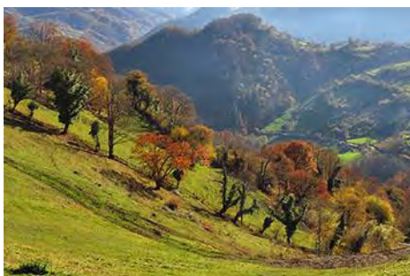
Bajando entre bosque y prados