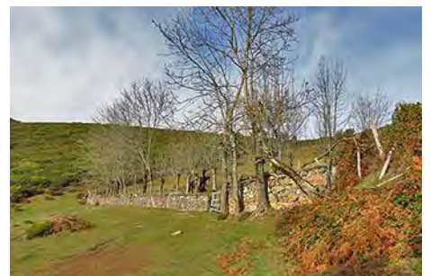
... hasta desembocar en la Mortera