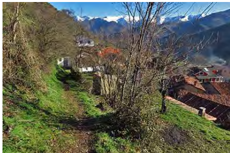
Primeros metros de camino desde Llanos

Salimos del pueblo, de la parte alta, donde sale un camino que asciende hacia el Sur de forma continuada. En algún momento la maleza amenaza, pero es de fácil transitar (todavía). Hay un tramo en el que pasamos por un prado (cerrar siempre las portillas).