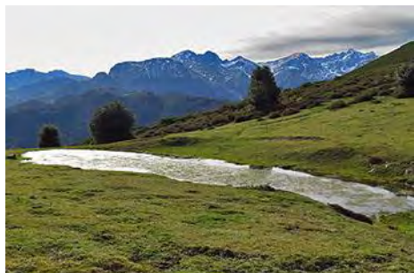
El Chagu con el macizo de Ubiña detrás

Ahora subimos al lado de la muria, a ganar el evidente collado encima de nuestras cabezas donde hay un pequeño lago (el Chagu). Aquí, además de las vistas que han ido apareciendo de Ubiña, se nos aparece por primera vez el Aramo. Y a nuestra derecha la cima. Para ello tomamos en esa dirección una senda, ésta muy marcada, que gana un segundo collado. Abajo tenemos la vallina que remontamos casi íntegramente, y muy por debajo Valle. Aún nos queda remontar un poco, siempre hacia la derecha siguiendo camino de ganado y algunos jitos sueltos, hasta la llana cimera, sorprendentemente amplia y despejada. Llegaremos en casi media hora desde la Mortera. Antes, podemos acercarnos a una vecina cota con cruz cimera (el Manotele, homenaje a un montañero local). Y de ahí rápidamente al vértice de Brañavalera, a 1483 metros (dos horas y media desde Valle). Ya podemos relajarnos y disfrutar de las vistas. Un poco al este, tras un cercano collado, hay otra cota a la que podemos acercarnos rápidamente (el pico Chagu, 1457 metros). Es de menos altura que la cima principal, pero un gran mirador al valle de Lena, justo bajo nosotros, con vistas complementarias.