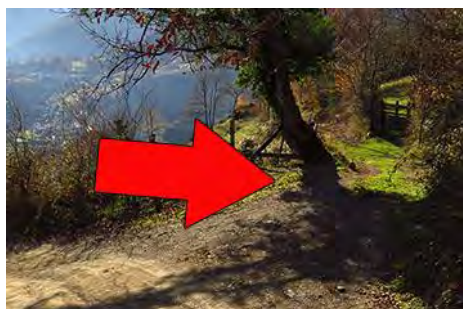
Desvío a la derecha hacia Valle

Por debajo de los 800 metros de altura, cuando llevamos una hora de bajada, y justo en una curva a la izquierda, encontramos un desvío a la derecha. Ésta es la zona de los Altos del Teso y ése es el camino por el que dejamos la pista y seguimos bajando durante media hora más para volver a Valle. Es en realidad parte del PR AS-87, aunque no está muy señalizado. Pasamos entre bosque de castaño y prados muy cuidados, con Zureda enfrente, para ver al poco Valle bajo nosotros, pasar por el cruce por el que subimos a la subida y de ahí llegar al pueblo y al coche en pocos minutos más (20 minutos desde el desvío de la pista a Tiós).