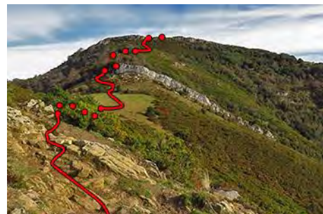
Últimos metros antes de la cima