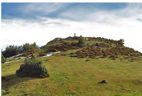
El lado tenemos la cima de Brañavalera