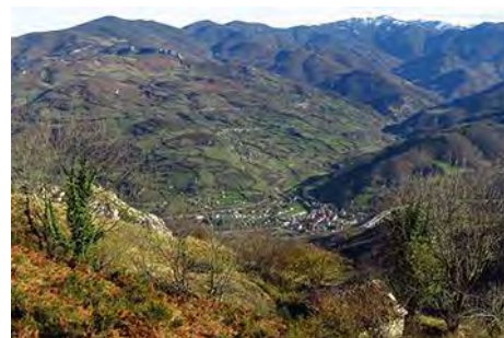
Abajo tenemos Campomanes

Por debajo de los 800 metros de altura, cuando llevamos una hora de bajada, y justo en una curva a la izquierda, encontramos un desvío a la derecha. Ésta es la zona de los Altos del Teso y ése es el camino por el que dejamos la pista y seguimos bajando durante media hora más para volver a Valle. Es en realidad parte del PR AS-87, aunque no está muy señalizado. Pasamos entre bosque de castaño y prados muy cuidados, con Zureda enfrente, para ver al poco Valle bajo nosotros, pasar por el cruce por el que subimos a la subida y de ahí llegar al pueblo y al coche en pocos minutos más (20 minutos desde el desvío de la pista a Tiós).