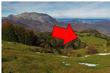
Empezamos a bajar, buscando la pista