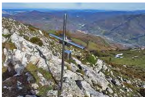
En el Manolete, con La Pola allá abajo