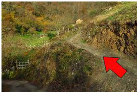
Desvío a la izquierda, nada más salir de Valle