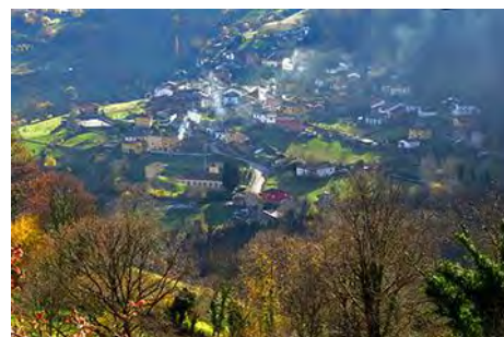
Zureda al fondo; al poco ya estamos en Valle

En total, la ruta nos lleva casi cinco horas, contando algunas paradas cortas, para superar los 800 metros de desnivel positivo que separan el inicio de la cima. Es una ruta para hacer casi todo el año, pero puede que a finales de primavera y en verano el tramo más matorral nos compliquen el paso. Disfrutad la ruta y sus vistas. Un saludo del Maquis.