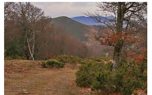
Bajando al Tronco, el Curuchu al fondo

A continuación, siempre rumbo Norte por la pista, remontamos duramente los metros perdidos hasta el vértice y enorme cruz que coronan el Curuchu Braña (1317 metros, casi una hora desde los Carriles y algo más de dos horas desde Llanos).