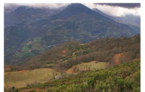
Bajando, con el valle de Pajares delante