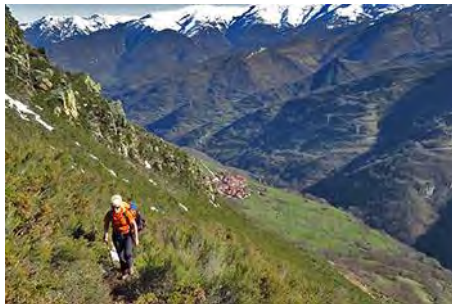
Parte superior, con el pueblo allá abajo