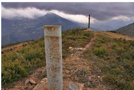
Vértice y cruz del Curuchu Braña

Para bajar, tenemos que volver al Sur, sin tener que llegar al Puerto del Tronco. Unos metros antes, nos fijamos en una pista que baja al Este (nuestra izquierda) por la que iniciamos el descenso.