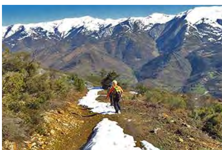
Inicio de la pista de bajada a Llanos

Disfrutad las rutas y un saludo del Maquis.