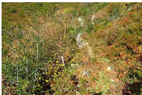
En este estilo seguimos un rato...