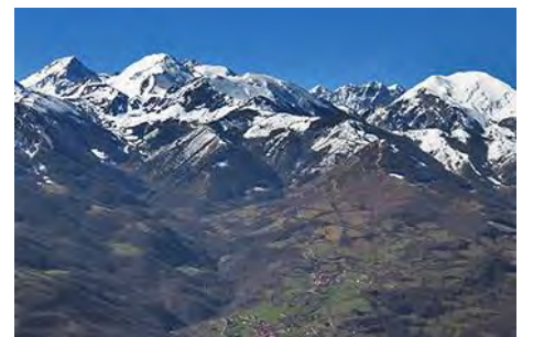
Las Ubiñas nevadas, todo un espectáculo

Esta pista, de reciente factura, nos devuelve directamente a Llanos, en menos de una hora de cómodo y constante descenso, a través de prados y bosques, dejando atrás las Ubiñas pero muy bien acompañados por el cordal de La Carisa y los montes de Pajares. Así, en menos de cuatro horas de paseo incluyendo las paradas, hemos completado esta sencilla pero gratificante circular.