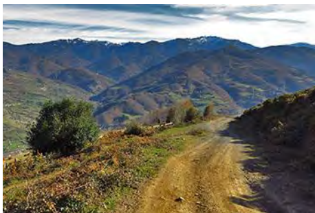
La pista, con el Cellón al fondo