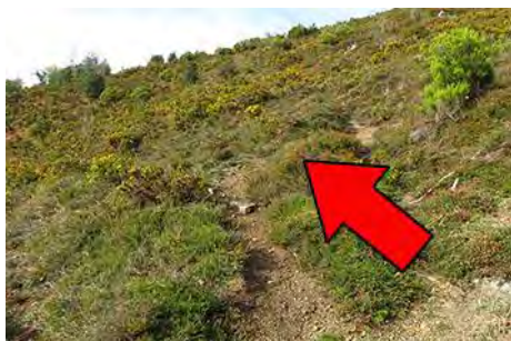
El punto donde girar a la izquierda

Obviando encima de nuestras cabezas una zona despejada con cabaña (sale en el mapa del IGN), pero que no tiene salida, vamos un rato por la estrecha senda rumbo Oeste, atravesando el pequeño valle y siguiendo un rato más en esa dirección. Finalmente salimos de pronto al fin de una pista, cabaña y prado cercado. Es la zona de la Mortera de Brañavalera (media hora desde el desvío). Llevamos casi dos horas de ruta desde el pueblo y la cima no nos queda mucho más lejos, pero todavía hay que caminar un rato.