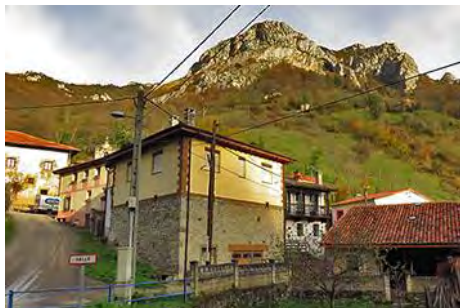
Valle, con el pico allá arriba