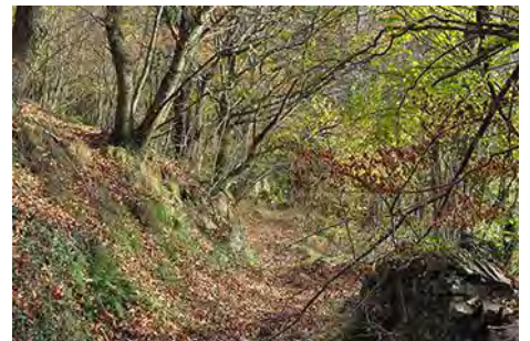
Remontando entre prados y bosques

Llevamos cerca de una hora desde que salimos del pueblo. La senda, ahora estrecha pero aún bien visible, vuelve a buscar el fondo del valle, dejando la divisoria a la izquierda. Éste es el punto a tener en cuenta de la ruta, ya que al poco rato, sobre la cota de 1165 metros de altitud, hemos de buscar un leve rastro a la izquierda (sobre hora y cuarto desde el pueblo). Éste es el desvío que no debemos pasarnos. Como orientación, hay que recordar que está justo antes que el camino por el que vamos pase junto a unos muros y se adentre de nuevo en la vallina. Por este nuevo sendero, pisado por el ganado y que en breve corre riesgo de taparse, pasa por el filo de la loma y se adentra en una nueva vallina hacia la izquierda.