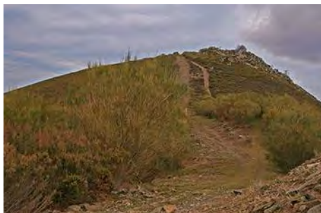
El collado: por la derecha a la primera cima

En una hora o poco más, llegamos a un collado a casi 1300 metros de altitud, donde salen las Ubiñas a saludarnos. Nos topamos también con una ancha pista que recorre todo el lomo del cordal. El gasoducto pasa por debajo. Ahora sólo nos queda girar al Norte y subir a la primera cima. El Pico Los Carriles (1348 metros) es apenas unas rocas que se encuentran a la izquierda de la pista, poco más altas que el resto, por lo que nos desviamos unos metros para llegar al montón de piedras que señalan la cumbre. Coronado este difícil hito, seguimos en llano durante un buen rato por la pista. Finalmente, en un tramo muy guapo por el bosque, perdemos 100 metros de altura mientras vemos ya enfrente el Curuchu, todavía algo lejos. Tenemos que bajar hasta el collado del Puerto del Tronco.