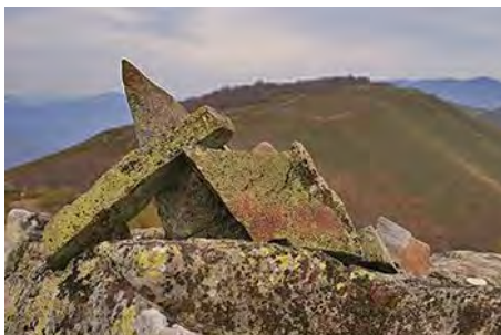
Cima de Los Carriles y vista al Norte