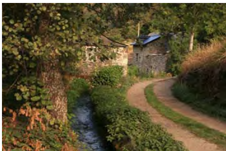
Salimos de Salentinos, rumbo Este

Cruzando Salentinos, al Este sale una pista que cruza el río nada más abandonar el pueblo. Es una ruta señalizada (PR LE-45) que en leve subida nos acerca entre los robles lentamente hasta la braña de Salentinos, pasando al lado de una de las pocas fuentes que encontraremos en el recorrido (Las Chávanas) hasta llegar en una hora a la braña. Aquí, junto al cuidado refugio y otra cabaña más, sube una pista al Norte que es por la que bajaremos dentro de unas horas. De momento, continuamos por la principal que sube hacia el Este para morir al poco rato en unos amplios prados. No importa, ya que veremos de forma evidente la ruta enfrente de nosotros.