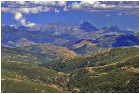
Al fondo, el macizo de Ubiña

Nos hemos ganado descansar un rato y disfrutar de las vistas desde aquí, que complementan las que tuvimos en las cimas anteriores.