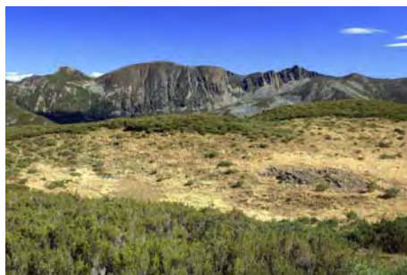
Lagunas secas, al fondo Cerneya y Catoute