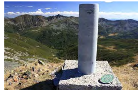
Vértice cimero con el Catoute lejano al fondo

Llega la hora de bajar. Al principio, bajamos al Sur la ladera cimera, hasta un ancho collado, por terreno despejado. Una vez en la larga loma que lleva al Alto de la Carranca, tenemos dos opciones. La primera, más segura, es seguir el cordal casi por entero para buscar una senda de ganado que nos baja al llano inferior. Aquí, lo cruzamos entero para buscar un sendero que desde arriba se ve claramente y abajo ya no tanto; éste nos baja al paraje del Chozo Las Murias, donde sólo quedan sus ruinas. Aquí encontraremos una pista que es la que nos baja ya a la braña de Salentinos (unos 50 minutos desde el Chao al chozo y casi hora y media hasta la braña).