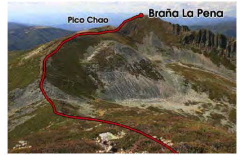
Camino a las dos cimas que nos quedan

Ahora toca ir a buscar la cuarta cima de la jornada. Retrocedemos la cresta hacia el Sur y doblamos a la derecha (Oeste, para bajar la empinada ladera que nos conduce al collado que separa esta cima de la de la Braña La Pena. Desde el collado, remontamos los 100 metros que nos separan de la cumbre, a 2100 metros de altura, donde llegamos en unos 20-25 minutos desde el Valdiglesia. Desde aquí bajamos al Oeste para llegar a la cota con vértice llamada Pico Chao, de 2046 metros, en sólo diez minutos más de camino.