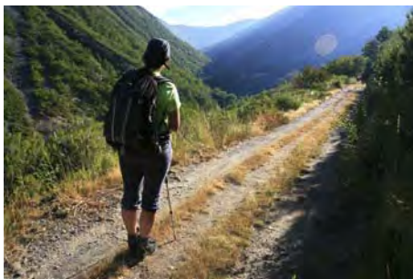
Pista por la que remontamos el valle