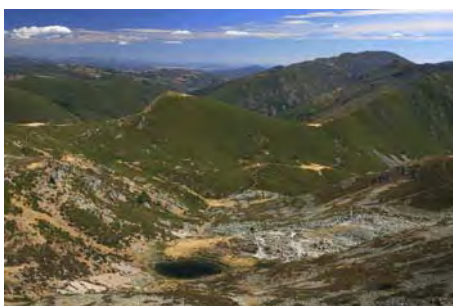
Dejamos la laguna de La Robeza al Este