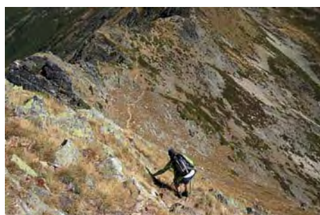
Últimos metros de subida, todo de frente

Llega el momento de seguir. Descendemos por terreno empinado al Norte (mucho cuidado con hielo o nieve) y vamos por la vertiente Este bajo los fieros resaltes rocosos que bajan de la cima, hasta que un rato después ganamos ya la ancha cresta y remontamos por ella hasta la cima de la Cerneya, que aunque no lo parezca es más alta que el Catoute (2119 metros, media hora desde este último).