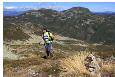
Parte final, con el Valdiglesia detrás