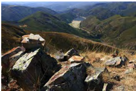
Embalse de Matalavilla desde el Braña La Pena

Ahora toca ir a buscar la cuarta cima de la jornada. Retrocedemos la cresta hacia el Sur y doblamos a la derecha (Oeste, para bajar la empinada ladera que nos conduce al collado que separa esta cima de la de la Braña La Pena. Desde el collado, remontamos los 100 metros que nos separan de la cumbre, a 2100 metros de altura, donde llegamos en unos 20-25 minutos desde el Valdiglesia. Desde aquí bajamos al Oeste para llegar a la cota con vértice llamada Pico Chao, de 2046 metros, en sólo diez minutos más de camino.