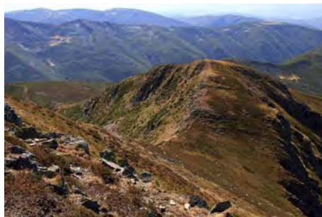
Debajo de nosotros el Pico Chao