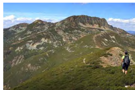
Llegando al collado, el Valdiglesia delante