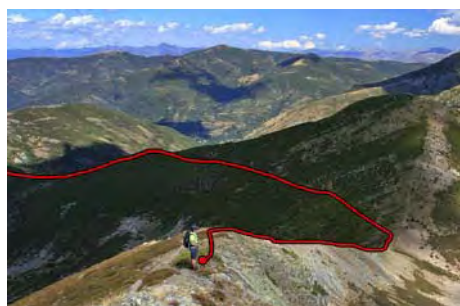
Bajando a buscar el collado de Tierrafracio

Perdemos altura desde La Cerneya al Norte, con la laguna de La Robeza al Este. La siguiente cota es la Peña Robeza o Carnicera, que no subiremos. El sendero va por su izquierda, por la ladera Oeste, esquivando la cima. Tras dejarla atrás, seguimos ahora por terreno más difuso para llegar tras media hora de camino al amplio collado de Tierrafracio, a 1800 metros, que separa los valles de Salientes y Salentinos. Aquí podemos abandonar si el tiempo o las fuerzas no acompañan, buscando entre el brezo el sendero que baja al Sur, a la pista por la que subimos hace un rato. Nosotros seguiremos hacia el Oeste, siguiendo trazas de senda y remontando pesadamente los 300 metros de desnivel y un par de lomas previas antes de afrontar la subida final a la cresta cimera, doblando luego a la derecha para alcanzar la cima del Valdiglesia, cota más alta de la sierra con sus 2136 metros (sobre hora y media de ruta desde La Cerneya).