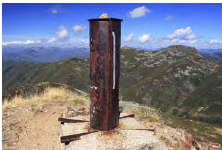
Vértice cimero, 2112 metros de altura