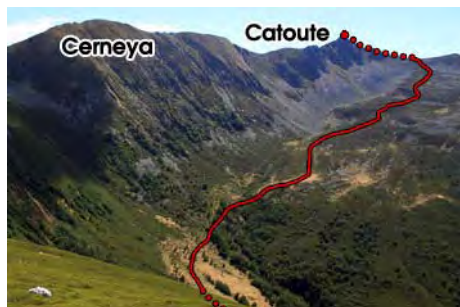
Vista general de la subida al Catoute