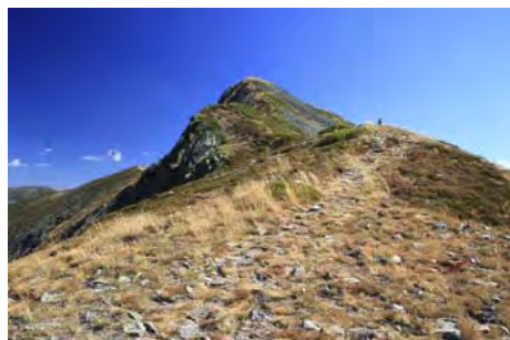
Últimos metros de subida, todo de frente