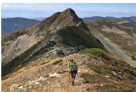
Dejando atrás ya el Catoute