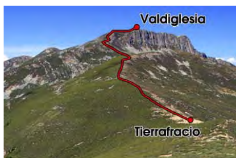
Hacia la tercera cima del día