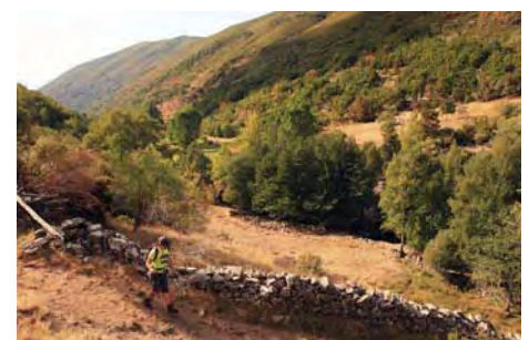
Bajando al río en la parte final de la ruta

Y así terminamos este recorrido casi integral por las cimas de la Sierra de Gistredo, muy frecuentada por montañeros bercianos y que a nosotros nos queda tan lejana. Cargaos bien de agua y disfrutad con cuidado y respeto de estas alturas. Un saludo del Maquis.