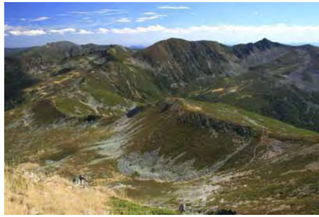
Lo que llevamos recorrido hasta ahora