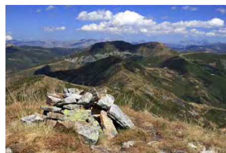
Cima de la Cerneya, con el Tambarón al fondo

Perdemos altura desde La Cerneya al Norte, con la laguna de La Robeza al Este. La siguiente cota es la Peña Robeza o Carnicera, que no subiremos. El sendero va por su izquierda, por la ladera Oeste, esquivando la cima. Tras dejarla atrás, seguimos ahora por terreno más difuso para llegar tras media hora de camino al amplio collado de Tierrafracio, a 1800 metros, que separa los valles de Salientes y Salentinos. Aquí podemos abandonar si el tiempo o las fuerzas no acompañan, buscando entre el brezo el sendero que baja al Sur, a la pista por la que subimos hace un rato. Nosotros seguiremos hacia el Oeste, siguiendo trazas de senda y remontando pesadamente los 300 metros de desnivel y un par de lomas previas antes de afrontar la subida final a la cresta cimera, doblando luego a la derecha para alcanzar la cima del Valdiglesia, cota más alta de la sierra con sus 2136 metros (sobre hora y media de ruta desde La Cerneya).