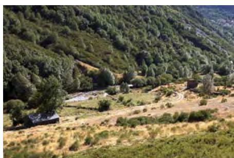
Llegando a la Braña Salentinos