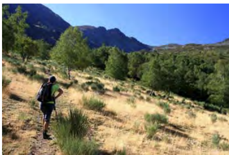
Se acaba la pista, sigue la subida