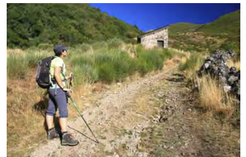
La Braña de Salentinos con el refugio delante

El sendero señalizado, marcado y claro, va ahora hacia el Sur. Remonta decididamente la ladera bajo las cimas que más tarde recorreremos, por terreno despejado que poco a poco, tras dejar a un lado la cima del Catoute, gana un amplio collado encima ya de la cota 2000 (una hora desde el final de la pista, hora y media desde la braña y algo más de dos horas desde Salentinos). Sólo hay que girar a la izquierda y superar los 100 metros que nos separan de la cima, en diez minutos de subida, para disfrutar de las vistas.