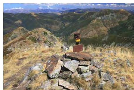
Buzón cimero de la Peña Valdiglesia