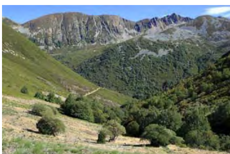
Valle y pista que nos bajan a la braña

Como comentábamos más arriba, desde el chozo encontramos una pista que recorre el valle rumbo Sur, primero en llano y finalmente en fuerte descenso. En poco más de 20 minutos aparecemos en la braña Salentinos. Ahora nos espera una pesada hora de descenso por la pista hasta el pueblo, aunque hay una variante para amenizar la vuelta en la parte final: tras pasar un cierre, antes del tramo de subida, baja un camino a la derecha que nos permite cruzar el río por un estrecho puente y seguir por la otra orilla hasta Salentinos.