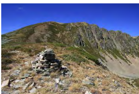
Últimas cuestas antes de la cima