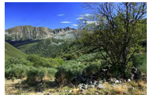
Lo que queda del Chozo Las Murias

Como comentábamos más arriba, desde el chozo encontramos una pista que recorre el valle rumbo Sur, primero en llano y finalmente en fuerte descenso. En poco más de 20 minutos aparecemos en la braña Salentinos. Ahora nos espera una pesada hora de descenso por la pista hasta el pueblo, aunque hay una variante para amenizar la vuelta en la parte final: tras pasar un cierre, antes del tramo de subida, baja un camino a la derecha que nos permite cruzar el río por un estrecho puente y seguir por la otra orilla hasta Salentinos.