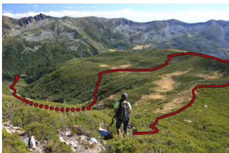
El camino de descenso a seguir la próxima hora

Una opción para acortar algo la bajada es tirarnos abajo una vez llegados a la loma y bajar por la primera vallina que encontramos, usando sendas de ganado. Atajaremos unos 20 minutos, pero el terreno cerrado de escoba nos va a molestar bastante. En la parte alta, aún podemos caminar bien, pero en la parte inferior, justo por encima del Chozo Las Murias, empeora y se cierra mucho, bajando casi al final a las bravas entre el matorral, por lo que recomendamos no ceder a la tentación del atajo y seguir por el camino largo.