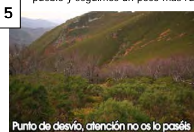
Punto de desvío, atención no os lo paséis

Seguimos un rato en llano, por el PR, que hace un quiebro al pasar por una fuente; aquí obviamos un evidente camino que parece querer bajar al pueblo y seguimos un poco más rumbo Norte.