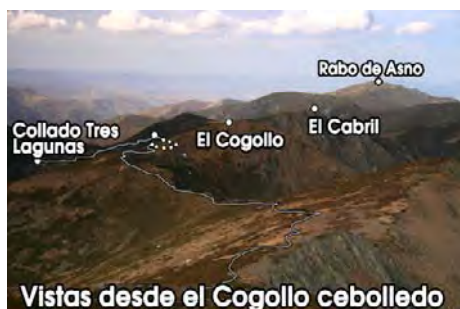
Vistas desde el Cogollo cebolledo