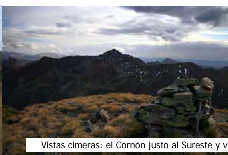
Vistas cimeras: el Cornón justo al Sureste y vistas hacia el Este, de La Penouta hasta Ubiña.