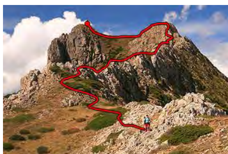
Más abajo, mirando hacia atrás