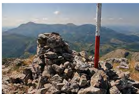
La cima, con Peña Rionda al Sureste