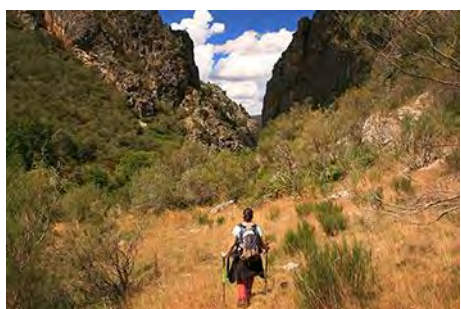
Enfilando por el PR ya a la Foz Oscura

Volvemos sobre nuestros pasos al collado bajo la Piedra del Agua. Es el momento de bajar por el Valle de Peña Llampa, que puede ser más trabajoso de lo que parece. Empezamos el descenso al Oeste por la parte derecha pero casi al centro, por terreno despejado entre la escoba. Seguiremos por un leve sendero, que puede estar bastante tomado por la maleza. El sendero nos va bajando a una zona más clara, ya bastantes metros por abajo, hasta que confluimos al fondo nuevamente con el PR LE-25 (casi media hora desde el collado). Ya no lo abandonaremos. Ahora tenemos que torcer al Norte, encarando la Foz Oscura, un corto pero muy guapo tramo entre peñas de esa tonalidad que el sendero atraviesa en 10 minutos para desembocar en una nueva pista, que baja al Noroeste. Pasamos otra vez bajo la carretera y llegamos así de vuelta a Horcadas (25 minutos desde La Foz, hora y cuarto desde la cima de la Piedra del Agua).