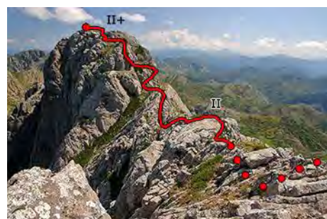
El paseo de altura entre las dos cimas

Ahora afrontamos el primero de los puntos delicados de la ruta, que es el llegar a la cima Norte del Moro. Es un tramo con algunos pasos de II grado, aéreos y con caída, que hay que hacer con cuidado: primero bajamos a la horcada entre las cumbres, con un breve destrepe, luego atravesamos la horcada (pasos de II) y trepamos a la pirámide cimera. Justo antes de la cima, un paso de II+ sobre el vacío en plena cresta nos separa de los 1801 metros del Pico Moro Norte (15 minutos desde la cima Sur).