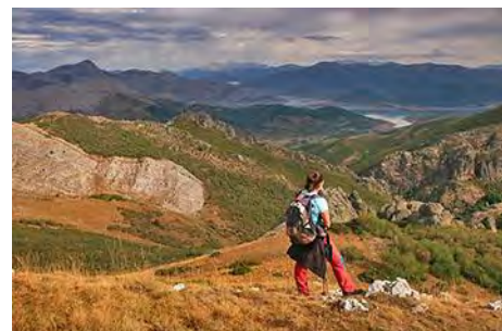
Bajo la cima, con el pantano al fondo