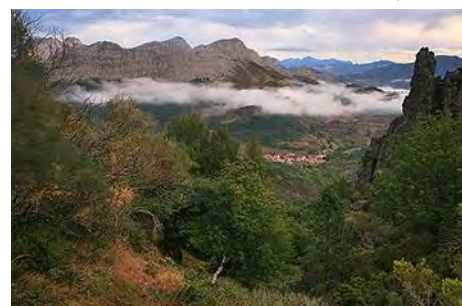
En la foz: Horcadas abajo y el Gilbo enfrente

Ya estamos bajo las Peñas del Diablo, curioso afloramiento de conglomerados que, como llamaradas, se levanta sobre el puerto. Nuestra ruta abandona aquí el PR y va a atravesarlas, hacia la visible cima del Hato, primera cima de hoy. Pasando por entre las peñas, remontamos directamente al Sur la loma cimera y coronamos sus 1749 metros en 40 minutos más (hora y tres cuartos desde Horcadas).