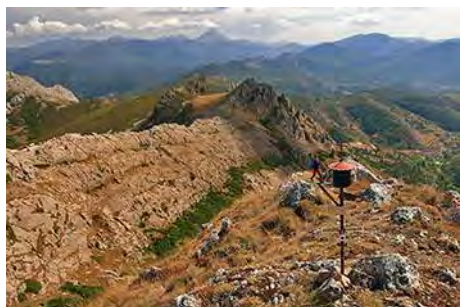
Mirando al Espigüete en el Pico Loto

Media hora nos separa de la siguiente cima, la más alta del trío de hoy: el Pico Loto. Sólo tenemos que perder altura rumbo Este y remontar luego bajo la cresta, casi siempre por la vertiente izquierda (Norte) para coronar el vértice cimero del Loto, a 1805 metros de altura. Aquí podemos darnos un buen homenaje descansando con las vistas a la montaña leonesa y buena parte ya de la palentina.