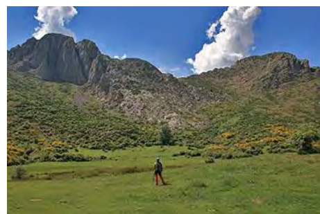
En el Valle, bajo el Moro y Peña Rionda

Nos acercamos primero a la base del Pico Moro, donde topamos la fuente que nos puede venir muy bien, sobre todo a la vuelta. Aquí seguimos rastro de ganado hasta llegar junto a la collada Genciana, con el pico encima de nosotros a nuestra derecha. Aquí, aparece un camino que nos sube en rápidas revueltas hasta coronar la cima Sur del Pico Moro (1783 metros, 45 minutos desde el fondo del valle).