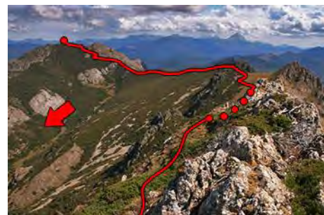
Ruta al siguiente pico y valle de bajada

Ahora cogemos la arista a la izquierda de la cima que se escapa en suave descenso rumbo Este, sobre el pueblo de Tejerina. En su parte inicial es afilada, lo que da su punto de emoción (ojo en invierno, con hielo). Más abajo gana anchura y nos hace pasar lomas y campas hasta un amplio collado. A la izquierda, el valle por el que tendremos que bajar luego. Enfrente, la tercera cima de hoy. Remontamos y dejamos a la derecha una cota secundaria para ganar finalmente los 1784 metros de la Piedra del Agua (casi una hora desde el Loto). Las vistas sobre el valle y embalse de Riaño, las montañas circundantes y los Picos de Europa merecen el esfuerzo de acercarse aquí.