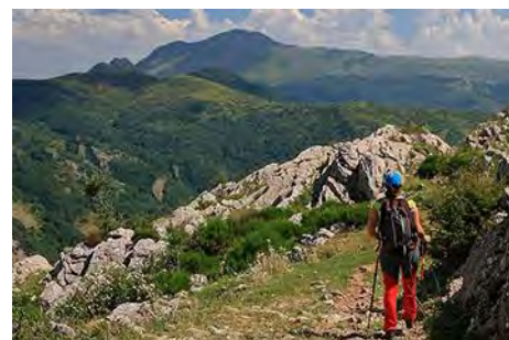
Volviendo a Ocejo con Peñacorada al fondo

Y así termina este recorrido, que sin prisa pero sin mucha pausa nos permite coronar tres magníficos picos, con tramos no exentos de emoción, en una seis o siete horas de paseo, según nos deleitemos en las cimas. Aún nos quedan cimas en la montaña oriental leonesa para dar y tomar, pero de momento aquí dejamos estos dos aperitivos. Disfrutadlos con cuidado y suerte con la meteo y las vistas. Un saludo del Maquis.