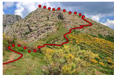
Abajo ya, mirando la subida al Cerroso