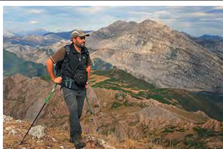
En la cima del Hato: Peñas Pintas al Oeste