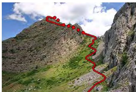
A por la cima de Peña Rionda