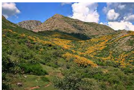
El Cerroso desde la pista, en el valle