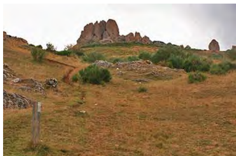
Puerto de Horcadas y Peñas del Diablo

Ya estamos bajo las Peñas del Diablo, curioso afloramiento de conglomerados que, como llamaradas, se levanta sobre el puerto. Nuestra ruta abandona aquí el PR y va a atravesarlas, hacia la visible cima del Hato, primera cima de hoy. Pasando por entre las peñas, remontamos directamente al Sur la loma cimera y coronamos sus 1749 metros en 40 minutos más (hora y tres cuartos desde Horcadas).