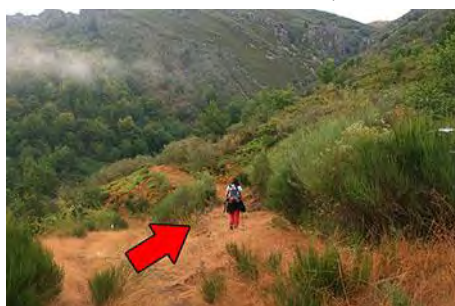
Desvío a la derecha hacia Los Escalones