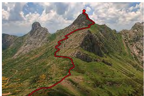
El escabroso descenso de Peña Rionda

La bajada de Peña Rionda nos depara el segundo punto conflictivo del día. Se hace por su cara Oeste, una pendiente de hierba muy empinada. Si la encontramos mojada, ya no decir con nieve o hielo, es mejor volver hacia atrás. En buenas condiciones permite un cuidadoso descenso, buscando el punto débil en un zigzag diagonal, no exento de exposición, hasta una amplia pradera inclinada. Nos vamos al Noreste, buscando un hombro que nos permite salir a la cara Este. Bajamos aquí hasta la base de la montaña y luego giramos al Norte por senda de ganado a un nuevo collado, que separa Peña Rionda del tercer pico de hoyo, el Cerroso (30 minutos de bajada).