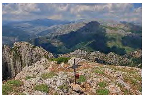
El Mampodre allá al Noroeste