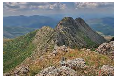
El Moro desde la cima de Peña Rionda

La bajada de Peña Rionda nos depara el segundo punto conflictivo del día. Se hace por su cara Oeste, una pendiente de hierba muy empinada. Si la encontramos mojada, ya no decir con nieve o hielo, es mejor volver hacia atrás. En buenas condiciones permite un cuidadoso descenso, buscando el punto débil en un zigzag diagonal, no exento de exposición, hasta una amplia pradera inclinada. Nos vamos al Noreste, buscando un hombro que nos permite salir a la cara Este. Bajamos aquí hasta la base de la montaña y luego giramos al Norte por senda de ganado a un nuevo collado, que separa Peña Rionda del tercer pico de hoyo, el Cerroso (30 minutos de bajada).