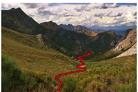
Ahora, a bajar por el valle a la Foz Oscura

Volvemos sobre nuestros pasos al collado bajo la Piedra del Agua. Es el momento de bajar por el Valle de Peña Llampa, que puede ser más trabajoso de lo que parece. Empezamos el descenso al Oeste por la parte derecha pero casi al centro, por terreno despejado entre la escoba. Seguiremos por un leve sendero, que puede estar bastante tomado por la maleza. El sendero nos va bajando a una zona más clara, ya bastantes metros por abajo, hasta que confluimos al fondo nuevamente con el PR LE-25 (casi media hora desde el collado). Ya no lo abandonaremos. Ahora tenemos que torcer al Norte, encarando la Foz Oscura, un corto pero muy guapo tramo entre peñas de esa tonalidad que el sendero atraviesa en 10 minutos para desembocar en una nueva pista, que baja al Noroeste. Pasamos otra vez bajo la carretera y llegamos así de vuelta a Horcadas (25 minutos desde La Foz, hora y cuarto desde la cima de la Piedra del Agua).