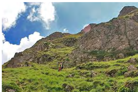
Vertiginoso prado por el que bajar