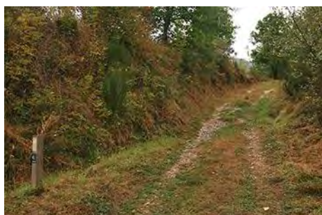
Primeros metros de pista, por el PR