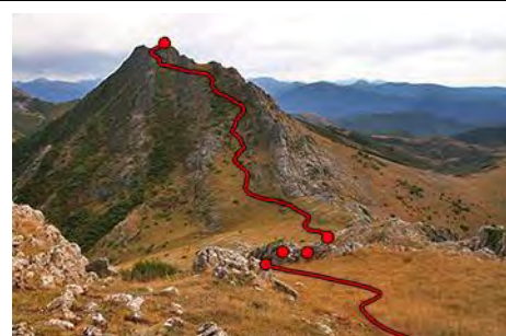
El camino a seguir para el Pico Loto