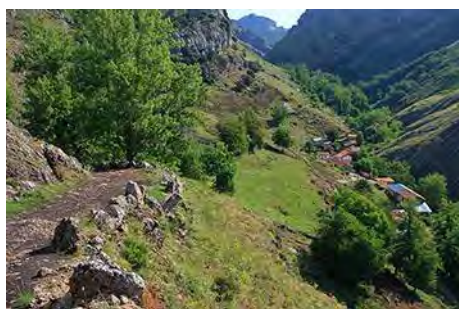
Ocejo abajo, primeros metros de pista