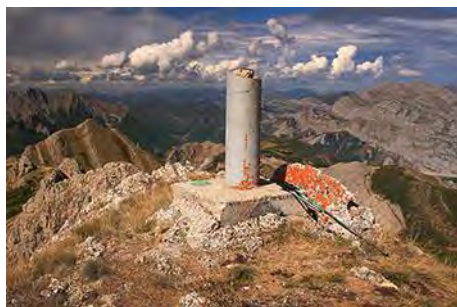
Vértice cimero y vistas al Sureste