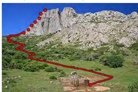
La fuente y camino a la cima Sur del Moro

Nos acercamos primero a la base del Pico Moro, donde topamos la fuente que nos puede venir muy bien, sobre todo a la vuelta. Aquí seguimos rastro de ganado hasta llegar junto a la collada Genciana, con el pico encima de nosotros a nuestra derecha. Aquí, aparece un camino que nos sube en rápidas revueltas hasta coronar la cima Sur del Pico Moro (1783 metros, 45 minutos desde el fondo del valle).