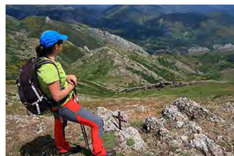
Mirando abajo, al valle

Por el mismo camino de subida bajamos al collado entre Peña Rionda y el Cerroso (collado Argovejo). Aquí nos tiramos al Este por una ancha traza. Al poco nos lleva a una pista, que seguimos al Sur hasta que desemboca en los pastos del Valle del Pico Moro, cerca de donde salimos a la subida (unos 45 minutos desde el Cerroso). Podemos desviarnos a coger agua en la fuente o torcer al Este, a buscar el camino por el que accedimos al valle. Ya sólo tenemos que deshacer el camino de subida y volver a Ocejo en 45 minutos más.