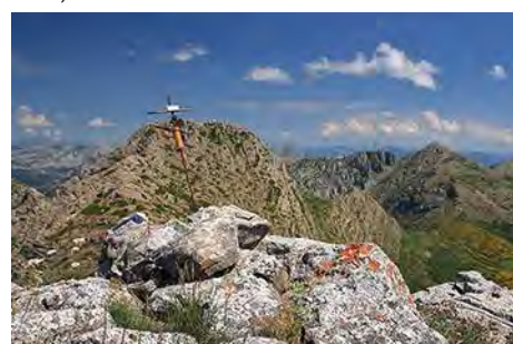
Cima Norte: Peña Rionda y el Cerroso atrás