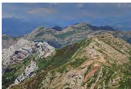
El Hato y el Loto justo al Norte, bien cerca