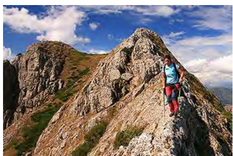
Escabroso inicio de la bajada del Loto

Ahora cogemos la arista a la izquierda de la cima que se escapa en suave descenso rumbo Este, sobre el pueblo de Tejerina. En su parte inicial es afilada, lo que da su punto de emoción (ojo en invierno, con hielo). Más abajo gana anchura y nos hace pasar lomas y campas hasta un amplio collado. A la izquierda, el valle por el que tendremos que bajar luego. Enfrente, la tercera cima de hoy. Remontamos y dejamos a la derecha una cota secundaria para ganar finalmente los 1784 metros de la Piedra del Agua (casi una hora desde el Loto). Las vistas sobre el valle y embalse de Riaño, las montañas circundantes y los Picos de Europa merecen el esfuerzo de acercarse aquí.