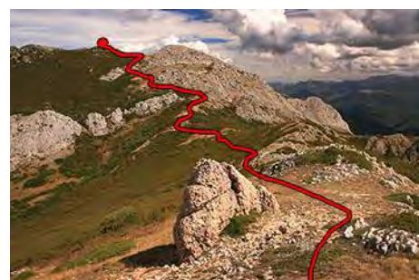
Lo que queda por subir a la Piedra del Agua