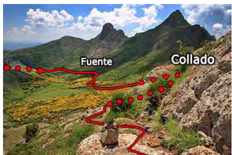
Bajando vemos la ruta de vuelta por el valle

Por el mismo camino de subida bajamos al collado entre Peña Rionda y el Cerroso (collado Argovejo). Aquí nos tiramos al Este por una ancha traza. Al poco nos lleva a una pista, que seguimos al Sur hasta que desemboca en los pastos del Valle del Pico Moro, cerca de donde salimos a la subida (unos 45 minutos desde el Cerroso). Podemos desviarnos a coger agua en la fuente o torcer al Este, a buscar el camino por el que accedimos al valle. Ya sólo tenemos que deshacer el camino de subida y volver a Ocejo en 45 minutos más.