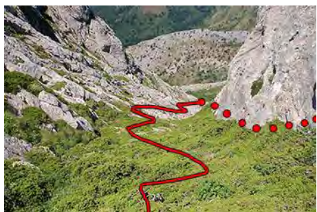
Canal al Oeste para escapar del Moro

Toca volver, con cuidado, pero sólo hasta la horcada entre las cimas. Aquí nos tiramos al Oeste entre arbusto y roca por una empinada canal. En su parte baja giramos a la derecha, buscando el lugar más propicio que veamos, para pasar por debajo de los paredones de esta vertiente del Moro, rumbo Norte. El objetivo es ir hacia la collada que separa el pico de Peña Rionda, a la que accedemos sin mayor dificultad. Y una vez aquí, subimos por la arista hasta hacer cima en la peña (1833 metros, una hora más desde el Moro Norte).