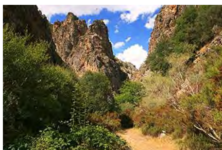
Dentro de la pequeña foz