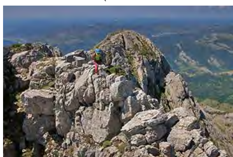
Atravesando la cresta (II+) antes de la cima