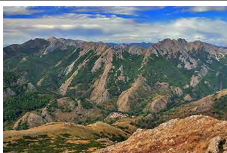
Al Sur, Remolina bajo el Pico Jano