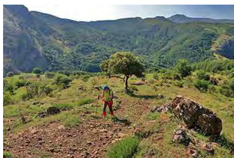
Por el Prado de los Casados