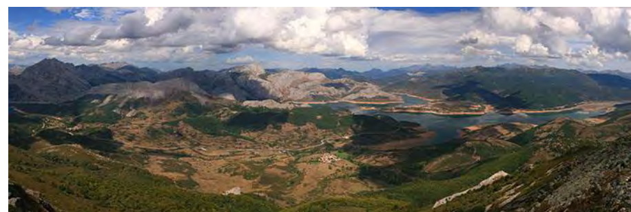
Vista Oeste: Peñas Pintas, Gilbo, Yordas, Riaño y Pandián, los Picos de Europa al fondo...