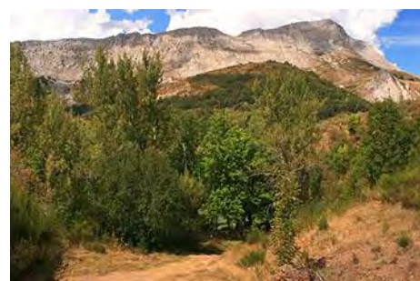
En la pista, con el Gilbo otra vez enfrente

Y así, en menos de cinco horas de tranquilo paseo, sacamos adelante esta completa y variada ruta. Tenemos alguna fuente en la subida, antes del Puerto de Horcadas (Fuente La Prada), pero por si acaso mejor subir bien cargados. Aparte de algún corto tramo por biesca en la parte baja, iremos casi siempre por terrenos abiertos que nos permiten gozar de las vistas.