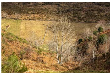
Con el Camín Cimeru enfrente al bajar a la riega

Bajamos así al valle de la Riega La Chana, que lanza sus aguas abajo al Pigüeña. Enfrente vamos a ver la senda por la que subimos, el Camín Cimeru . Nosotros saldremos unos metros por debajo, el Camín Bajeru , que en suave descenso nos deja otra vez en Quintanal, en la parte inferior del pueblo, en unos 50 minutos desde La Espina (hora y media de bajada desde la cima de Peña Manteca).