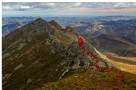
La Vallinona al lado. Ya que estamos aquí...

Como la intención es terminar bajando por una ruta distinta, nada más pasar La Espina, junto a los campos de Cuxu cambiaremos el rumbo. Si para subir pasamos por Brañavieja, ahora la dejamos a la izquierda y seguimos un rato más en dirección Sureste. Al bajar a la siguiente vallina nos desviamos a la izquierda por un camino a veces algo embarrado y con matorral, pero aún de buen caminar.