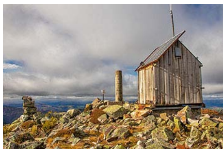
Caseta y vértice cimero, 1521 metros