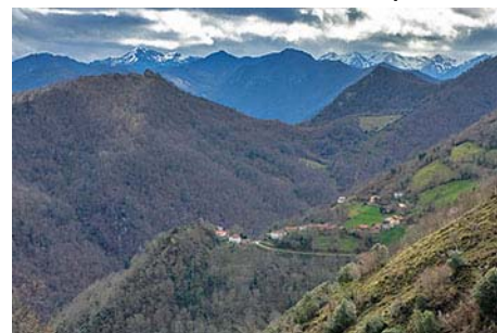
San Esteban, al fondo el Mocosu y el Cornón

Y así le rendimos una merecida visita al techo de Belmonte, gran mirador y sobresaliente hito, en una casi cómoda ruta (quitando la parte superior) que nos llevará en poco más de cuatro horas, contando paradas. Suerte con la meteo y un saludo del Maquis.