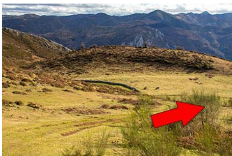
Subimos por la izquierda; ahora por el otro lado