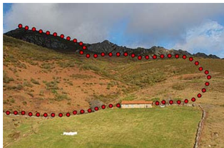
La cabaña y el camino a la cima

Bordeamos una riega por la izquierda para acceder a una solitaria cabaña (una hora desde el pueblo). Ésta marca el punto donde las rodadas nos suben de forma directa a las campas bajo la cara Este del pico. Hasta aquí hemos llegado de forma cómoda, rápida y limpia, pero más adelante todo va a cambiar. De momento, remontamos por terreno abierto hasta que las rodadas finalizan en una campera, casi rozando la cresta de la montaña (media hora desde la cabaña). Sin embargo, aquí la escoba nos va a dificultar ganar la cima durante un buen tramo. Unos aislados abedules nos indican el punto donde salen las sendas que nos permiten esquivar los peores tramos de escoba. Algunos jitos, que son difíciles de ver con tanto matorral, nos ayudan a salir de este pesado trance, ya que el camino, aunque a veces desaparezca, existe y aún se puede seguir más o menos. Ya sea por la de buenas o por la de malas, el objetivo es acercarnos a las rocas cuarcíticas del Pico La Vallinona, donde el matorral se reduce y subimos ya por terreno más claro.