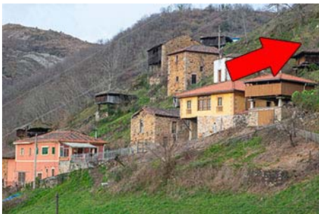
Quintanal. Subimos hacia la derecha

Haremos un descenso circular, ya que hay dos sendas que comunican el pueblo con los pastos de la parte alta. Empezamos por el camino de arriba, y para ello subimos junto a las primeras casas a la derecha, hacia la parte superior del pueblo. Aquí sale un camino empedrado, de fuerte pero cómoda subida, que nos lleva hasta una zona de prados, la mayá Quintanal, en media hora de subida.