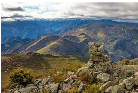
Montes de Somiedo al Sur