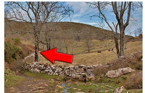
Primer cruce, giramos a la izquierda.