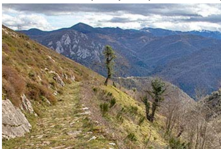
Buen camino empedrado en la parte inferior