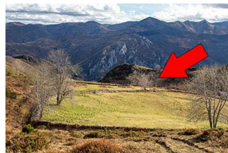
Por ahí bajaremos de vuelta al pueblo

Bajamos así al valle de la Riega La Chana, que lanza sus aguas abajo al Pigüeña. Enfrente vamos a ver la senda por la que subimos, el Camín Cimeru . Nosotros saldremos unos metros por debajo, el Camín Bajeru , que en suave descenso nos deja otra vez en Quintanal, en la parte inferior del pueblo, en unos 50 minutos desde La Espina (hora y media de bajada desde la cima de Peña Manteca).