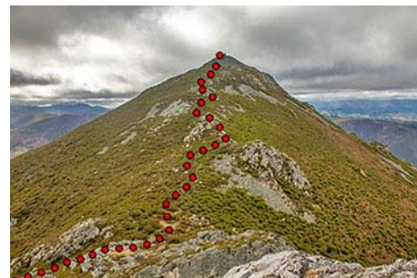
Desde La Vallinona, los últimos metros a cima