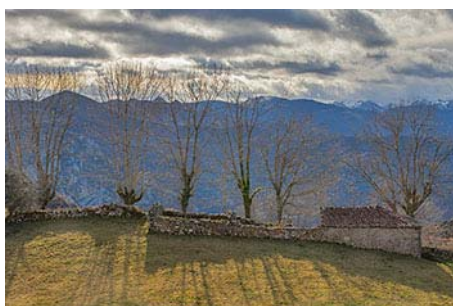
Cabañas de Brañavieja