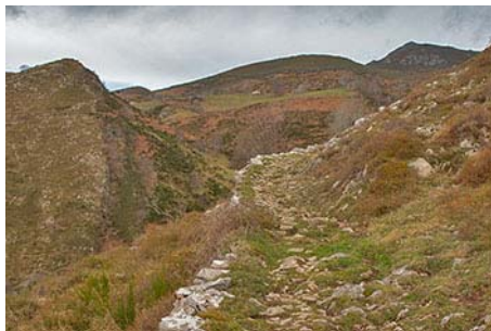
Camino empedrado con el pico allá lejano