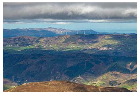
Tineo al Noroeste. Al fondo, el Capiella Martín

Bajamos deshaciendo el camino de subida. Si estamos animados, antes de abandonar la cresta podemos desviarnos para coronar la cota de La Vallinona (1474 metros), que no aporta mucho a la ruta pero se deja hacer fácilmente, apenas un par de pasos que nos pidan usar las manos para ayudarnos pero sin dificultad alguna. Bajamos luego a la cabaña y de ahí al Collao La Espina (40 minutos).