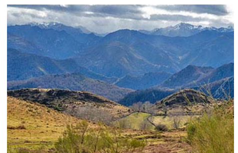
Collao La Espina, con el Valle del Pigüeña al Sur