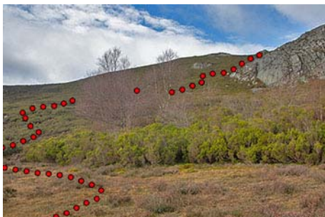
Intuyendo la senda a seguir tras los árboles