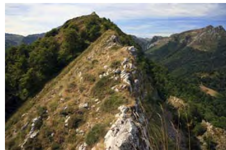
Últimos metros al Sen de los Mulos, 1505 m.