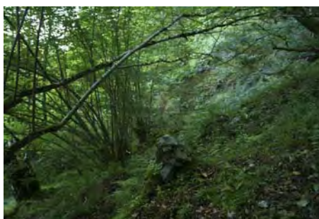
Desvío a la canal de Bodiellu, poco marcado