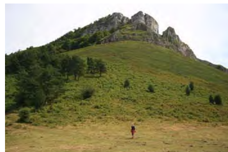
Collá Viances, bajo el Sen de los Mulos