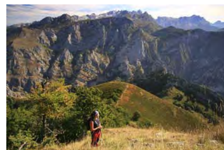
Encima del Collao Ceñal, antes de la cima...