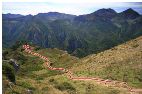
La bajada por el valle al Camino de Tolivia