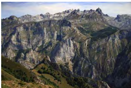
El macizo del Cornión al Este...