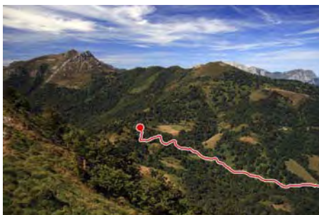
Colláu Zorru, el Raso y pista de descenso