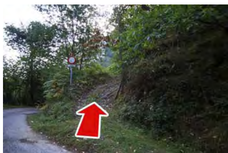
Desde la carretera, salimos por ahí...