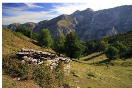
Mayá Miesca y la Porra Valdepiño al fondo...

Por encima de la mayá, al Sur, sube entre el bosque un claro por el que remontamos hasta el Collao Ceñal, pasando por los antiguos casetones mineros en media hora. Desde aquí, subimos a la derecha, por terreno incómodo de hierba y roca, hasta la cima (una hora desde Mayá Miesca)