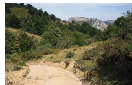
Pista de regreso a Viboli