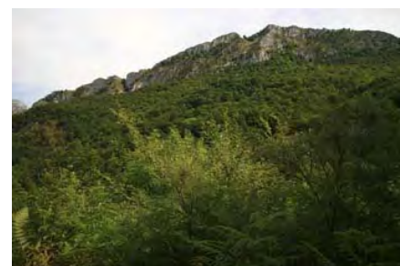
Bajando, un último vistazo a la cresta...

Es un bonito final para una ruta igualmente hermosa, colgando sobre Los Beyos, variada y con vistas incomparables, e incluso con su tramo aéreo y de trepada donde no perder la atención.