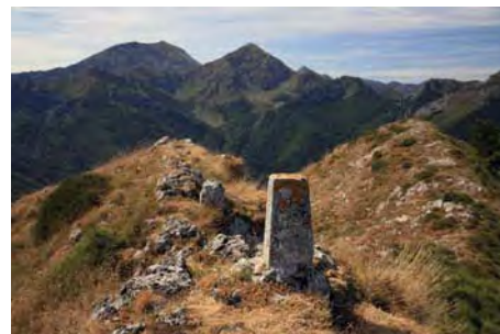
Al Sur, Ten y Pileñes...