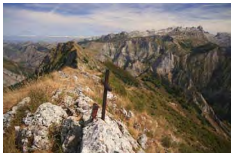
Sen de los Mulos, con Peña Subes detrás...