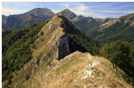
Comienzo de la cresta, al principio en descenso

Llevamos cerca de dos horas de camino, y es momento de seguir la marcha. Lo haremos rumbo Suroeste, por la cresta que comunica Subes con la siguiente cima: El Sen de Los Mulos. Al principio, es ancha, pero algo incómoda, con la típicas llastrias de la montaña de Los Beyos. Comienza en descenso para perder casi 100 metros, al Collado de La Cuestona. Aquí, nos espera una corta trepada de unos 30 metros, con dificultades de II grado, sobre el filo del resalte que se presenta encima de nosotros. Esta trepada requiere atención, ya que la roca no es muy buena calidad y hay abundante hierba y piedra suelta. Si está mojada o con nieve, puede resultar expuesto. Una vez superado este paso, la cresta vuelve a ensanchar y seguimos así, pasando un par de lomas previas, hasta la cima del Sen de los Mulos (45 minutos desde Peña Subes)