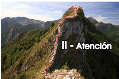
El tramo más afilado del Camino al Sen...