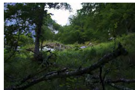
Vista hacia arriba de la canal. A subir tocan...

Ahora, vamos saliendo del bosque y empezamos a ver allá abajo el pueblo de Víboli y la Peña Salón. En la parte superior, bajo los muros, el camino, que a veces se hace difícil seguir, gira a la izquierda para buscar una brecha que nos lleve a la vertiente Norte de la Peña. Así, damos vista a Casielles, los Beyos y un tramo de llano, con ligera subida, que entre pradera y roca va buscando a la derecha los restos de la mayá Miesca, a la que llegamos después de una hora de tranquila subida desde la carretera.