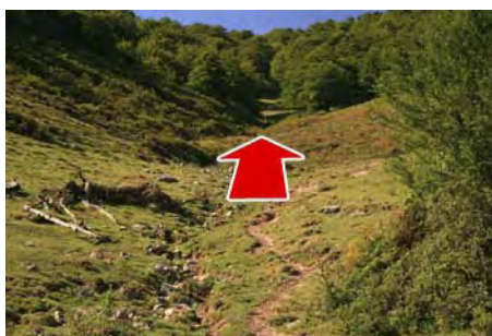
Desde aquí, remontamos al Collao Ceñal