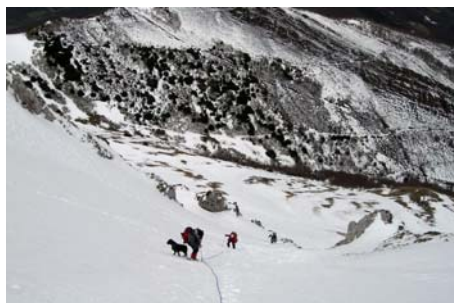
Campos de nieve intermedios