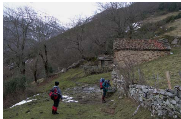
A medio camino, un breve descanso...

Ahora seguimos rumbo al evidente collado que cierra el valle (marcas rojas). Justo antes de llegar a él, nos desviamos a la izquierda para encarar ya el tramo final de la aproximación, en el paraje conocido como "Las Carboneras", tras algo más de una hora extra de camino.