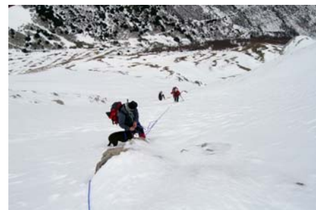
Saliendo del segundo estrechamiento

Las vistas, espectaculares... Todo el macizo de Ubiña a nuestro alrededor, el Aramo, la Cordillera Cantábrica. La ruta de descenso más factible puede ser la que baja rumbo Este hacia Manín y Lindes. Los compañeros del Maquis por el lado contrario, por la pala Oeste, y desviandonos hacia la derecha hasta la zona de Las Colladiellas, desde donde retrocedemos hacia el este valle abajo y nos encontramos con nuestra ruta de subida.