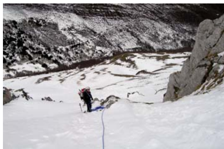
Entrando al primer estrechamiento

Partimos por los campos de nieve iniciales; la pendiente va ganando inclinación hasta los 30° mientras nos acercamos al 1° estrechamiento, entre franjas rocosas que dividen la pared. Éste puede llegar, durante unos metros, a los 40 ó 45°, para volver a relajar en su salida a los 35°. Continuamos de frente buscando el segundo, de características similares al anterior. Una vez superado, la ladera va perdiendo inclinación (hasta 25°) y, de forma cansina, nos deja en la zona cimera. Girando hacia la izquierda, llegamos hasta la cima (calcular un tiempo de dos horas para el ascenso, el desnivel de la canal ronda los 500 metros y la longitud cerca del doble...)