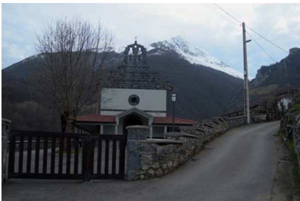
En Cortes, esto es lo que nos espera...

La ruta parte de Cortes (900 metros), subiendo hacia las casas de la parte Oeste del pueblo. Pasamos el lavadero, soslayamos una pista que pierde altura y, a la salida, tomamos una pista hormigonada que rápidamente se convierte en un resbaladizo camino empedrado. Ganamos altura, por la margen derecha del valle con el gigante sobre nuestras cabezas hasta auparnos a la zona de La Mortera. Aquí, el camino pierde algo de altura y gira a la izquierda, para llegar a la cabaña de la Fenichega (fuente); algo menos de dos horas de recorrido.