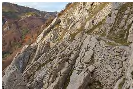
Camino bien cuidado, se notan las armaduras