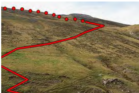
Recorrido para superar la loma al Sur