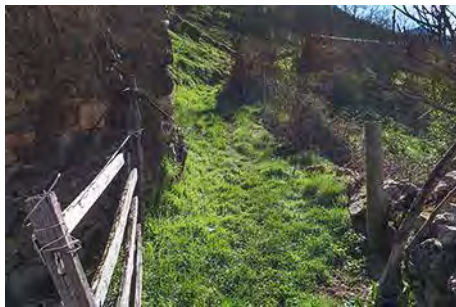
Camino de salida del pueblo, rumbo Este

Empezamos a caminar acercándonos al pueblo, justo en las primeras casas vamos a la derecha para cruzar una portilla y tomar una senda entre prados, que sube rumbo Este sobre la carretera. Tras un corto tramo entre prados la senda coge inclinación y supera la empinada ladera en sucesivas revueltas. La senda armada, llamada Sulascuencias, gana altura regalándonos vistas espectaculares sobre el valle. Desembocamos tras 45 minutos desde el pueblo en el llano que alberga la primera braña del día, Ordiales de Arbellales.