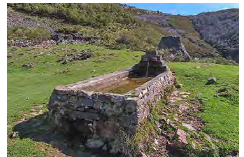
Junto a esta fuente, giramos al Norte

Hasta ahora hemos subido por plácidos senderos, y el Camín Real parece casi una autopista. Pero en breve vamos a navegar un poco entre el brezal, aunque de momento (primavera de 2022) la senda jitada que nos ayudará a coronar Peña Negra se sigue muy bien. Veremos como evoluciona el terreno dentro de unos años. Primero, pasamos una portilla y nos fijamos, más adelante, en una leve senda a nuestra derecha señalizada con jitos.