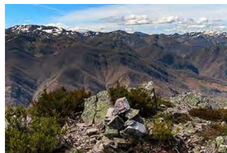
Vistas desde la cumbre Este