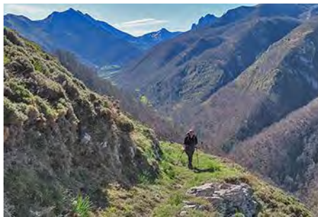
Subiendo Sulascuencias con el valle abajo