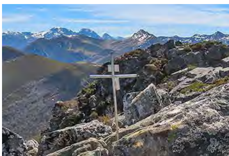
Las Ubiñas desde la cima Oeste