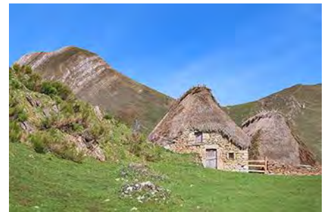
Braña de Ordiales con el Michu al otro lado

A esta braña la atraviesa el PR AS-12, la ruta de las Brañas de Sallencia. Nosotros ahora seguimos hacia arriba, en diagonal a la derecha, siguiendo un sendero de ganado que dobla la ladera. Aquí ya vemos, aún bien alta, Peña Negra. Una pista nos sale al paso, continuando por ella hasta llegar a otra braña, la de Cuérragu (una hora desde el pueblo) con muchas de sus cabanas en ruinas, pero una buena fuente donde reponer agua. Ya estamos más cerca de la peña, y ahora hacemos un giro a la izquierda para ir por otra senda, que arranca al Oeste, con Peña Michu al otro lado del valle. Entre la escoba y el pasto, remonta suavemente doblando al Norte. 10 minutos de tranquila marcha desde la braña nos depositan en el Camín Real de La Mesa, que seguiremos unos 10 minutos más