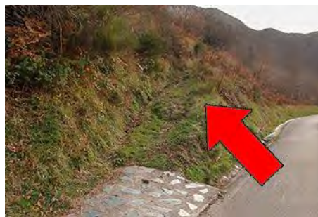
El cruce a la izquierda para subir a la foz