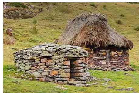
Corros y teitos en la Braña La Mesa

Seguendo el GR, que se convierte en pista, cruzamos el Colláu El Muro para pasar a la vertiente tevergana. La pista va un rato casi en llano hasta el siguiente collado, La Madalena (1 hora desde La Mesa). Éste es un cruce de caminos y nosotros tiramos a la izquierda (Oeste), una empinada pista que nos baja casi directamente al aparcamiento de Saliencia en unos 45-50 minutos, pasando mientras por los teitos de la Braña Las Morteras de Saliencia.