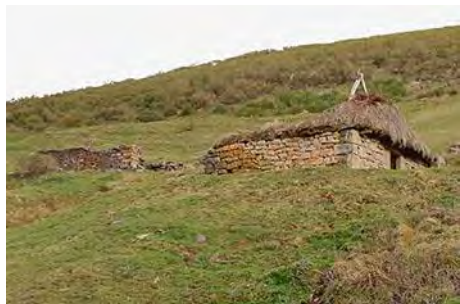
Estas cabañas nos marcan el cambio de rumbo