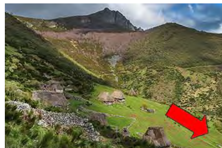
Braña de Murias y salida hacia el pueblo

En este lugar, impresionante bajo las peñas, encontraremos otra vez el PR AS-12 abajo a la derecha. En un rápido descenso, nos deja frente al último hito de la ruta, la espectacular Güérgola. Un corto desfiladero, con un camino empedrado (ojo no resbalar en mojado) y el reguero corriendo a su lado, ponen un digno colofón a la ruta y nos dejan en el pueblo en una media hora desde Murias.