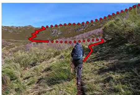
Trazado para acceder a la cima desde el Camín

Hasta ahora hemos subido por plácidos senderos, y el Camín Real parece casi una autopista. Pero en breve vamos a navegar un poco entre el brezal, aunque de momento (primavera de 2022) la senda jitada que nos ayudará a coronar Peña Negra se sigue muy bien. Veremos como evoluciona el terreno dentro de unos años. Primero, pasamos una portilla y nos fijamos, más adelante, en una leve senda a nuestra derecha señalizada con jitos.