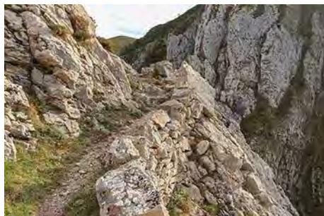
Entrando en la Foz de Arroxu

Atravesaremos la corta foz, de apenas 200 metros de recorrido, a bastante altura sobre el reguero que corre bajo nosotros, en un buen camino bien armado con muros de piedra. Un corto pero precioso paseo que al poco nos saca a terreno algo más abierto, en terrenos de brezo y escoba, y restos de cabañas. La senda sigue de forma clara rumbo Este, buscando los terrenos despejados de las brañas de altura, ya cerca del Camín Real.