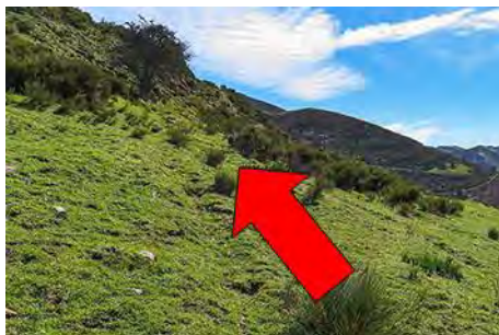
Continuando hacia arriba desde Ordiales

A esta braña la atraviesa el PR AS-12, la ruta de las Brañas de Sallencia. Nosotros ahora seguimos hacia arriba, en diagonal a la derecha, siguiendo un sendero de ganado que dobla la ladera. Aquí ya vemos, aún bien alta, Peña Negra. Una pista nos sale al paso, continuando por ella hasta llegar a otra braña, la de Cuérragu (una hora desde el pueblo) con muchas de sus cabanas en ruinas, pero una buena fuente donde reponer agua. Ya estamos más cerca de la peña, y ahora hacemos un giro a la izquierda para ir por otra senda, que arranca al Oeste, con Peña Michu al otro lado del valle. Entre la escoba y el pasto, remonta suavemente doblando al Norte. 10 minutos de tranquila marcha desde la braña nos depositan en el Camín Real de La Mesa, que seguiremos unos 10 minutos más