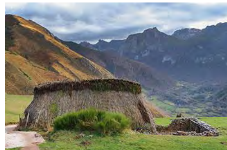
Las Morteras, cerca ya de Saliencia