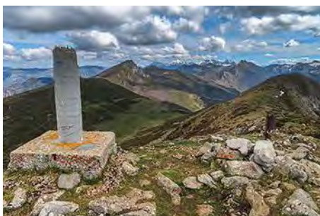
El vértice del Michu