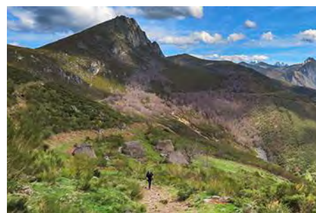
La Braña La Corra y Pena Negra ya por detrás

Podemos volver al Camín Real por la misma ruta de subida o seguir por la parte alta de la cresta, sin perder altura pero siempre por la vertiente somedana (trazas de senda y algún jito, pero aun así requiere algo de intuición) hasta un collado herboso. Una senda nos baja hacia la izquierda a la Braña La Corra (35 minutos). De esta braña al collado de Xugu la Bola, por el Camín, hay 5 minutos y un poco de desnivel que remontar.