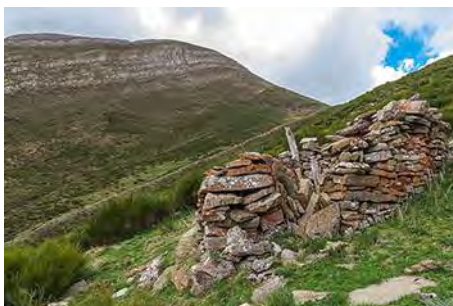
Los restos con el Michu encima

Descendemos al Xugu La Bola y de ahí lanzarnos hacia abajo por el valle, sin camino pero por terreno transitado (de momento) hasta topar un antiguo prado y restos de una cabana. Aquí vamos de frente para doblar la loma que nos separa del siguiente valle. Pasamos el filo y accedemos a un camino de ganado por el que seguimos el descenso hasta llegar a la siguiente braña bajo nosotros, la de Murias, (40 minutos desde la cima Sur).