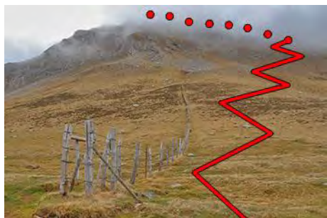
Bajada de Los Bigaros a la linde del puerto