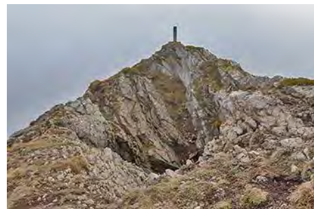
Vértice del Muñón

En 10 minutos más llegaremos a la siguiente cota, el techo de la sierra. Seguimos adelante, esquivando unos cortados, por la izquierda y siguiendo una característica franja rojiza, para perder unos metros y luego remontar al buzón cimero de Los Bigaros (2038 metros).