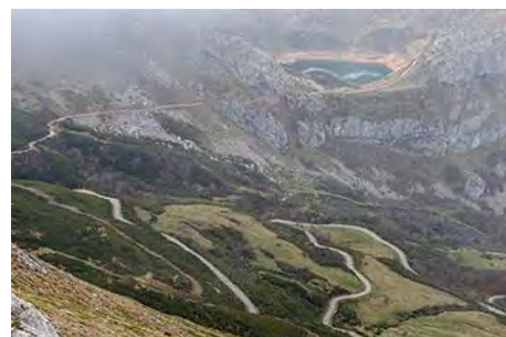
Abajo, la carretera al puerto y el Lago La Cueva