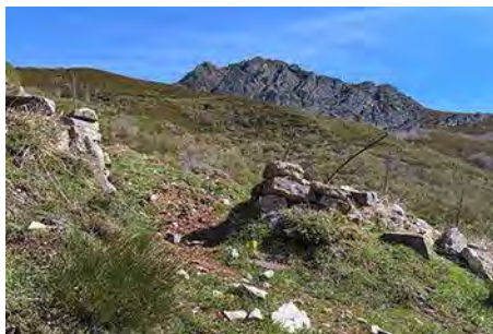
Aparece Peña Negra