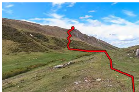
Xugu La Bola y ruta a la cima del Michu

En este punto ya tendremos vista de la cima de Pena Michu. Sólo tenemos que recorrer en diagonal rumbo Noroeste (senda) para acercarnos al vértice cimero (una hora desde la cima de Pena Negra). Si tenemos ganas, podemos acercarnos a la cota Sur, algo menos alta, para mirar al valle bajo nosotros y de paso hacernos una idea de la ruta que seguiremos para volver al pueblo.