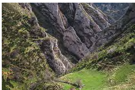
La Güérgola, vista desde arriba

En este lugar, impresionante bajo las peñas, encontraremos otra vez el PR AS-12 abajo a la derecha. En un rápido descenso, nos deja frente al último hito de la ruta, la espectacular Güérgola. Un corto desfiladero, con un camino empedrado (ojo no resbalar en mojado) y el reguero corriendo a su lado, ponen un digno colofón a la ruta y nos dejan en el pueblo en una media hora desde Murias.