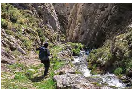
Parte alta de la foz