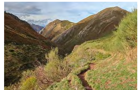
Una vez pasada la foz, mirando atrás

En hora y media desde el pueblo accedemos a las primeras cabañas de la Braña de La Mesa. Es aquí donde cambiamos el sentido de la marcha. Perdemos unos metros para cruzar la riega seca y tomamos un leve sendero que va en diagonal a la derecha, ascendiendo la despejada ladera. El terreno es de buen caminar, ya que a esta cota (por encima ya de 1600 metros) apenas tenemos maleza. No obstante, el sendero se ve claramente, y se une algo más arriba con otro más que viene desde la parte Este de la braña. En 20 minutos accedemos a un llano, con restos de murias. Giramos a la izquierda, rumbo sur, para llegar casi de sopetón al Chao (el lago).