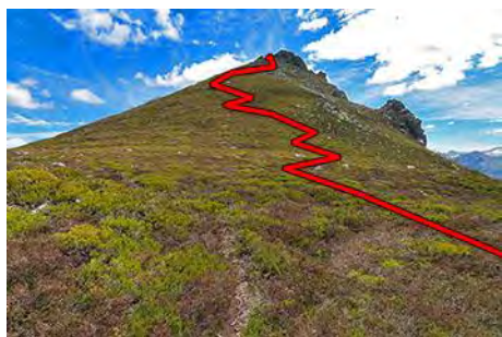
Camino a la cima, siguiendo los jitos

La senda remonta la ladera entre el brezo, primero hacia arriba y luego a la derecha, buscando la pirámide cimera, que superamos en un cansino trazado entre matorral hasta llegar justo bajo la cima (35 minutos desde la portilla). Subimos a la cima principal (buzón de cumbre). Unos metros más allá está la cima Este, de similar altura; para llegar a ella cresteamos usando con cuidado las manos en un par de tramos (llambrias lisas, cuidado no resbalar si están mojadas o con nieve).