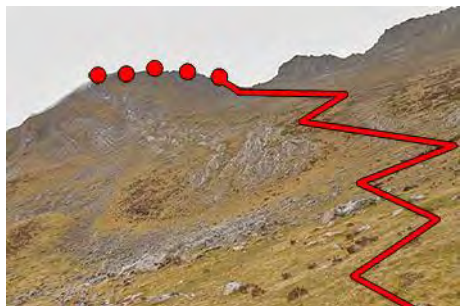
Rumbo a seguir para tomar la cresta y coronar

Llevamos dos horas de ruta y poco más nos queda. Dejando el lago a la derecha, seguimos camino ya viendo el filo de la cresta sobre nuestras cabezas. Tras dejar el lago, subimos en diagonal a un punto más bajo, por el que alcanzamos la cresta (Pasada del Muñón). Seguimos remontando rumbo Sureste para llegar al vértice cimeos del Muñón (2036 metros, dos horas y media en total).