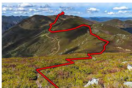
La siguiente parte de la ruta frente a nosotros

Podemos volver al Camín Real por la misma ruta de subida o seguir por la parte alta de la cresta, sin perder altura pero siempre por la vertiente somedana (trazas de senda y algún jito, pero aun así requiere algo de intuición) hasta un collado herboso. Una senda nos baja hacia la izquierda a la Braña La Corra (35 minutos). De esta braña al collado de Xugu la Bola, por el Camín, hay 5 minutos y un poco de desnivel que remontar.