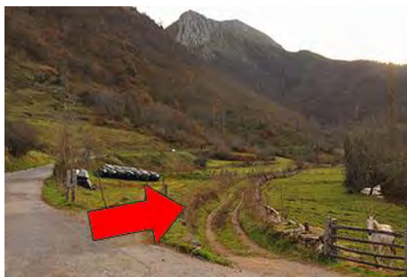
Arranque desde el pueblo junto a la carretera