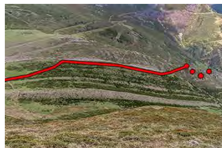
Mirando la bajada desde la cima Sur

Descendemos al Xugu La Bola y de ahí lanzarnos hacia abajo por el valle, sin camino pero por terreno transitado (de momento) hasta topar un antiguo prado y restos de una cabana. Aquí vamos de frente para doblar la loma que nos separa del siguiente valle. Pasamos el filo y accedemos a un camino de ganado por el que seguimos el descenso hasta llegar a la siguiente braña bajo nosotros, la de Murias, (40 minutos desde la cima Sur).