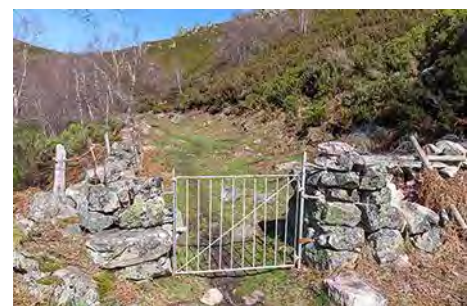
La portilla. Poco después, giramos a la derecha