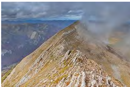
En la cresta. Vistas al Noroeste