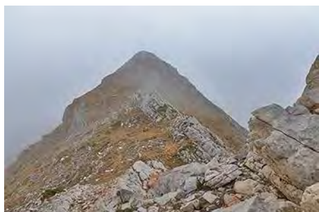
Cresteando hacia Los Bigaros

En 10 minutos más llegaremos a la siguiente cota, el techo de la sierra. Seguimos adelante, esquivando unos cortados, por la izquierda y siguiendo una característica franja rojiza, para perder unos metros y luego remontar al buzón cimero de Los Bigaros (2038 metros).