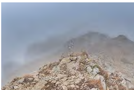
En Los Bigaros: hoy no va a ser día de vistas