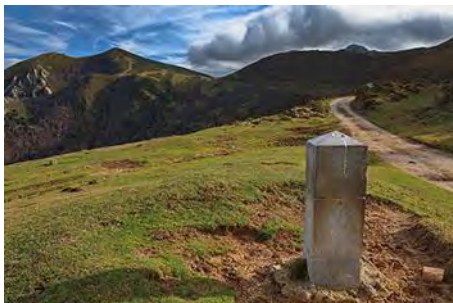
Mirando hacia atrás en La Madalena

Seguendo el GR, que se convierte en pista, cruzamos el Colláu El Muro para pasar a la vertiente tevergana. La pista va un rato casi en llano hasta el siguiente collado, La Madalena (1 hora desde La Mesa). Éste es un cruce de caminos y nosotros tiramos a la izquierda (Oeste), una empinada pista que nos baja casi directamente al aparcamiento de Saliencia en unos 45-50 minutos, pasando mientras por los teitos de la Braña Las Morteras de Saliencia.