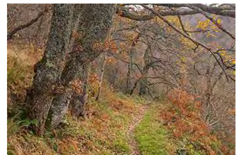
Un rato de entretenida subida entre bosque

Atravesaremos la corta foz, de apenas 200 metros de recorrido, a bastante altura sobre el reguero que corre bajo nosotros, en un buen camino bien armado con muros de piedra. Un corto pero precioso paseo que al poco nos saca a terreno algo más abierto, en terrenos de brezo y escoba, y restos de cabañas. La senda sigue de forma clara rumbo Este, buscando los terrenos despejados de las brañas de altura, ya cerca del Camín Real.