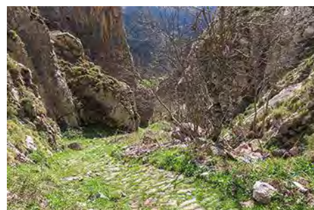
Parte baja, un poco antes del pueblo