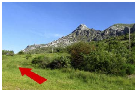
Empezamos en la collada al Oeste

Desde la misma collada y su amplio aparcadero, tomamos una pista que en sus primeros metros va en dirección Oeste, la contraria a la que queremos ir. Al poco, va doblando a la buena dirección Este y pasa un cierre, tras lo cual llanea y pasa debajo de un sector de escalada deportiva hasta desembocar media hora después en una pequeña foz (Foz del Arroyo Cepos) a cuyo pie se encuentran las antiguas minas de La Profunda. Remontamos esta corta foz, asomándonos a las antiguas galerías, y seguimos por la ladera herbosa en fuerte ascenso. No hay camino marcado pero es de fácil orientación, limitándonos a subir la pindia ladera, casi de frente, hasta desembocar en la cresta cimera en otra media hora desde el fin de la pista.