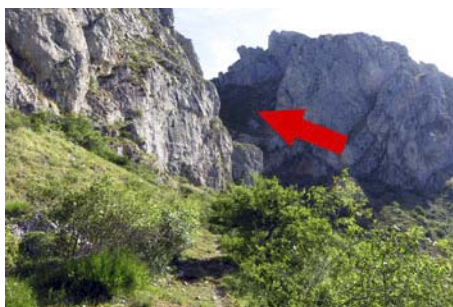
Foz del Arroyo Cepos, ahora hacia arriba