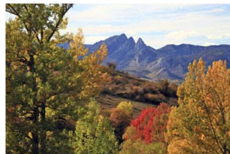
Las Tres Marías asomando al Oeste