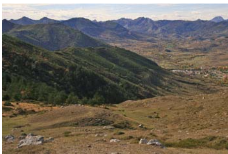
Bajando de vuelta al valle por pista