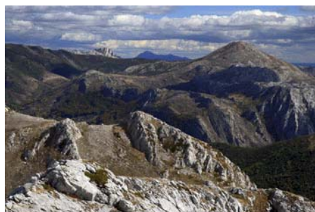
El Correcillas destaca al Este

Desde la cima del Machacao, podemos optar por descender ya o seguir al vecino pico del Machamedio, algo más bajo pero con vértice geodésico. Está a escasos 20 minutos desde la cima, y tenemos dos formas de llegar. La primera consiste en seguir la cresta dirección Este, con algún tramo algo más escabroso donde tendremos que destrepar usando las manos, y posteriormente seguir por la loma hasta la cima. La otra es perder algo de altura por la cara Sur, encima del collado de Gete, para torcer luego al Este y pasar por debajo de la cresta y sus pasos más escabrosos y posteriormente seguir hasta la cima del Machamedio, a 1951 metros (hay algunos jitos).