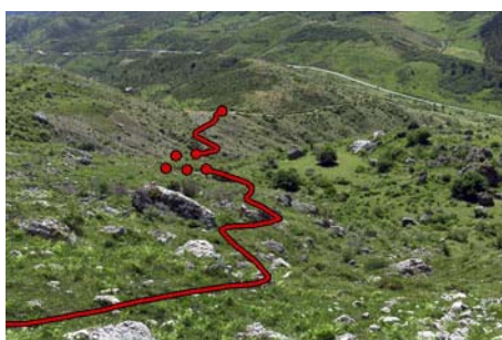
A través de Florespigos hacia la pista