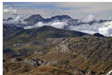
Las Ubiñas al Noroeste

Desde la cima del Machacao, podemos optar por descender ya o seguir al vecino pico del Machamedio, algo más bajo pero con vértice geodésico. Está a escasos 20 minutos desde la cima, y tenemos dos formas de llegar. La primera consiste en seguir la cresta dirección Este, con algún tramo algo más escabroso donde tendremos que destrepar usando las manos, y posteriormente seguir por la loma hasta la cima. La otra es perder algo de altura por la cara Sur, encima del collado de Gete, para torcer luego al Este y pasar por debajo de la cresta y sus pasos más escabrosos y posteriormente seguir hasta la cima del Machamedio, a 1951 metros (hay algunos jitos).