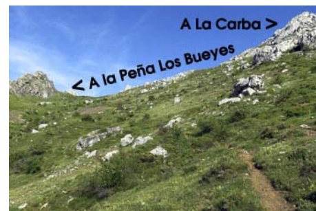
Remontando a la loma cimera

Aquí podemos ir ya a la cima, pero nosotros nos desviamos un poco a la derecha para coronar la cota secundaria de La Carba, una pequeña aguja de 1763 metros. Para esquivar su parte más agreste, la bordeamos por el lado Este en una corta pero cuidadosa trepada. Ahora ya podemos seguir a la Peña Los Bueyes, para lo cual nos limitamos a ascender la tumbada arista que nos lleva a las proximidades de la cima. En la parte superior podremos ver antiguas trincheras de la Guerra Civil. Seguimos un rato y posteriormente esquivamos unos escarpes previos pasando por la vertiente Norte y trepamos una corta canal para acceder por esta cara a la cruz cimera (1943 metros, unos 40 minutos de recorrido desde La Carba y menos de dos horas en total desde la Collada Cármenes).