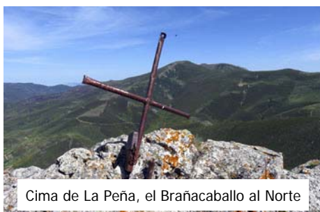
Cima de La Peña, el Brañacaballo al Norte

Para bajar, en lugar de deshacer el camino de subida, lo haremos por una sencilla pero agreste variante que nos permite hacer un circuito. Retrocedemos los primeros metros destreando la canal cimera y volviendo atrás hasta dar vista a la cara Sur. Con la ladera pedregosa bajo nosotros, hacemos un corto pero directo descenso a la vallina que tenemos debajo, y de ahí torcemos a la izquierda para bajar a la primera horcada que encontramos. Descendemos por una pindia canal, cerca del fondo donde a tramos aflora sendero de ganado, hasta salir al paraje llamado las Llamas de Florespigos. Hay varias trazas de sendero que van desde un escondido abrevadero que casi no se ve hasta la pista. Por donde mejor veamos y menos nos pinchemos bajamos a izquierda para confluir con la pista de subida, cerca del cierre que pasamos a primera hora, y de ahí de vuelta a la Collada Cármenes. Todo este descenso lo podemos hacer en poco más de una hora.