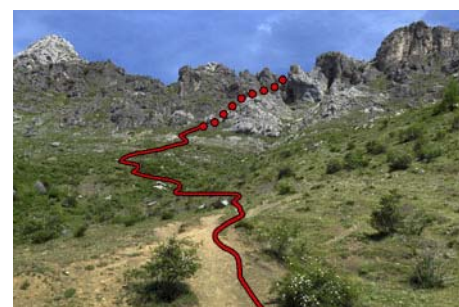
Desde la pista, vista de la bajada

Disfrutad de las prestosas subidas, los grandes paisajes y los acogedores pueblos del Valle de La Tercia. Suerte y un saludo del Maquis.