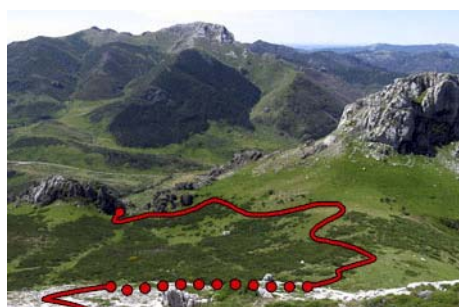
Ruta para encaramarnos a la pequeña Carba

Para bajar, en lugar de deshacer el camino de subida, lo haremos por una sencilla pero agreste variante que nos permite hacer un circuito. Retrocedemos los primeros metros destreando la canal cimera y volviendo atrás hasta dar vista a la cara Sur. Con la ladera pedregosa bajo nosotros, hacemos un corto pero directo descenso a la vallina que tenemos debajo, y de ahí torcemos a la izquierda para bajar a la primera horcada que encontramos. Descendemos por una pindia canal, cerca del fondo donde a tramos aflora sendero de ganado, hasta salir al paraje llamado las Llamas de Florespigos. Hay varias trazas de sendero que van desde un escondido abrevadero que casi no se ve hasta la pista. Por donde mejor veamos y menos nos pinchemos bajamos a izquierda para confluir con la pista de subida, cerca del cierre que pasamos a primera hora, y de ahí de vuelta a la Collada Cármenes. Todo este descenso lo podemos hacer en poco más de una hora.