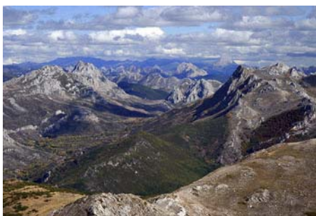
Valle de Valverdín, también hacia el Este