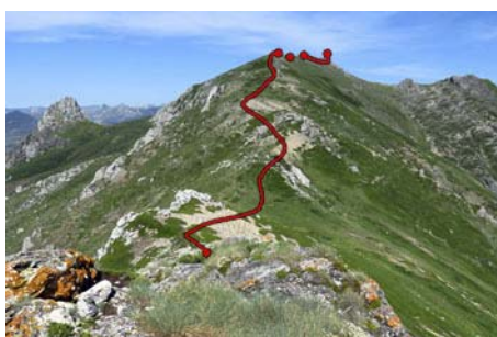
Desde La carba, ruta a la Peña Los Bueyes