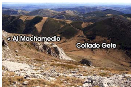
La ladera que baja al Collado Gete

Lleguemos o no al Machamedio, nosotros bajaremos hacia el vecino y bien visible Collado de Gete al Sur siguiendo una tumbada canal que se desliza entre las paredes rocosas, y posteriormente bajando ya por ladera herbosa al collado, en poco más de media hora desde la cima. En el collado tomamos una pista que baja al Oeste y nos deposita en el fondo del valle, encontrándonos con el cruce de subida y finalmente de vuelta al pueblo de Fontún en una hora de pausado descenso, terminando así un bonito circuito montaño.