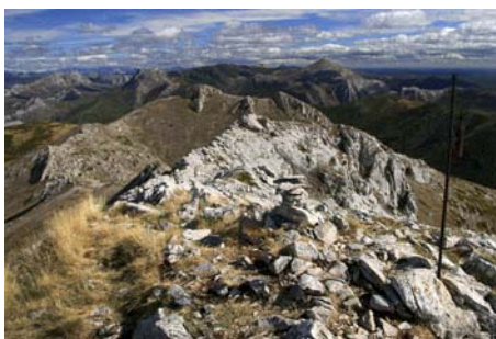
Buzón cimero, vistas al Este