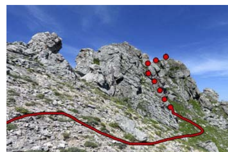
Acceso a cumbre por la cara Norte del pico