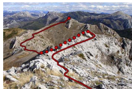
Cresta al Machamedio, con pasos de trepada

Lleguemos o no al Machamedio, nosotros bajaremos hacia el vecino y bien visible Collado de Gete al Sur siguiendo una tumbada canal que se desliza entre las paredes rocosas, y posteriormente bajando ya por ladera herbosa al collado, en poco más de media hora desde la cima. En el collado tomamos una pista que baja al Oeste y nos deposita en el fondo del valle, encontrándonos con el cruce de subida y finalmente de vuelta al pueblo de Fontún en una hora de pausado descenso, terminando así un bonito circuito montaño.