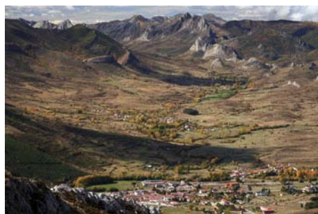
El valle de la Tercia que se escapa al Oeste