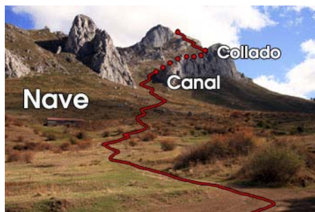
Vista de la subida desde el desvío a la nave