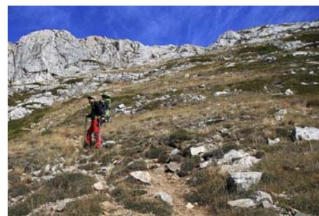
Ladera final de acceso a la cumbre