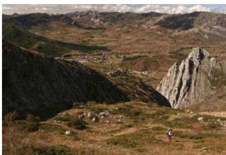
Subiendo la canal, ya casi en el collado