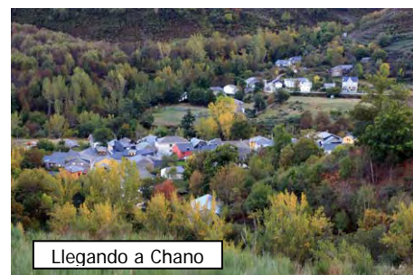
Llegando a Chano

Aquí damos por terminada una sencilla pero agradecida ruta de montaña por la parte norte de los olvidados Ancares, que bien merecen dedicarles un fin de semana largo o unas cortas vacaciones. Sólo recordaros que llevéis agua bastante, que os cuidéis del fuerte sol si vais en verano y paciencia con el arbusto y el matorral que amenaza con sepultar la parte occidental de la Cordillera Cantábrica. Un saludo.