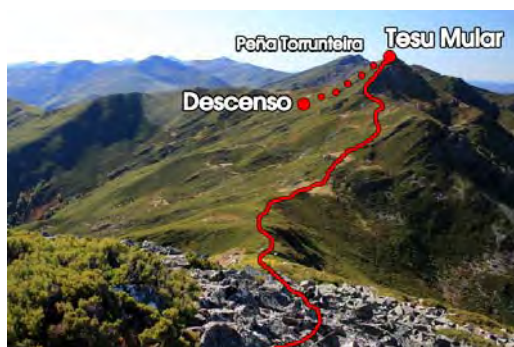
Desde la Moredina al Tesu Mular

De La Moredina al Tesu Mular, vemos el recorrido a seguir. Es todo rumbo Oeste, siguiendo la divisoria regional, primero hacia abajo y luego en subida hasta llegar al vértice geodésico del Tesu Mular (1883 metros, una hora de marcha)