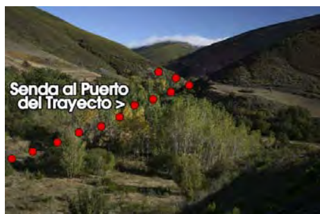
Vista del arranque desde el albergue