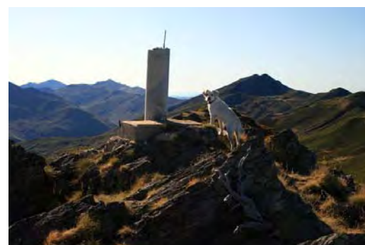
Vértice geodésico del Tesu Mular

Aún podríamos acercarnos hasta la vecina Peña Torruenteira más al Oeste y techo del concejo de Ibias, pero nos alargaría la actividad un par de horas más.