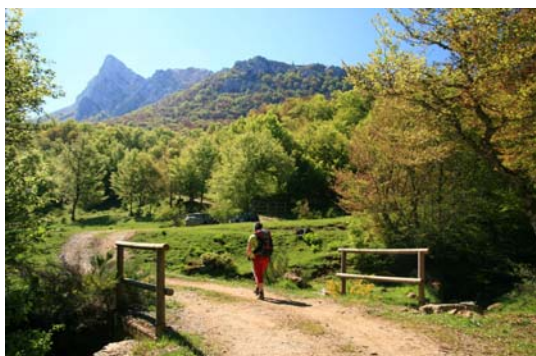
Primer cruce: Comienza de verdad el ascenso