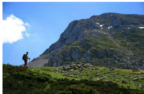
Comenzamos a bajar desde el collado Burín...