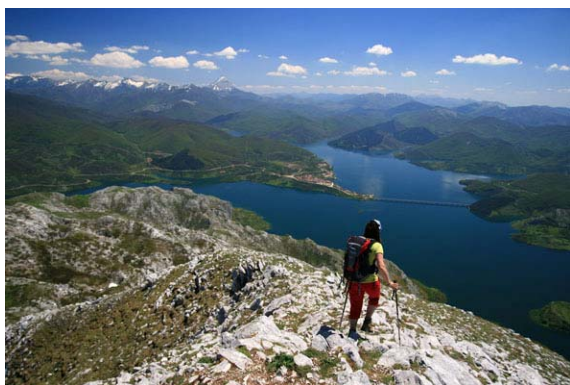
Iniciamos el descenso con el Espigüete vigilando...

Si nos decidimos por la opción aventurera (ojo con la experiencia o las condiciones) saldremos rumbo Este, directos hacia Riaño. Antes que la cresta se termine, viramos hacia el Sur a buscar una canal poco marcada, donde nos tocará hacer algunos destrepes entretenidos (II-) La canal no está jitada, y tiene abundante piedra suelta. La mayor exposición se encuentra en los primeros metros, perdiendo inclinación progresivamente. Sigue íntegramente por encima de un resalte rocoso, perdiendo incluso altura con respecto a la collada Burín (la veremos a nuestra izquierda) Seguimos descendiendo hasta dar con un punto débil del resalte, donde podemos descender y seguir, ahora en leve subida, hasta la collada Burín, al Este del pico.