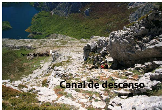
En el punto más delicado del descenso...