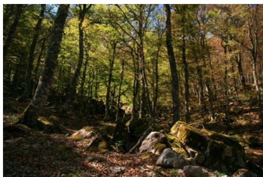
Por el bosque, vamos ganando altura...