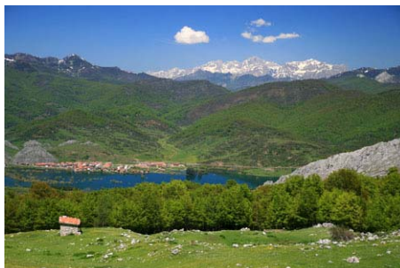
La cabaña; al fondo, Burón y el pantano...