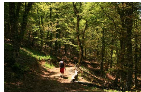
Bajando por pista entre el bosque...

En resumen, una bonita ruta de montaña, recomendada en primavera con los colores leoneses bien vivos, con tiempo estable, para poder disfrutar del paisaje. Además, la montaña de Riaño bien merece dedicarle un fin de semana largo, o unas pequeñas vacaciones para conocerla bien. Disfrutad, pues, este bello paraje con calma y tranquilidad.