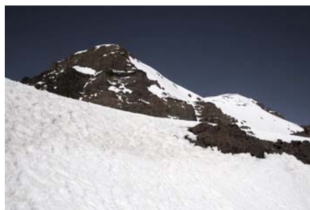
El Afella al Norte, visto desde el collado final