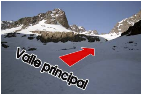
Punto de desvío hacia el Akioud