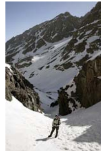
Salida de la garganta