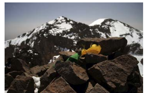
Ras y Timesguida desde la cima del Akioud N.

El Akioud se compone de tres cimas, y hay además itinerarios de mayor dificultad para enlazar las cumbres o acceder a la principal. Para ello, lo más recomendable es consultar la guía propuesta al inicio de la página, con variada y completa información. Nosotros, en esta ocasión, nos conformaremos con visitar la cima Norte. Para bajar, lo haremos por el mismo camino de subida, teniendo cuidado en las rampas más altas, que no permiten descuidos.