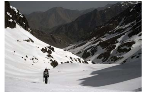
Remontando el valle del Amharas n'Iglioua ...

Pese a la evidente collada a la derecha, y la amplia canal de su izquierda, el acceso a cumbre se hace a través de una pequeña horcada, no muy evidente, justo a la derecha de la cima. Llegar ahí nos hace remontar pendientes cada vez más pronunciadas, hasta rondar los 35 grados en su parte superior. De aquí, accedemos a las rampas finales por la otra vertiente (requieren atención, 30-35°) que nos dejan en la cima, a 4030 metros.