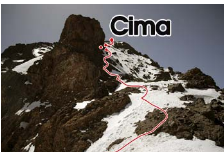
Últimas rampas de acceso a cima, con cuidado