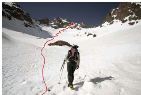
Itinerario de acceso a las últimas rampas