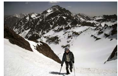
El Toubkal, siempre vigilante durante la subida