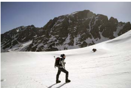
Al fondo, el Ikhibi Sur y el Tête d'Ouanoums

Pese a la evidente collada a la derecha, y la amplia canal de su izquierda, el acceso a cumbre se hace a través de una pequeña horcada, no muy evidente, justo a la derecha de la cima. Llegar ahí nos hace remontar pendientes cada vez más pronunciadas, hasta rondar los 35 grados en su parte superior. De aquí, accedemos a las rampas finales por la otra vertiente (requieren atención, 30-35°) que nos dejan en la cima, a 4030 metros.