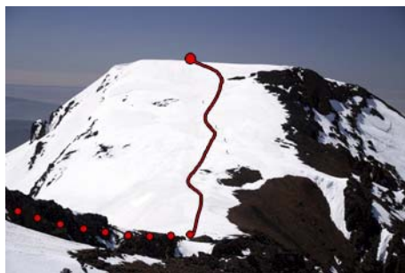
Ahora, al Timesguida en media hora...