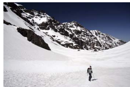
Por el valle, de vuelta al refugio en una hora.

Es momento de reponer fuerzas, y prepararnos para la próxima ascensión. Disfrutad de la ruta de hoy con el debido cuidado, y como siempre, vigilad el agua y protegeos del sol marroquí. Suerte y un saludo del Maquis.