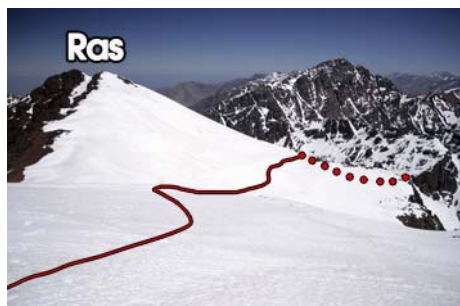
Hora de volver a casa...

Llevamos unas tres horas y media, ahora es el momento de volver al refugio. Para ello, cogeremos la ruta Normal hasta el Tizi n'Ouagane. Pasamos al Sur del Ras, buscando la arista Este que nos bajará hasta el collado. Con algún tramo pendiente en el que tener cuidado, nos deja en unos 30 minutos sobre el collado. De ahí, en una hora, bajamos al refugio. En total, entre 5 y seis horas de paseo por las alturas del Atlas.