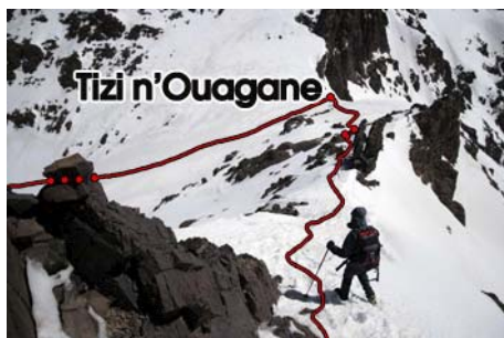
Descenso a n'Ouagane con cuidado...