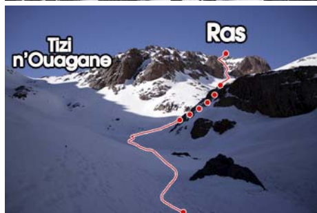
Camino a la cima, torcemos a la derecha

La salida se hace desde los refugios hacia el Sur. Seguimos el valle en progresivo ascenso. El valle va a morir al collado de Tizi n'Ouagane, por el que saldremos a la vuelta. Nosotros no llegaremos tan allá, cuando estemos bajo las laderas del ras, hemos de fijarnos en el valle que se abre a nuestra derecha. Allá arriba, veremos el corredor que será nuestra vía de ascenso. Subimos por la derecha para encara así el pie de vía (hora y media de camino desde el refugio)