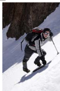
En el corredor...