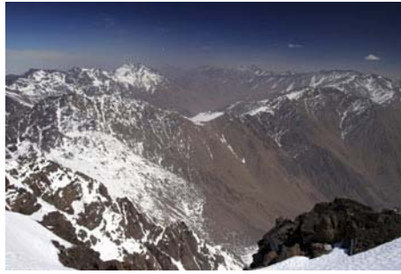
Vistas hacia el Este: Montaña y desierto...