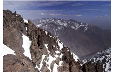
La cima del Imouzzzer (4010 metros)