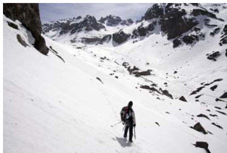
Asoman por fin los refugios