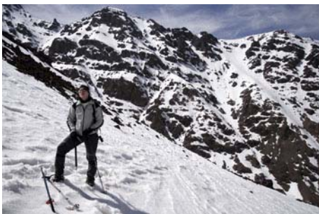
En la parte baja, el Biuguinnoussene y Tadat