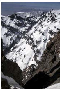
Cortados hacia el Sur...