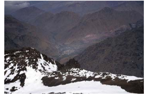
Imlil allá abajo...

Es hora de comenzar el descenso, pasando por la última cima del día. Toca descender la arista Noreste del Toubkal, fácil pero de fuerte inclinación (unos 30-35 grados), hasta el collado Norte (unos 30 minutos y 200 metros de descenso). A su derecha, casi sin desnivel, está el Imouzzzer. Su cima consiste en bajar y subir un par de brechas, hasta llegar a la poco perceptible cima (se pasa bien por el lado Oeste, suele haber jitos). Si no hay nieve, nos esperan pasos variados de II y II+. Con hielo, pueden llegar a ser bastante peligrosos. En diez minutos desde el collado llegamos a cima.