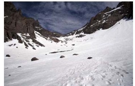
Ahora, el Ikhibi Norte, vista desde abajo...