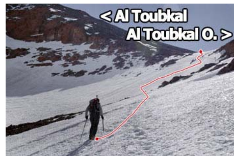
Llegando al final del valle y el Tizi n'Toubkal

Una hora más es lo que nos llevará llegar al collado donde muere el Ikhibi Sur. Es el Tizi n'Toubkal, en plena cresta cimera a unos 3900 metros.