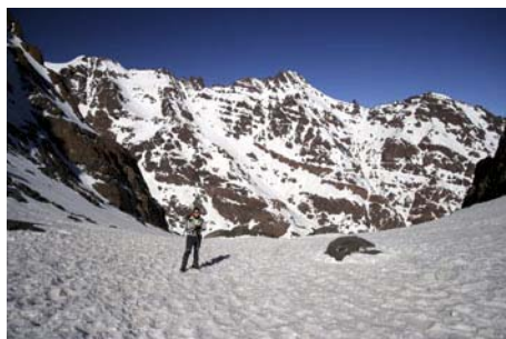
En el Ikhibi Sur, gozando de las vistas...