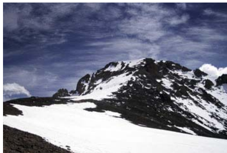
Nos despedimos del Toubkal...