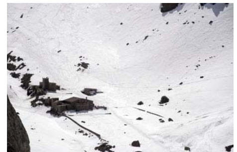
Ya nos queda menos, ahora a descansar...

En resumen, una buena travesía para recorrer la cima principal y techo del Alto Atlas. Una actividad recomendable para finales del invierno, con buena nieve ya asentada, y evitar las pesadas pedreras que forman esta cordillera cuando la nieve se retira. Sin grandes dificultades técnicas, sólo requiere habituación a la montaña y buen manejo del aparatage invernal. Llegar agua bastante (evitar beber de los arroyos), protegeos del sol y resguardaos del viento que en ocasiones ruge en las cimas (a veces incluso llega a impedir cualquier tipo de actividad)