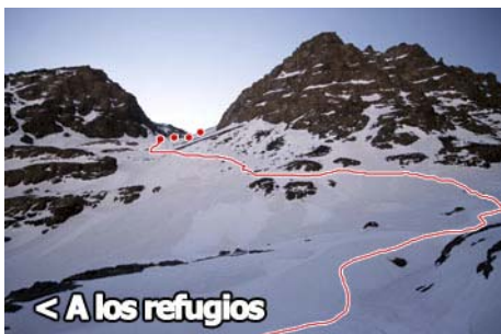
Salida y primeras rampas...

Al poco, doblamos al Este para remontar una empinada ladera con una cuidadosa travesía ascendente a la izquierda, y embocamos así el Ikhibi Sur. Nos esperan dos horas de ascenso entretenido, con las cimas sobre nuestras cabezas y, a nuestra espalda, el sector del Biquinoussene y Tadat.