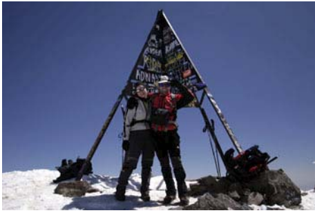
El trípode cimero del Toubkal...