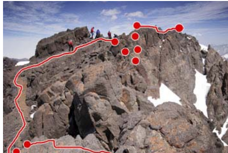
Recorrido hasta la última cima (pasos de II+)