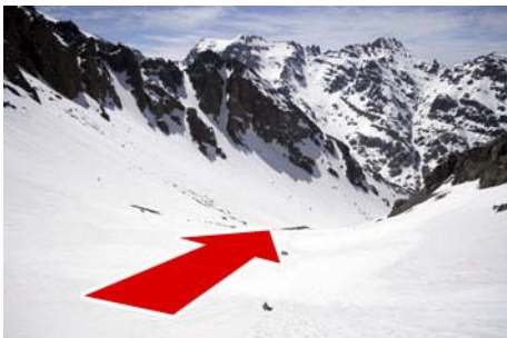
El Ikhibi Norte desde arriba...