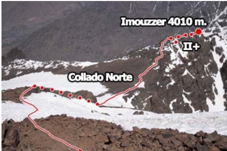
Descenso al Collado Norte y al Imouzzzer

Es hora de comenzar el descenso, pasando por la última cima del día. Toca descender la arista Noreste del Toubkal, fácil pero de fuerte inclinación (unos 30-35 grados), hasta el collado Norte (unos 30 minutos y 200 metros de descenso). A su derecha, casi sin desnivel, está el Imouzzzer. Su cima consiste en bajar y subir un par de brechas, hasta llegar a la poco perceptible cima (se pasa bien por el lado Oeste, suele haber jitos). Si no hay nieve, nos esperan pasos variados de II y II+. Con hielo, pueden llegar a ser bastante peligrosos. En diez minutos desde el collado llegamos a cima.