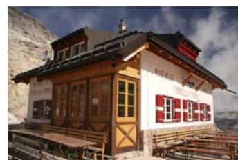
Refugio del Passo Pordoi

En la Forcella y refugio de Pordoi, a 2830 metros, vemos el recorrido hasta la cima. Nos llevará cerca de una hora más, para ello tomamos el buen camino rumbo este y, en el collado de la imagen, remontamos la loma Sur hasta la cima y el refugio. El camino está jitado, y en los tramos más empinados equipado con cable, aunque sin nieve no se hace necesario su uso.