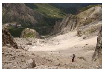
Remontando la canal, casi arriba