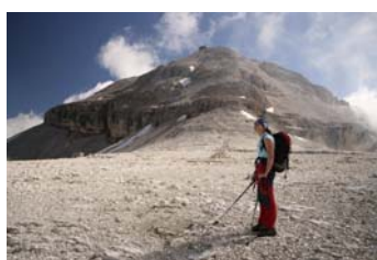
Bajo la loma cimera...