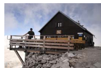
Refugio cimero, a 3152 metros...

Para volver, toca deshacer el camino de subida, mucho más rápido ya que buena parte del mismo se hace en fuerte descenso.