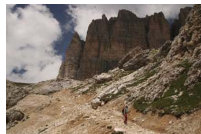
Vuelta a Pordoi, parte baja de la canal

Ésta es una hermosa y sencilla ruta, ideal para hacer madrugando y estar de vuelta a media mañana, o para relajar después de haber hecho ascensiones de mayor entidad. Claro está, en verano, ya que con nieve el paseo puede cambiar bastante.