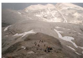
Vistas hacia abajo llegando a cima.