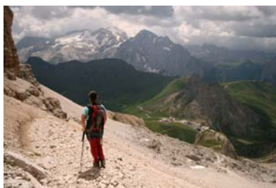
Bajando, al fondo La Marmolada