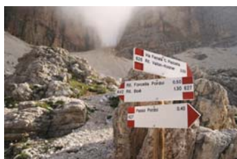
Cruce a medio camino