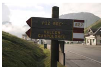
Salida por el sendero 627