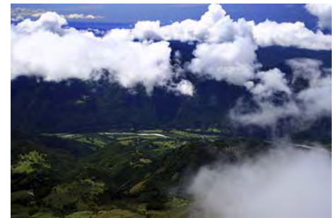
Valle del río Soča 2000 metros por debajo

Para bajar, lo haremos rumbo Sur, por la directa de esta vertiente. Bajamos hasta el refugio de Gomiskovo Zavetisce en pocos minutos. De aquí, una senda baja directamente hasta un collado herboso, sobre las cabañas de Planina Zaslav. Para esquivar unos cortados, quiebra a la izquierda y vuelve hacia las cabañas. Luego, va cortando la pista de descenso hasta desembocar en el aparcamiento. Bajando con cuidado pero a buen ritmo, en menos de dos horas ya estaremos en el aparcamiento.