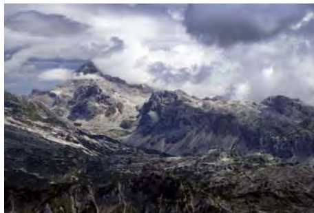
El Triglav, más de cerca