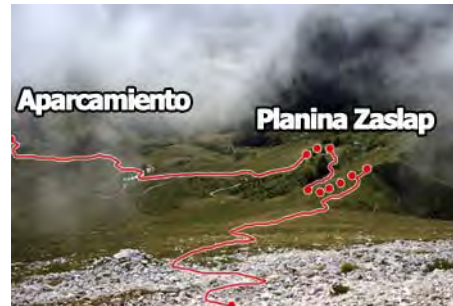
La bajada, no tiene mayor misterio...