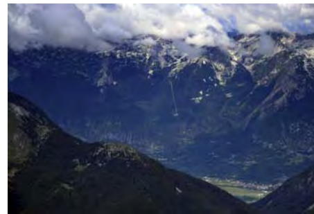
Visoki Kanin y Bovec, al Noroeste