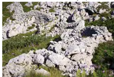
Aparecen las primeras trincheras...