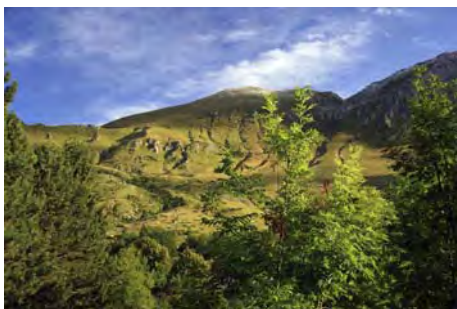
Desde el aparcamiento: Cara Sur del Krn