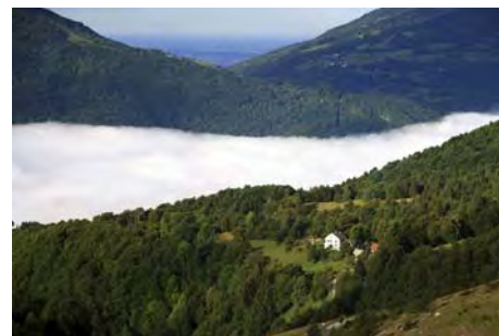
Ganando altura sobre el fondo del valle

La pista termina y tenemos que fijarnos en una estrecha collada sobre nuestras cabezas, a la que hemos de subir. Este tramo no tiene señalización, así que hemos de buscar trazas de ganado y antiguas sendas que nos remontan en varias revueltas hasta un cruce, donde encontramos otra vez la señalización. Ya estamos bajo el collado, y rápidamente lo ganaremos. Desembocamos en un pequeño jou, donde la ahora bien marcada senda tuerce a la izquierda para ganar otra collada. Aparece aquí las líneas de trincheras, de momento modestas ya que son de la segunda línea defensiva.