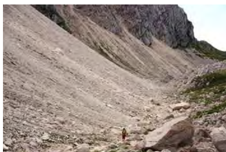
¿Andamos por la Vueltona o por Eslovenia?