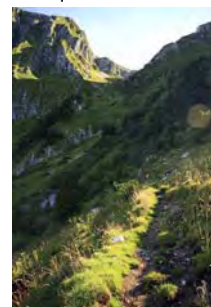
Hacia la collada...