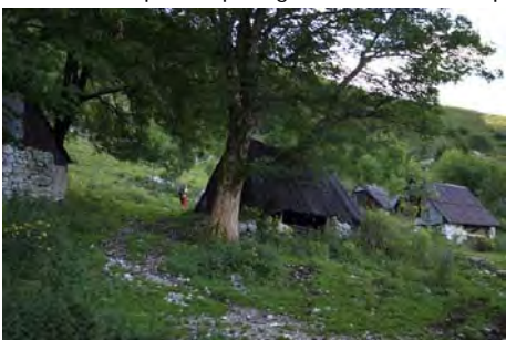
Planina Leskojca, ahora hacia arriba...

La pista termina y tenemos que fijarnos en una estrecha collada sobre nuestras cabezas, a la que hemos de subir. Este tramo no tiene señalización, así que hemos de buscar trazas de ganado y antiguas sendas que nos remontan en varias revueltas hasta un cruce, donde encontramos otra vez la señalización. Ya estamos bajo el collado, y rápidamente lo ganaremos. Desembocamos en un pequeño jou, donde la ahora bien marcada senda tuerce a la izquierda para ganar otra collada. Aparece aquí las líneas de trincheras, de momento modestas ya que son de la segunda línea defensiva.