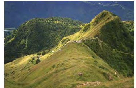
Por encima de Planina Zaslav

En la foto inferior, en Planina Zaslav; se ve el aparcamiento abajo a la izquierda, sobre el valle.