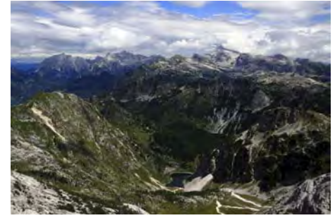
Sector del Triglav y lago de Krnsko abajo