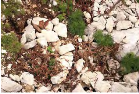
Alambradas por doquier, parece un sembrado...

Estamos en un cruce señalizado, y seguimos rumbo oeste por los altos. Aún nos quedan unos 45 minutos más hasta llegar al Krn, y desfilamos literalmente por los restos de un campo de batalla. La senda va por la cresta, para descender en un camino tallado (escalones) a un último collado.