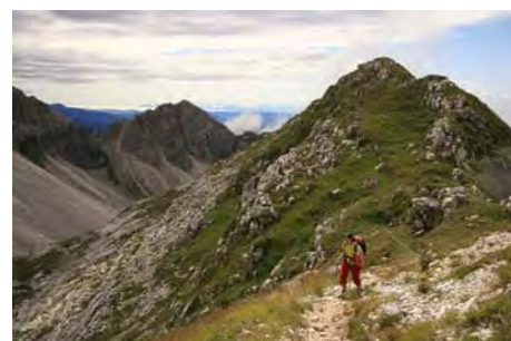
Saliendo a la línea de crestas.