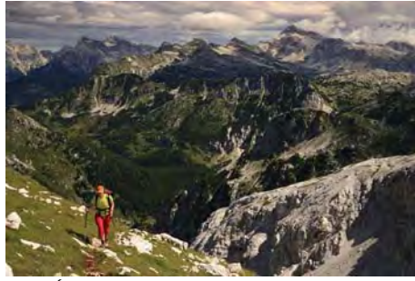
Última subida, con el Triglav vigilante