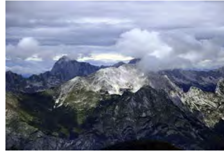
Sector del Mangart y Jalovec