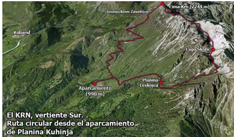
El KRN, vertiente Sur. Ruta circular desde el aparcamiento de Planina Kuhinja

Desde el pueblo de Kobarid (el Caporetto italiano) tomamos la carretera a Tolmin; antes de llegar, cogemos un desvío a la izquierda (dirección Kamno) que va subiendo por aldeas y caseríos hasta terminar en un aparcamiento (Planina Kuhinja) a casi mil metros de altura. Nada más salir, un desvío señalado marca el camino al refugio homónimo. Nosotros vamos por la derecha, una pista que va en descenso hacia el este, bajo las laderas de la montaña, para desembocar en la majada de Planina Leskojca tras 40 minutos de paseo.