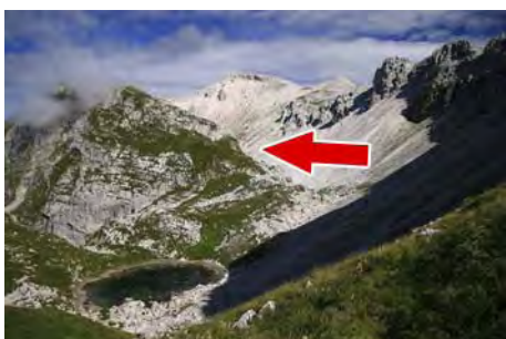
Lago Škofic y senda a seguir