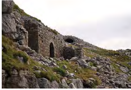
Restos de los barracones cimeros.