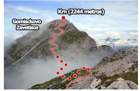
Últimos repechos de subida al Krn