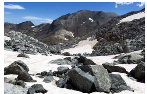
Bajando por neveros, el Cambieil al fondo

En la morrena enlazamos con el camino de subida. Sólo nos queda ya un largo descenso, que en unas 2-3 horas nos deja desde las nieves hasta el mismo aparcamiento. Llevar agua bastante, ojo con el sol y mucho cuidado con esta ruta de alta montaña, que pese a no ser difícil nos exigirá soltura, experiencia y sólidos conocimientos técnicos montañeros.