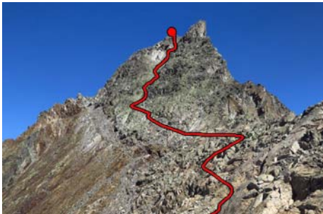
El recorrido a seguir después del Badet

Aquí podríamos dejar incluso las mochilas. Los jitos ahora nos acercan a la pared Sur del Long, a media altura, para buscar una canal que nos lleva finalmente a la cima con una fácil trepada. En total, desde el Badet habremos invertido una hora más para coronarla, y entre cuatro a cinco horas de tiempo total desde abajo. Es hora de volver a la horcada a preparar el rápel al glaciar de Pays Baché. La primera tirada, la más vertical, se hace desde la misma horcada. Nosotros dejamos un cordino laceando un bloque, que puede que os toque reponer. Rapelamos unos 25 metros y buscamos a la derecha, en una pequeña terraza, otro rápel montado con clavos (30 metros) que nos deja ya cerca del glaciar. Bajaremos por él cómodamente, debido a su escasa inclinación, hasta volver a la morrena.