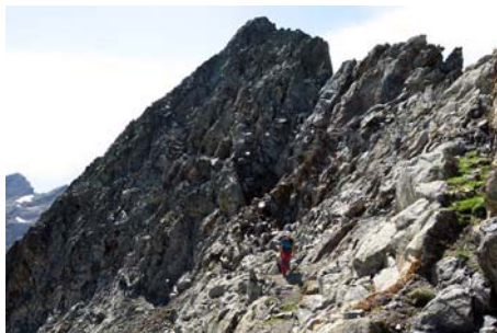
Primer tramo de la travesía entre las cimas