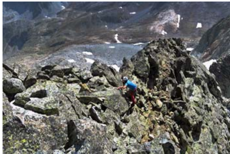
Llegando a la cresta cimera tras subir la canal