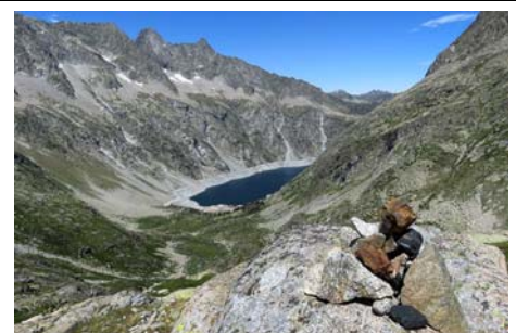
El Cap de Long abajo, aún nos queda un paseo