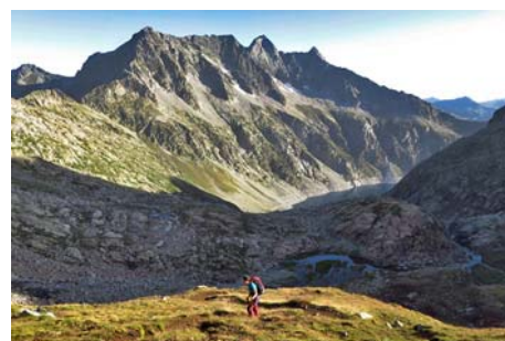
Dejando abajo la laguna

La senda va perdiendo entidad, aunque está generosamente jitada. Llegamos tras dos horas desde el aparcamiento a la antigua morrena glaciaria. A nuestra izquierda, el imponente Campbiell. A la derecha, los no menos impresionantes y perfectamente alineados picos de Maou, Badet y Long. Por ahí va nuestra ruta, que empezamos remontando la ladera hacia la cresta entre los dos primeros picos.