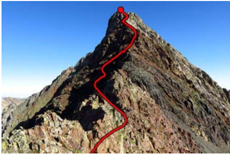
La Arista Este del Badet, parte final de la ruta