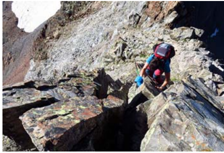
Cortas trepadas en el ascenso al Badet