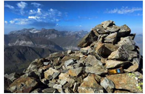
Cima del Badet, con el Perdido lejano al Sur

Es momento de continuar, ya que tenemos por delante el tramo más delicado de la ruta. Vamos hacia el Oeste, perdiendo altura por debajo de la cresta. Seguimos los jitos que nos llevan por el mejor terreno. El descenso nos depara algunos pasos de II+ con mucho cuidado donde poner las manos, colgando sobre los hielos. Este tramo agreste nos deja en una canal de piedra suelta, bajo la Aguja de Badet, que remontamos. Flanqueamos por la otra vertiente la Aguja y salimos a terreno abierto, con varias brechas que bajan al glaciar. Hemos de fijarnos porque una de ellas es la nuestra, y salvo que alguien haya dejado material en el rápel no se distingue bien.