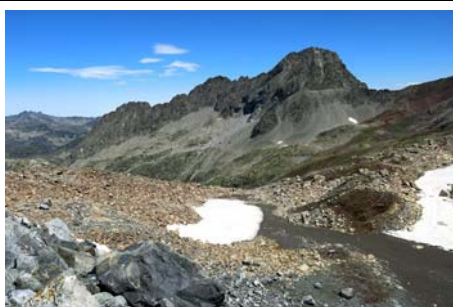
La antigua morrena con el Estaragne al Norte