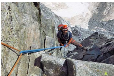
Empezando el primer rápel, el más vertical