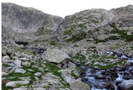
Remontando por el barranco la primera hora