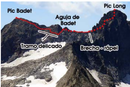
El recorrido a seguir después del Badet

Es momento de continuar, ya que tenemos por delante el tramo más delicado de la ruta. Vamos hacia el Oeste, perdiendo altura por debajo de la cresta. Seguimos los jitos que nos llevan por el mejor terreno. El descenso nos depara algunos pasos de II+ con mucho cuidado donde poner las manos, colgando sobre los hielos. Este tramo agreste nos deja en una canal de piedra suelta, bajo la Aguja de Badet, que remontamos. Flanqueamos por la otra vertiente la Aguja y salimos a terreno abierto, con varias brechas que bajan al glaciar. Hemos de fijarnos porque una de ellas es la nuestra, y salvo que alguien haya dejado material en el rápel no se distingue bien.