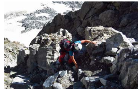
Remontando la canal bajo la Aguja de Badet

Aquí podríamos dejar incluso las mochilas. Los jitos ahora nos acercan a la pared Sur del Long, a media altura, para buscar una canal que nos lleva finalmente a la cima con una fácil trepada. En total, desde el Badet habremos invertido una hora más para coronarla, y entre cuatro a cinco horas de tiempo total desde abajo. Es hora de volver a la horcada a preparar el rápel al glaciar de Pays Baché. La primera tirada, la más vertical, se hace desde la misma horcada. Nosotros dejamos un cordino laceando un bloque, que puede que os toque reponer. Rapelamos unos 25 metros y buscamos a la derecha, en una pequeña terraza, otro rápel montado con clavos (30 metros) que nos deja ya cerca del glaciar. Bajaremos por él cómodamente, debido a su escasa inclinación, hasta volver a la morrena.