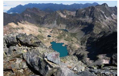
En el Pic Long, vistas al Norte y al Lac Tourrat