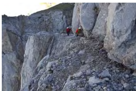
Remontando la vira diagonal a la Primera Torre, justo antes del paso de II grado

Los primeros metros no tienen dificultad, pero la chimenea se estrecha y nos obliga a internarnos para pasar por dentro de un bloque empotrado, haciendo oposición (más espectacular que difícil, IV-). Nos subimos al bloque, y más arriba encaramos una placa por su derecha, con cuidado (unos diez metros, IV grado) Más arriba, torcemos a la izquierda para encontrar una reunión rapelable con clavo y cintas. Podemos hacer reunión aquí y luego seguir, andando ya, hasta la cima.