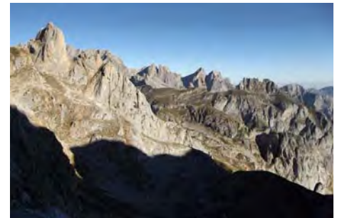
Vistas del Macizo Occidental desde Pambuches