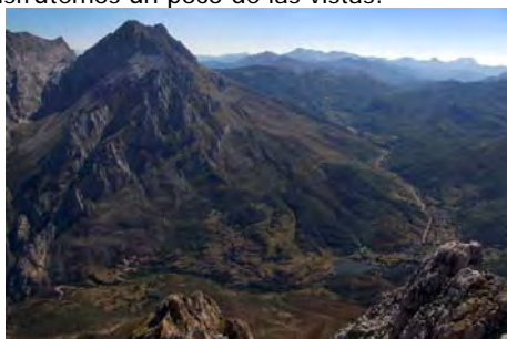
Valdeón bajo la mole del Friero...