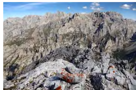
Desde la Central, vista de Los Urrieles...

Para bajar de la Primera Torre, debemos rapelar.