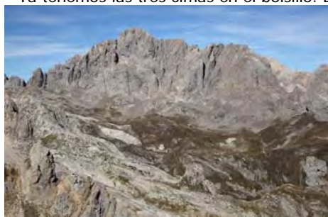
La gran Peña Santa, señora del Cornión...

Ya tenemos las tres cimas en el bolsillo. Disfrutemos un poco de las vistas: