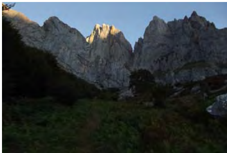
Bajo la Canal y Horcada de Pambuches

Una breve trepada en roca inestable (II grado, cuerda fija a la derecha) nos deja en la Horcada de Pambuches (unas dos horas y media o tres horas de fuerte subida desde Posada)