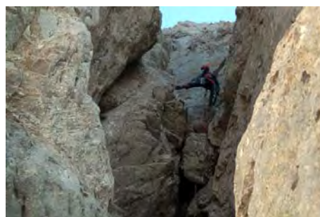
A la izquierda, en la chimenea, antes del bloque. Arriba, tras pasar el bloque entrando en la placa.

Ya tenemos las tres cimas en el bolsillo. Disfrutemos un poco de las vistas: