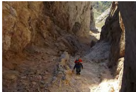
Últimos metros de la canal