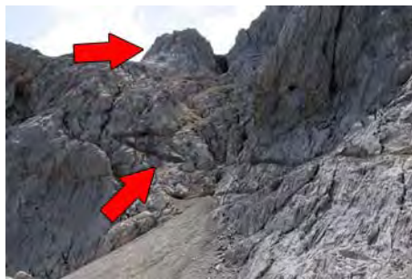
El camino minero y la canal de Altaiz