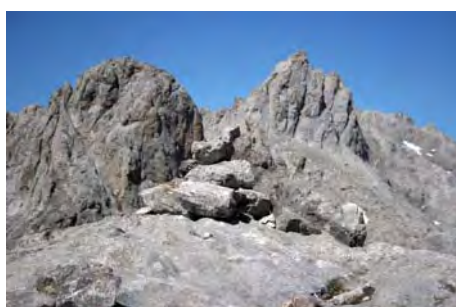
Cima de la Torre Altaiz, 2335 metros

El punto más alto de esta pirámide caliza es la cota del Pico San Carlos. En realidad, Altaiz no es más que una cima secundaria suya. Salimos hacia la izquierda y esquivamos por el Sur un resalte rocoso; posteriormente pasamos por la horcada que marca la salida de la clásica vía de la Canal Norte. Remontamos por las llambrias y coronamos por fin (2390 metros) en unos 20 minutos desde Altaiz.