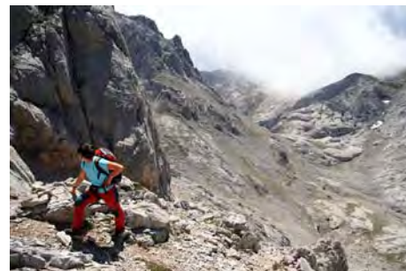
En la canal de acceso

Para bajar, hacemos la cresta cimera hacia la izquierda y bajamos por la fácil ladera Oeste, teniendo el Madejuno frente a nosotros, para bajar a la collada del Tiro Casares. Aquí, torcemos a la izquierda y perdemos altura para esquivar los cortados de la base de la Torre del Hoyo Oscuro. Seguimos unos metros por el camino que baja a Liordes y Jermoso. Al poco, lo abandonamos y ganamos una collada que vemos a la izquierda, sobre nuestras cabezas. Ahora vamos a recorrer un pequeño cordal, bonito y en ocasiones aéreo por lo que tendremos que ir con cuidado. Pasa por un primer cueto sin nombre (2358 metros), hace un descenso por la vertiente Oeste y luego se va afilando. No hay jitos o camino trazado, por lo que debemos buscar el paso más cómodo que veamos siempre procurando caminar cerca del filo y siempre por la vertiente Oeste. En alguna brecha, haremos algún paso de II aéreo antes de llegar a la amplia y agradable Colladina de las Nieves (unos 50 minutos desde el Tiro Casares). En 10 minutos más subimos los 60 metros que nos separan de la fácil cima de La Padiorna (2319 metros) y gozamos de sus vistas, especialmente del abismo sobre la Vega de Liordes al Sur.