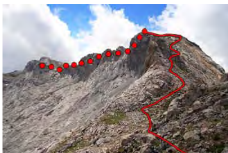
Desde la collada, el recorrido por el cordal