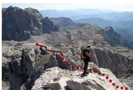
El camino al San Carlos desde éste último