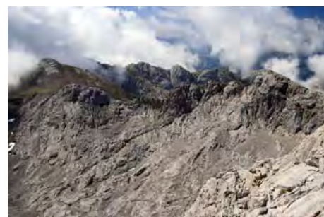
La Padiorna atrás y el cordal que recorreremos