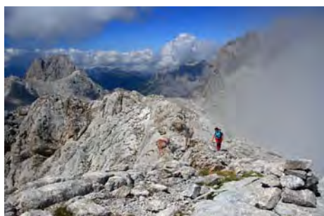
Llegando a cima con el Frierio por detrás

Para bajar, hacemos la cresta cimera hacia la izquierda y bajamos por la fácil ladera Oeste, teniendo el Madejuno frente a nosotros, para bajar a la collada del Tiro Casares. Aquí, torcemos a la izquierda y perdemos altura para esquivar los cortados de la base de la Torre del Hoyo Oscuro. Seguimos unos metros por el camino que baja a Liordes y Jermoso. Al poco, lo abandonamos y ganamos una collada que vemos a la izquierda, sobre nuestras cabezas. Ahora vamos a recorrer un pequeño cordal, bonito y en ocasiones aéreo por lo que tendremos que ir con cuidado. Pasa por un primer cueto sin nombre (2358 metros), hace un descenso por la vertiente Oeste y luego se va afilando. No hay jitos o camino trazado, por lo que debemos buscar el paso más cómodo que veamos siempre procurando caminar cerca del filo y siempre por la vertiente Oeste. En alguna brecha, haremos algún paso de II aéreo antes de llegar a la amplia y agradable Colladina de las Nieves (unos 50 minutos desde el Tiro Casares). En 10 minutos más subimos los 60 metros que nos separan de la fácil cima de La Padiorna (2319 metros) y gozamos de sus vistas, especialmente del abismo sobre la Vega de Liordes al Sur.