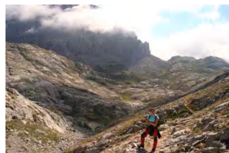
Saliendo de San Luis, camino del Cable al fondo

Con esto habremos dado un completo paseo por las cercanías del Cable. Sin grandes dificultades, el encontrarnos algunas trepadas sueltas dan aliciente al paseo, que si hay suerte haremos en buena parte tranquilos y sin los grandes agobios tan típicos de las proximidades del Cable. Aunque es posible hacer este recorrido en cualquier época del año, en condiciones invernales la subida al Hoyo Oscuro y el recorrido por el cordal sin nombre hacen que la actividad se ponga técnica, por lo que nosotros la recomendamos para las épocas del año que está limpia y haya horas de luz. Sin más, os deseamos suerte y a pasarlo bien. Un saludo del Maquis.