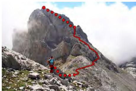
Bajada del San Carlos a la Horcada Verde

Llegamos así a la Horcada Verde (2200 metros), de la que parte nuestra subida a la tercera cima del día, la Torre del Hoyo Oscuro. Para ello buscamos una canal en su cara Sur por la que remontamos, haciendo alguna corta trepada de vez en cuando (II), y que nos deja en la cresta cimera. Caminamos hacia la derecha hasta coronar la cima (2429 metros, unos 40-50 minutos desde el San Carlos)