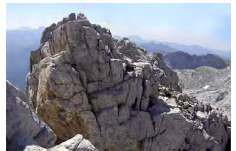
El paso desplomado (II+) que hemos superado

El punto más alto de esta pirámide caliza es la cota del Pico San Carlos. En realidad, Altaiz no es más que una cima secundaria suya. Salimos hacia la izquierda y esquivamos por el Sur un resalte rocoso; posteriormente pasamos por la horcada que marca la salida de la clásica vía de la Canal Norte. Remontamos por las llambrias y coronamos por fin (2390 metros) en unos 20 minutos desde Altaiz.