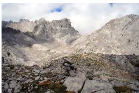
Bajando por el Hoyo Oscuro hacia San Luis