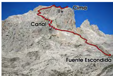
Ruta de subida a la Torre Altaiz desde el Cable

Ahora nos vamos acercando a la montaña: enfrente vemos la canal que nos permite ganar la cresta cimera. Para llegar a ella debemos tomar un camino minero tallado por encima y a la derecha del pedrero inicial, que hace luego una revuelta y se mete en el corto pero incómodo canalón de piedra suelta que superamos para salir a una zona más abierta donde se ubicaban las antiguas minas de Altaiz. Seguimos subiendo (jitos) para ganar la cresta cimera, que seguimos hacia la derecha. Cerca del final encontramos el paso más difícil de la subida, un destrepe a una pequeña brecha, con buenas presas pero desplomado, que nos requerirá cuidado y atención (II+). Al poco rato ya estamos en la amplia cima de la Torre Altaiz, a 2335 metros (unos 50 minutos de subida, dos horas desde El cable).