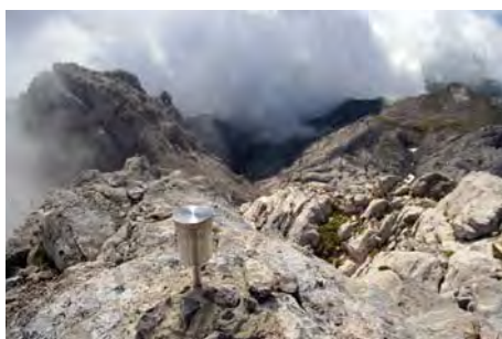
En la cima de la Torre del Hoyo Oscuro