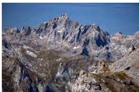
La Peña Santa, vista desde la Padiorna

Ahora ya podemos ir pensando en volver al Cable. Descendemos otra vez a la Colladina de las Nieves y cogemos a la derecha el camino que baja al Hoyo Oscuro, teniendo enfrente nuestro el San Carlos y la Torre del Hoyo Oscuro. Al llegar al hoyo, el camino tuerce a la derecha para bajar por la amplia Canal de San Luis, sin dificultad alguna, y salir a la amplia vega que recorreremos hacia el Este para llegar a la pista de Covarrobres, por la que salimos de buena mañana. Todo ello en poco más de una hora desde la Padiorna.