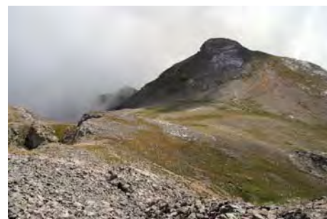
Colladina de las Nieves y La Padiorna

Ahora ya podemos ir pensando en volver al Cable. Descendemos otra vez a la Colladina de las Nieves y cogemos a la derecha el camino que baja al Hoyo Oscuro, teniendo enfrente nuestro el San Carlos y la Torre del Hoyo Oscuro. Al llegar al hoyo, el camino tuerce a la derecha para bajar por la amplia Canal de San Luis, sin dificultad alguna, y salir a la amplia vega que recorreremos hacia el Este para llegar a la pista de Covarrobres, por la que salimos de buena mañana. Todo ello en poco más de una hora desde la Padiorna.