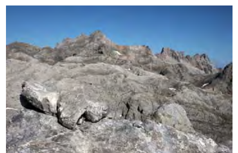
El Tesorero desde la cima del San Carlos

Bajamos por la ruta Normal desde la Horcada Verde, de rápido acceso por la Canal de San Luis. Desde la cima, salimos hacia la izquierda (Oeste) y perdemos altura entre la pedrera, dejando a la izquierda el Hoyo Oscuro y buscando la Horcada Verde al frente.