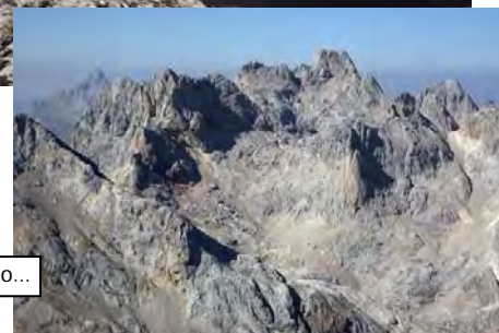
Vistas al Oeste. Torre Santa y Torrecerredo...

Es hora de volver. Nosotros lo hicimos por el mismo camino de subida. Para ello retrocedemos desde la quinta cima, por debajo de todas las demás, rumbo Norte, de vuelta a la Horcada de Lebaniego. A la altura de la primera cima, la más próxima a la horcada, es preciso evitar los muros verticales que nos separan de ella. Lo mejor es remontar bastantes metros por la misma canal por la que descendimos, sin llegar a la cresta cimera pero justo por debajo de ella. Buscaremos el mejor paso para ir descendiendo hasta la horcada, cuidándonos de no caer en ninguno de los cortados que se esconden en esta vertiente. Una vez en la horcada, bajamos Lebaniego y la vira de ascenso para volver a la Vega de Urriellu. Desde la quinta cima, en menos de dos horas ya deberíamos estar allá.