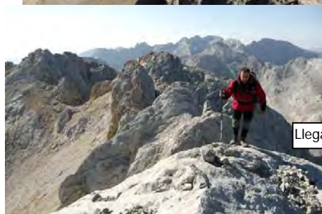
Vista Este desde El Segundo Campanario: Desde la Morra a los Tiros Navarros, en medio queda el macizo Oriental...