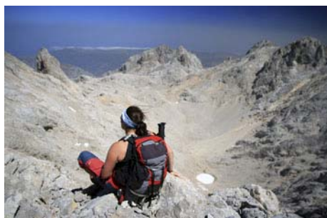
En Torre bermeja, vista Norte: Jou de Cerredo