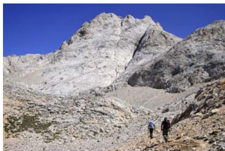
La pared Occidental del Neverón de Urriellu