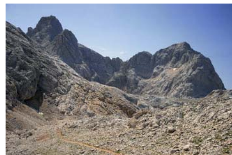
Mirada atrás, Torrecedredo y el Pico Cabrones