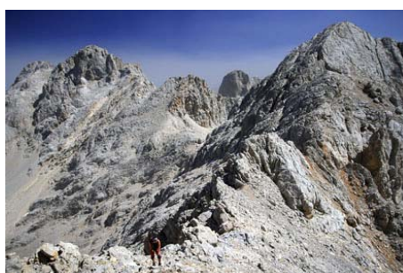
Rampas finales a la Torre de Coello