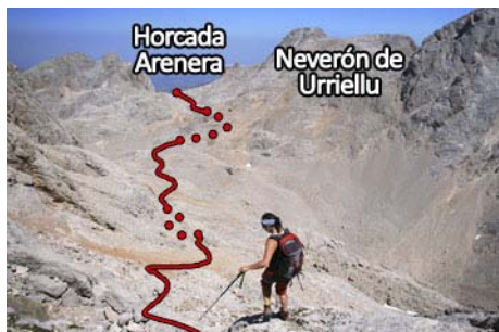
Empieza la bajada: hacia la Horcada Arenera

Una vez hecha la subida y la bajada (unos 40 minutos en total si todo va bien), toca descender por fin al fondo del Jou de Cerredo. Seguimos los jitos que nos llevan, primero por las empinadas pedreras y luego a culebrar entre llambrias y canales (pasos de II aislados, muchos jitos, toca navegar un poco para buscarse el trazado más cómodo) para acabar destrepando el zócalo inferior (II grado) y salir a la base de la montaña, en una amplia explanada con vivacs entre El Jou de Cerredo y el Jou Negro (una media hora de bajada) Aquí, una senda al Norte va hasta el refugio de Cabrones. Otra va al Noreste, escapando del Jou de Cerredo en sucesivos zig-zag hacia los contrafuertes del Neverón de Urriellu. Con algún tramo de subida que a estas alturas del día ya cuesta trabajo, pasa bajo el Neverón y llega en unos 40 minutos a la Horcada Arenera. Aquí, el camino va bordeando la cara Norte del Neverón y desemboca en la amplia Corona del Raso con su clásica vista al Urriellu (15 minutos más)