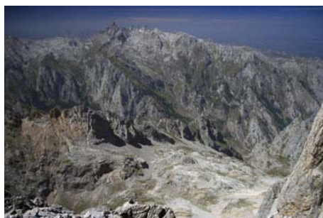
Bajo nosotros, Dobresengos y El Cornión