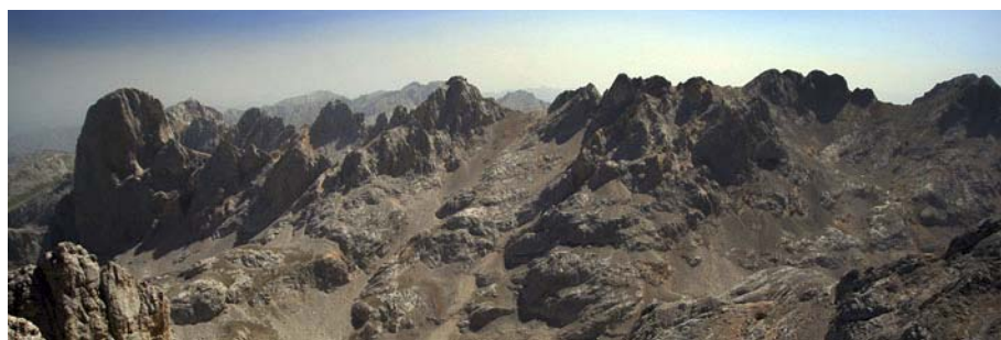
Hacia el Este, el corazón de los Urrieles: Desde el Picu hasta los Picos de Santana.