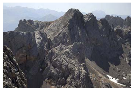
Mirando al Tesorero desde el Norte...

La tercera cima del grupo es la Torre de Coello (2573 metros) . El acceso es rápido, sólo debemos bajar a la Collada bajo el Tiro del Oso y bordear, por el lado del Jou de Cerredo (Norte) una loma (casi por el filo cimero para esquivar mejor cortes y destrepes). Por la pedregosa ladera Este, pasamos bajo la cima hasta la cresta cimera y subimos al Sur los últimos metros para coronar (unos 30-40 minutos desde la cima anterior)