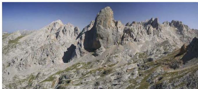
La Oeste y la Vega Urriellu desde la Corona del Raso. Sin palabras...

Con cuidado, bajamos la parte más escabrosa y seguimos la senda hasta el refugio (30 minutos) Si dormimos por aquí, esta ruta se ha terminado. Si bajamos a Pandébano, nos esperan aún casi dos horas más de bajada.