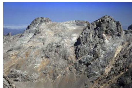
Al Noreste, Neverón y La Párdida

Subir al Torrecedredo (PD, máximo II) es por sí sola una grandísima actividad, de las que justifican un buen día de montaña. Eso sí, requiere mucho cuidado, ya que pese a que la dificultad no es muy alta la parte final no permite un traspies, con una caída mortal directa de una centena de metros. Con tráfico, la caída de piedras es además un factor de riesgo, así que es mejor pensar en renunciar si el cansancio, el gentío o la meteo no acompañan.