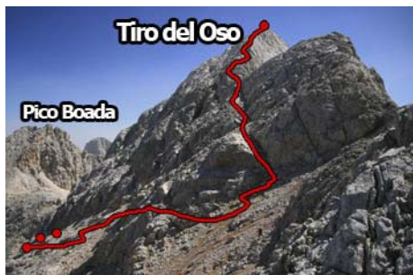
Canal de acceso a cima vista más de cerca...