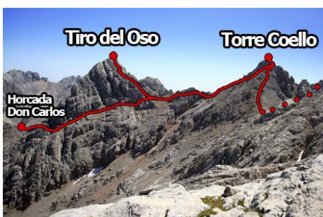
Acceso a Tiro del Oso y Torre Coello

La tercera cima del grupo es la Torre de Coello (2573 metros) . El acceso es rápido, sólo debemos bajar a la Collada bajo el Tiro del Oso y bordear, por el lado del Jou de Cerredo (Norte) una loma (casi por el filo cimero para esquivar mejor cortes y destrepes). Por la pedregosa ladera Este, pasamos bajo la cima hasta la cresta cimera y subimos al Sur los últimos metros para coronar (unos 30-40 minutos desde la cima anterior)