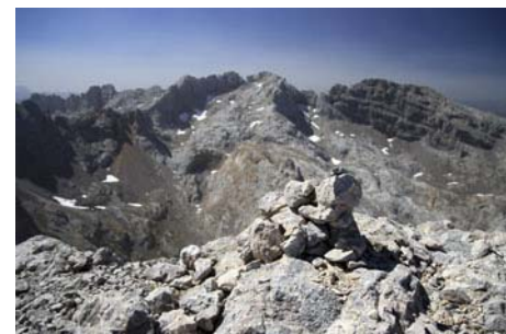
Vistas cimeras. Al Sur, Llambrión y Palanca...