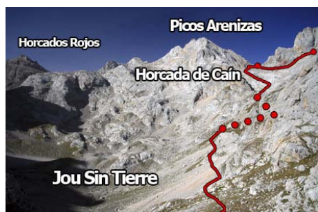
En el collado del Jou Sin Tierra, el camino a seguir

Vega de Urriellu. Tomamos rumbo Sur el marcado camino que lleva a Horcados Rojos y El Cable. En unos 20 minutos de subida, la senda llega a la cabecera del primero de los Jous que atraviesa, el Jou Sin Tierra . Es aquí donde debemos abandonar el camino marcado y buscar un valle que asciende a la derecha. Primero, perdemos altura por la margen derecha del Jou, hasta que encaramos el valle y comenzamos a subir. En este tramo apenas se marca el camino, aunque suele estar generosamente jitado. Entre la roca y las pedreras, vamos remontando el valle hasta aparecer en la angosta Horcada de Caín . Separa los Arenizas del Tiro del Oso. A ella se llega en algo más de una hora desde Urriellu. Nuestro camino no se detiene aquí, sino que seguimos subiendo rumbo norte a buscar la siguiente y más alta horcada, la Horcada de Don Carlos , a donde llegamos en unos 15 minutos más de marcha. Ahora, a 2413 metros, damos cara al Jou de Cerredo y a las cimas que subiremos hoy.