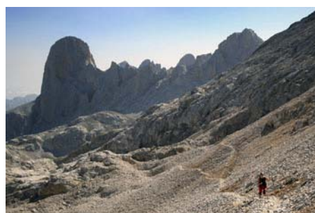
Llegando a la Horcada de Cain con el Pico detrás