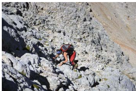
Trepadas finales al Tiro del Oso (2567 metros)