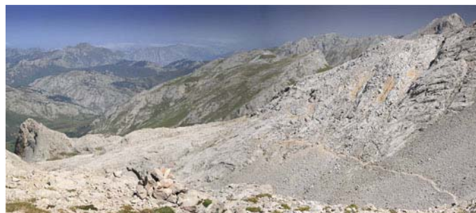
Horcada Arenera, vista a la senda que nos baja a la Corona del Raso