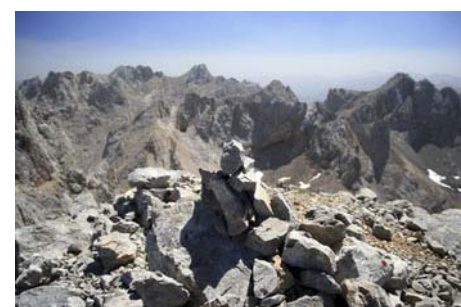
Cima de la Torre de Coello: Vistas al Sur...

Llevamos un buen rato de camino (casi cuatro horas desde la Vega de Urriellu) y aún nos quedan por coronar las dos cimas más altas del circo, que superan los 2600 metros de altura. Para la Torre Bermeja (2600 metros) debemos perder unos 100 metros de altura hacia el Norte, bajando la pedregosa ladera que la separa de la Torre Coello; después, vamos remontando en similar estilo al Norte, hasta una brecha entre las dos cimas a la que llegamos en una breve y fácil trepada. Ahora damos cara por primera vez a la vertiente Oeste, sobre el Jou Grande y la canal de Dobresengos. Volando sobre este entorno sobrecogedor sin mayores dificultades llegamos por fin a la cima de La Bermeja (unos 40 minutos más desde la Torre Coello)