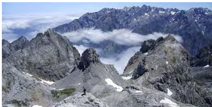
Vista Este: La Robliza, Tiro La Llera, Piedra Lluenga, Los Urrieles