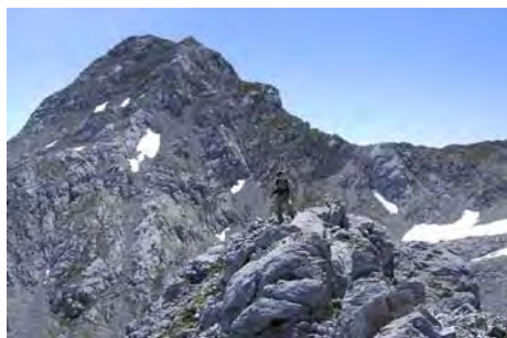
En la modesta cumbre del Pico Los Asturianos