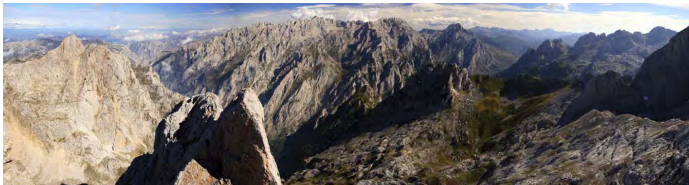
Panorámica al Este: La Robliza, abismo del Cares, canal de Mesones y sector de La Bermeja. Al otro lado, el sector Oeste de los Urrieles al completo

Ya es hora de volver. Ahora buscaremos el camino más cómodo y marcado. Tenemos que descender a la base y luego auparnos al collado bajo la Torre de Los Traviesos (es posible ascender por esta vertiente la cima, ver la traza azul del itinerario anterior y seguir el resto de cimas en sentido contrario al reseñado). A media altura, sin senda clara, faldeamos su vertiente Sur, la que se levanta sobre el Jou Santu y buscamos el collado entre la cima y la Torre de la Canal Parda. Aquí cambiamos de vertiente y pasamos al Norte por una senda que faldea bajo esta cima y el Pico Los Asturianos. Ahora tomamos el itinerario anterior en sentido descendente, apareciendo rápidamente en el camino a Vegarredonda en unos 50-60 minutos de paseo desde la cima de Piedra Lluenga. En algo más de una hora por el camino de Las Barrastrozas estaremos de vuelta en el refugio.