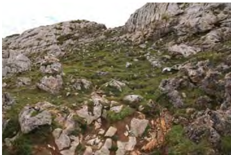
El desvío al Este cerca del refugio viejo Los Cabrones

Salimos de Vegarredonda hacia la Llama Cimera y el refugio viejo. Un poco antes de llegar a él, hemos de fijarnos en una leve senda jitada que sube a la izquierda. Subimos la loma y nos internamos en el Caleyón del Francés. Enfrente, el camino jitado va al Este a Justillagar. Tenemos que fijarnos en una línea de jitos que lo abandona para remontar la vallina rumbo Sureste. En unos cuarenta minutos remontando en ese rumbo, aparecemos en un amplio collado (El Resquilón) con bonitas vistas de las Cebolledas y la Torre santa de Enol sobre nosotros. Ahora, los jitos nos hacen caminar al Este y encarar el caos calizo rumbo al Conjurtao, que se adivina lejano. Vamos durante una hora en continuo sube y baja, atravesando pozas y canalones, a veces con amplias vistas y otras empozados, hasta que llegamos a las proximidades del Conjurtao y el canalón que baja a Resecu. Hay dos canales paralelas aquí: por la Norte van los jitos, ya que es la salida del Anillo hacia Aliseda. Nosotros seguimos de frente por la canal Sur un rato hasta que aparecemos en una horcada encarando el Noreste del Cornión (unas dos horas desde Vegarredonda)