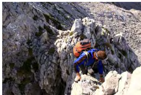
Trepadas y destrepes cuidadosos en este tramo