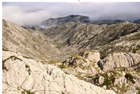
Abajo, al Norte, nos queda el valle de Resecu