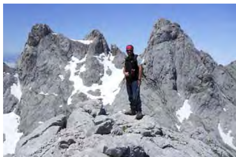
La Canal Parda, detrás la Torre Santa de Enol