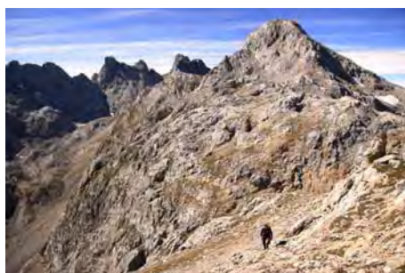
Camino a cima; Torre de Los Traviesos detrás