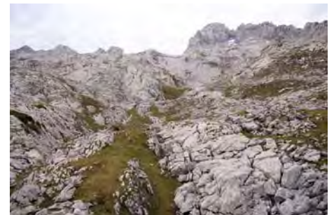
En el Resquilón con las cimas sobre nosotros