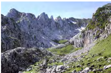
Empieza la ruta en la canal de Vegarredonda

Estas tres conocidas y muy ascendidas cumbres, tanto en invierno como en verano, se ascienden relativamente bien y en pocas horas desde el refugio de Vegarredonda. A este refugio, accedemos desde Pandecarmen en poco más de una hora de placido paseo por los pastos, así que estamos hablando de cimas que se pueden atacar en el día. Para llegar bajo ellas, sólo tenemos que tomar rumbo Sur el camino-autopista del parque, obviar el desvío al mirador de Ordiales y tomar de frente la canal de Vegarredonda. En la parte alta aparece un nuevo desvío y nos vamos a la izquierda. Remontamos hasta el espectacular collado de La Fragua, donde cambiamos el valle por las alturas, y vamos rumbo Sureste bajo los Argaos por la zona de Las Barrastrosas. Nos encaminamos a un punto débil bajo las diversas cimas que parece que nos cierran el paso, en busca del Jou Santu. Antes de entrar en los jous, nos fijamos en un pequeño pico que se levanta a la izquierda, enfrentado a la mole de la Torre Santa de Enol. Es el Pico Los Asturianos, nuestra primera cima. Para llegar a él abandonamos el camino justo al llegar a la boca del jou homónimo a buscar su punto débil en la cara Este, así que bordeamos el pico por el Norte y buscamos una corta canal para coronar (2274 metros, a casi dos horas de Vegarredonda. Atención al punto donde dejamos el camino, aunque suele haber jitos)