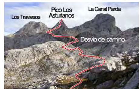
Nuestras cimas y ruta de acceso a la primera...