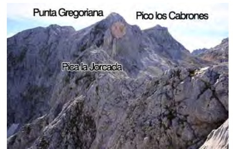
Llegando a la cima de la Pica La Jorcada

Ahora seguimos hacia la Punta Gregoriana y Los Cabrones. En realidad, es un único macizo con una meseta cimera que separa las dos cotas, una al Norte (La Gregoriana) y otra al Sur (el Pico o Torre de Los Cabrones). Primero bajamos de la Jorcada, volviendo por la cresta y buscando alguna canal factible al Sur por la que destrepar. Seguimos una traza de rebecos que pasa bajo las cimas hacia el Sur. A mitad de pared ascendemos en busca de una breve canal que nos remonta a media meseta. Torciendo al Norte, vamos a la Punta Gregoriana en 35 minutos (2266 metros). Volviendo al Sur, subimos Los Cabrones (2287 metros) en 10 minutos más.