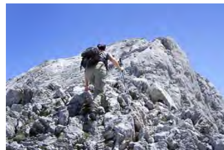
Subida a la Torre de los Traviesos