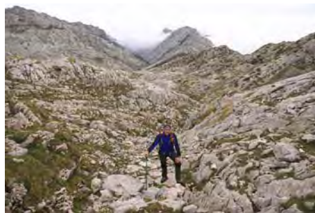
Remontando el Caleyón del Francés