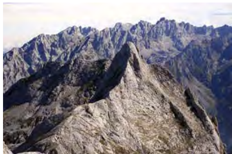
En la Punta Gregoriana: vista sobre La Robliza