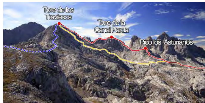
En rojo, ruta de subida. En amarillo, descenso. En azul, continuación

Si queremos seguir la actividad bajamos por la ladera Noreste, mirando hacia Aliseda y evitando cualquier complicación que nos aparezca (no hay jitos, pero es sencillo). En la parte baja, torcemos al Este para buscar el collado que separa el Tiro La Llera y Piedra Lluenga. En total, podemos haber invertido unas cuatro horas desde Vegarredonda.