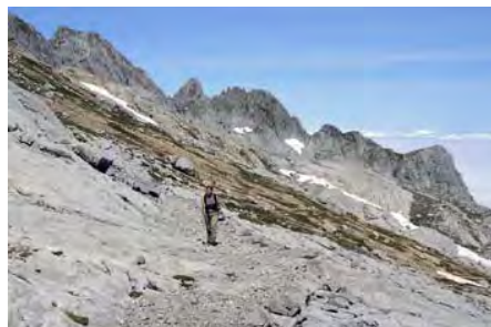
Parte superior, atrás quedan los Argaos