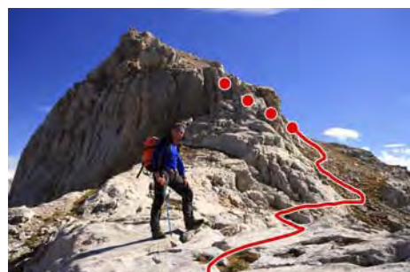
Al pie de la montaña, empezando la subida