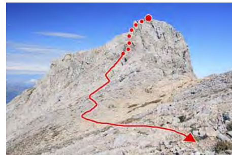
Descenso del Pico Los Cabrones al Tiro la Llera

Para bajar, tomamos la ladera Oeste cerca de la cima, que nos deja en una pequeña meseta que constituye cota (Porru La Capilla, casi inapreciable). Seguimos bajando al Sur para acercarnos al siguiente pico, el altivo Tiro la Llera. Remontamos la ladera pedregosa hasta la base; donde salen dos canales. Subimos por la de la derecha, que sus primeros metros tiene un corto paso algo complicado (III-) para auparnos en un punto donde se ve que se perdió una presa en los últimos inviernos. Luego se hace más fácil (II-) y al poco cambiamos a la pedregosa canal de la izquierda, por donde subimos con cuidado hasta coronar (2283 metros, 10 minutos de trepada y otros 30 desde la cima de Los Cabrones; cuidado al bajar con la piedra suelta y el destrepe inicial)