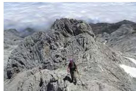
En la cresta Norte de la Torre de la Canal Parda