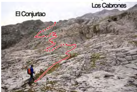
El camino que seguiremos la próxima hora