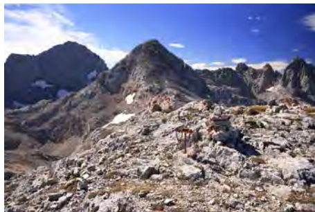
Cima del Pico Los Cabrones, vista Suroeste