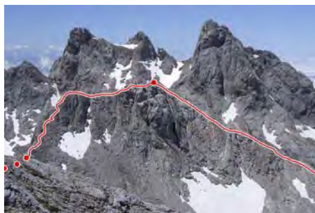
Ascenso y descenso de la Canal Parda