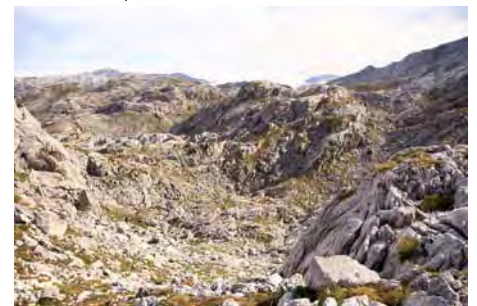
Dando vistas a Aliseda y sector del Jascal

Para subir la primera cima, la Pica la Jorcada, vamos rumbo Sur bajo la cresta por la vertiente Oeste. Estamos sobre el Joón de los Desvíos, y el terreno se empieza a poner arisco. Es hora de auparse a la cresta de la Pica. Trepamos de frente un muro (unos 10-15 metros, pasos de II) para auparnos. Ahora seguimos cresteando. Un tramo afilado nos obliga a hacer varios trepes y destrepes (pasos aislados de II y II+, roca irregular). Luego se pone más sencillo hasta las proximidades de la cima, donde vuelve a afilarse algo. Desde la horcada, hemos tardado unos 40-50 minutos para llegar hasta la cumbre (2137 metros)