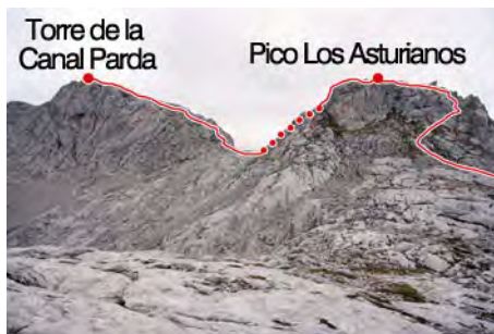
Subida al Pico los Asturianos y a La Canal Parda