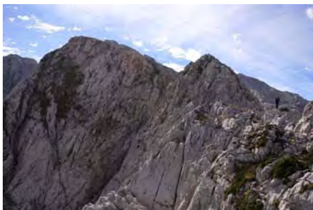
La cresta que sube la Pica La Jorcada

Para subir la primera cima, la Pica la Jorcada, vamos rumbo Sur bajo la cresta por la vertiente Oeste. Estamos sobre el Joón de los Desvíos, y el terreno se empieza a poner arisco. Es hora de auparse a la cresta de la Pica. Trepamos de frente un muro (unos 10-15 metros, pasos de II) para auparnos. Ahora seguimos cresteando. Un tramo afilado nos obliga a hacer varios trepes y destrepes (pasos aislados de II y II+, roca irregular). Luego se pone más sencillo hasta las proximidades de la cima, donde vuelve a afilarse algo. Desde la horcada, hemos tardado unos 40-50 minutos para llegar hasta la cumbre (2137 metros)