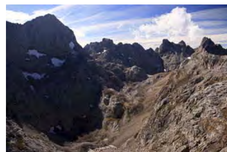
Vista al Jou Santu y las cimas que lo cierran