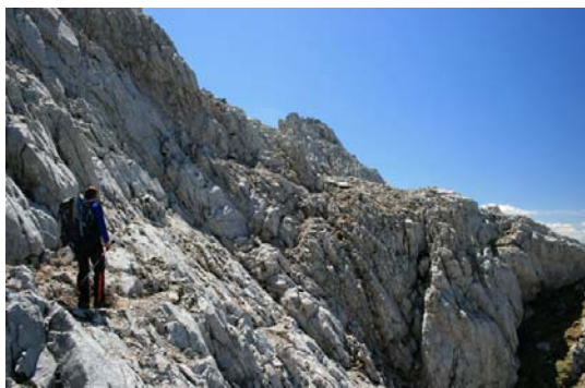
En la travesía entre las cimas

Finalmente, salimos a un collado previo a la cima del Prao. Unos minutos de ascenso y ya estamos en la segunda cima de la jornada. Desde el Cortés, la travesía lleva menos de una hora de recorrido.