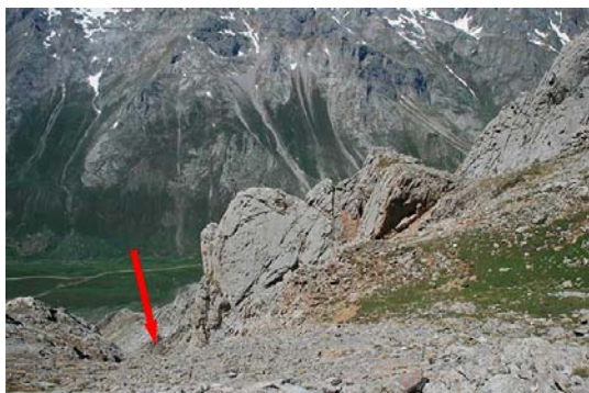
El inicio de Las Grajas y el espolón de referencia a la derecha

Para el descenso por Las Grajas, debemos retornar al collado previo a la cima. De frente hacia el Oeste, una larga canal de piedra descompuesta será nuestra ruta de descenso. Al comienzo del mismo, bajaremos pegados a un marcado espolón, para conectar más abajo con una larga pedrera que nos depositará en los prados de Áliva. Mucho cuidado con la abundante piedra suelta (en invierno, las pendientes se acercan a los 40°).