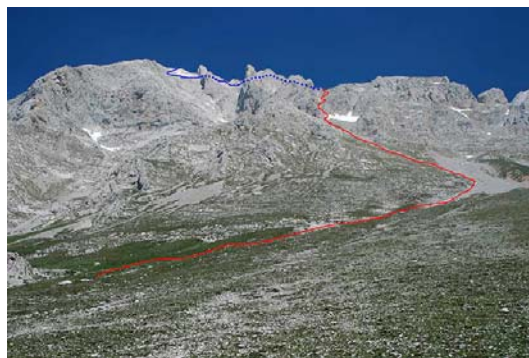
Desde Áliva, la travesía entre cimas y el descenso de Las Grajas

Después de un par de horas de descenso, conectamos por fin con la pista de Sotres-Áliva. La seguiremos de vuelta hacia el coche (una hora más de recorrido)