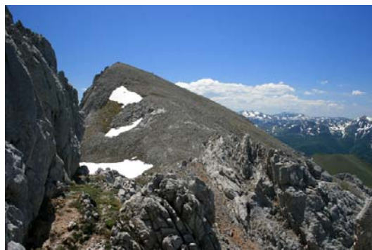
Al fondo, el Prao Cortés

Para el descenso por Las Grajas, debemos retornar al collado previo a la cima. De frente hacia el Oeste, una larga canal de piedra descompuesta será nuestra ruta de descenso. Al comienzo del mismo, bajaremos pegados a un marcado espolón, para conectar más abajo con una larga pedrera que nos depositará en los prados de Áliva. Mucho cuidado con la abundante piedra suelta (en invierno, las pendientes se acercan a los 40°).