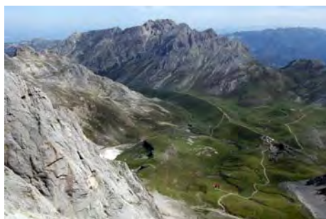
Hacia el Este, los Puertos de Áliva