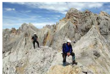
Llegando a cima bajo Peña Vieja