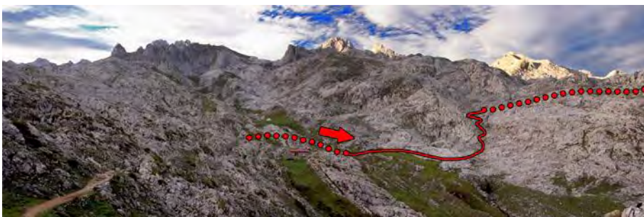
Desde el collado Gamonal, miramos a Vegarredonda y el camino al Mirador de Ordiales

Dejando el refugio nuevo a la derecha, llegamos al primer cruce, bien marcado. De frente, el camino hacia la Llampá Cimera. A la derecha, la ruta al mirador de Ordiales. Por ahí nos vamos, remontando primero una corta canal y luego llaneando por plácido sendero durante una hora, hasta el prado y el refugio del ICONA. Justo al pasar éste, veremos la senda jitada que nos aúpa al Cotalba, aunque es obligado continuar unos metros para disfrutar las vistas del mirador, de las mejores del Cornión. Luego, podemos deshacer los pocos metros de más que hemos recorrido para tomar la subida a la primera cima del día.