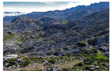
Mirando hacia atrás en el camino