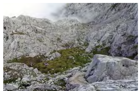
Hacia Vegarredonda por buen camino

Así terminamos una bonita y técnica ruta por el guapo entorno de la parte Occidental del Cornión. Recordamos nuevamente dos cosas: el riesgo de caída en la subida al Requexón (útil llevar material de aseguramiento para este tramo), y que el único escape rápido está entre la Canal Vaquera y el Tercer Poyón hacia el Norte. Os deseamos buena suerte si queréis repetirla. Un saludo del Maquis.