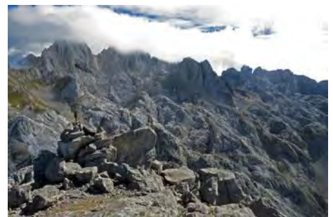
Cima del Requexón y vistas hacia el Este

Ahora empezamos el descenso. Seguimos hacia el Este, siguiendo los numerosos jitos que nos hacen bajar por dicha ladera. Va ganando verticalidad para cortarse en su parte baja. Aquí, torcemos a la izquierda usando las manos en un estrecho y cuidadoso paso (II-) antes de llegar por fin al suelo. Ahora debemos remontar hasta el vecino y herboso collado Les Merines, o bien acortar en una brecha previa bajando una canal y, cuando se acabe, ir torciendo a la derecha para salir a la parte inferior del camino (delicado con niebla). Una vez ya encontrado éste, lo seguimos en descenso hasta el cruce con el que viene del Jou Santu, y aquí ya rápidamente por la Canal de Vegarredonda hasta el refugio y su fuente. Y de aquí ya otra vez a Pandecarmen (hora y media desde el Requexón).