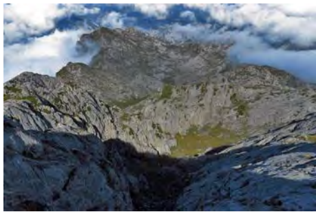
Mientras subimos, miramos hacia abajo