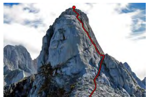
La Canal Oeste del Requexón enfrente

Como vemos en las fotos, remontamos hacia la derecha del pico por una estrecha vira hasta su final. A la derecha se ve una chimenea estrecha y difícil, que por fortuna no es la nuestra. A su izquierda, otra chimenea, más abierta, nos permite subir con una delicada trepada de unos 20-25 metros, con aéreos y mantenidos pasos de III grado sobre los abismos de Ozanía. Salimos finalmente a la instalación de rápel y de aquí, andando ya, hasta la cima del Requexón (2174 metros, unos 30 minutos desde el Tercer Poyón).