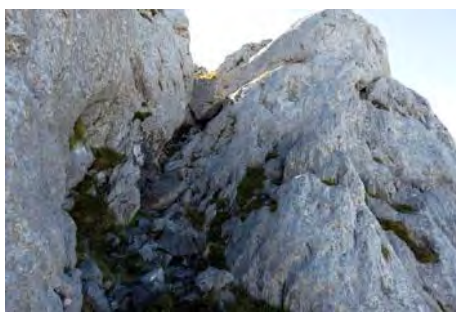
La canal que nos sube al Tercer Poyón