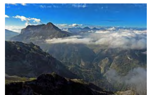
... en un emplazamiento increíble.

La subida al Cotalba consiste en remontar la ladera, siguiendo los abundantes jitos y cruzando alguna pequeña poza siempre en el mismo sentido, hasta llegar a la cima y sus 2026 metros, en poco más de media hora desde la pradera de Ordiales.