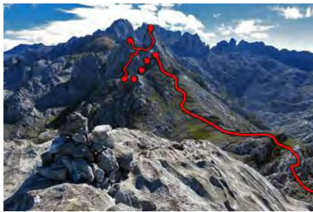
Desde la cima del Cotalba, la ruta a seguir