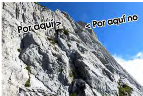
Por aquí > < Por aquí no

Como vemos en las fotos, remontamos hacia la derecha del pico por una estrecha vira hasta su final. A la derecha se ve una chimenea estrecha y difícil, que por fortuna no es la nuestra. A su izquierda, otra chimenea, más abierta, nos permite subir con una delicada trepada de unos 20-25 metros, con aéreos y mantenidos pasos de III grado sobre los abismos de Ozanía. Salimos finalmente a la instalación de rápel y de aquí, andando ya, hasta la cima del Requexón (2174 metros, unos 30 minutos desde el Tercer Poyón).