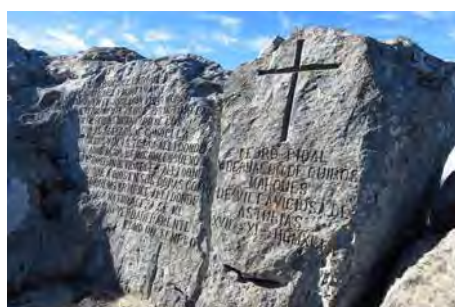
La tumba de Pedro Pidal...