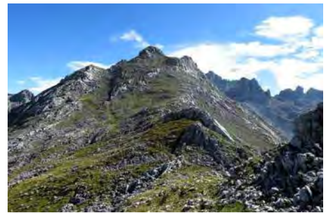
Bajo de la Torre de la Canal vaquera

Como se ve en la foto central anterior, debemos descender y seguir rumbo Sur hacia la Torre de la Canal Vaquera. Pasamos un primer tramo de roca más tortuoso y subimos luego por herbosa ladera hasta los 2041 metros de este pico (25-30 minutos desde el Cotalba). El siguiente pico ya presenta algo más de complicación. Frente a nosotros, el Tercer Poyón parece inaccesible. Sin embargo, en su parte central esconde una corta canal que nos permite superar este muro sin grandes problemas, sólo echar las manos (cortos pasos de II grado). Por cierto, en la collada entre el Poyón y la Canal Vaquera tenemos un escape cómodo al camino de Ordiales bajando la canal que da nombre a este pico (más bien un valle) y saliendo al camino, más o menos a la mitad de su desarrollo.