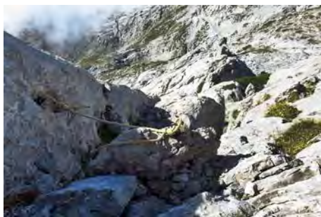
El rápel de bajada y el patio bajo nosotros