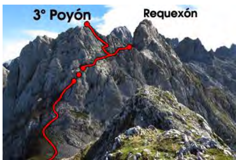
En la Canal Vaquera, hacia el 3° Poyón