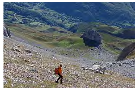
Abajo el Peñón Chico: la carretera al fondo

Y así terminamos dos propuestas, ambas muy alpinas pero una mucho más técnica que otra (y ambas para tomar con su debido respeto y cuidado) a las dos cimas orientales de las Peñas Cifuentes, allá donde se terminan los Urrieles al Sur. Disfrutadlas como se merecen y mucha suerte allá arriba. Un saludo del Maquis.