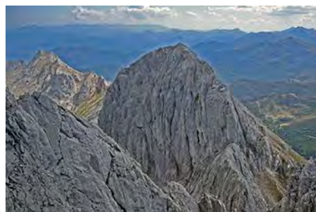
La Torre de Salinas justo al Este