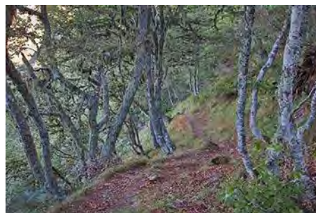
Subiendo por el PR por el fayéu