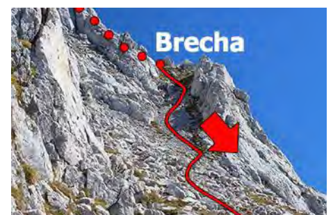
Bajada desde la brecha rumbo Oeste

Ahora estamos justo en el inicio de las Traviesas de Salinas, un aéreo paseo colgando sobre el valle de Valdeón que en unos cuarenta minutos nos lleva al otro lado del macizo, tras cruzar bajo la cima de la Torre del Hoyo de Liordes.