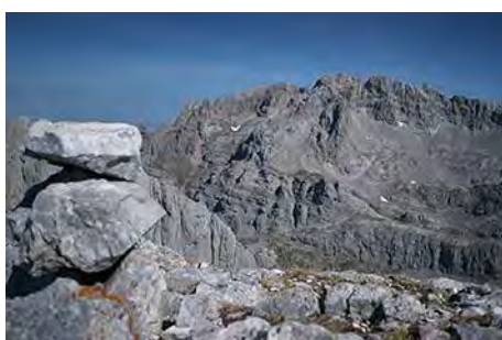
El Llambrión desde la Torre de Salinas