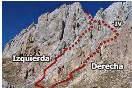
Las dos canales Sur de la Torre de Liordes

El siguiente tramo es compartido con la vía anterior, volviendo a la brecha (o con una incómoda bajada desde la cima) para tomar el camino de las Traviesas de Salinas, hasta pasar el destrepe de II (ver la reseña anterior). Aquí tenemos ya enfrente la mole Sur de la Torre del Hoyo de Liordes, donde se esconden las canales que permiten una subida directa, trabajosa eso sí con numerosas trepadas y roca irregular, hasta las cercanías de la cima. En realidad son dos las canales gemelas, que se unen más arriba. Las divide una característica franja de roca rojiza. Nosotros remontamos por la de la derecha, con numerosas trepadas y una en concreto de cuidado (-IV), en un estrechamiento antes de converger (5 metros, roca buena). La izquierda tiene también varias trepadas, no tan difíciles.