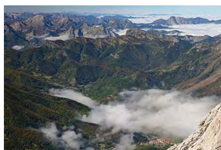
Valdeón bajo nosotros, al Suroeste