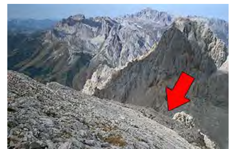
El punto donde empezar el descenso

Una vez de vuelta a tierra, ahora volveremos al punto de retorno. El camino pasa por llambrias y pedreras, y aunque tiene algunos tramos jitados requiere algo de intuición para salir airosos y volver al Alto de la Canal de Pedabejo. Lo desaconsejamos en caso de niebla o con poca luz