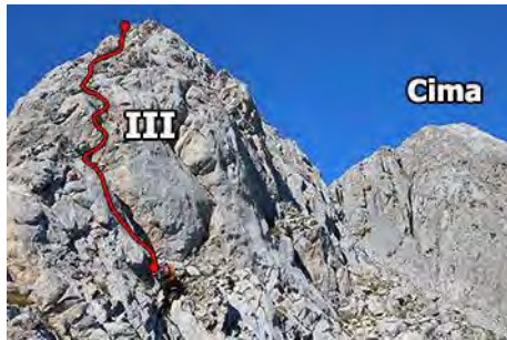
Primer muro, paso clave de la vía

Más arriba, volvemos a superar otro muro, más corto (3 metros) y sencillo (II) que el primero. Y salimos ya a la parte cimera, donde al poco convergemos con el camino de la vía Normal. Pasamos junto a la brecha de inicio de las Traviesas (ver la ruta anterior), por la que pasaremos a la vuelta, y coronamos al poco rato por la cresta cimera, en una hora de amena subida desde la base de la arista.