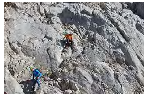
Destrepeando La Torre, por la vía Normal

El descenso lo hacemos por la vía Normal del pico, que describimos en la ruta anterior (ojo si bajamos con poca luz o niebla no pasarnos el punto de entrar a la canal de destrepe). Salimos así a la collada del Hoyo Chico. Aquí tenemos que buscar una canal, con jitos, que baja rumbo Oeste, colgada sobre la Chavida. Perdemos unos pocos metros y rápidamente torcemos a la derecha, yendo en ligero descenso y pegados a la Torre del Hoyo Chico para acercarnos a la collada de Chavida (tramo jitado, 40 minutos desde la cima).