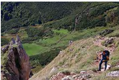
Remontando el sedo, encima del valle