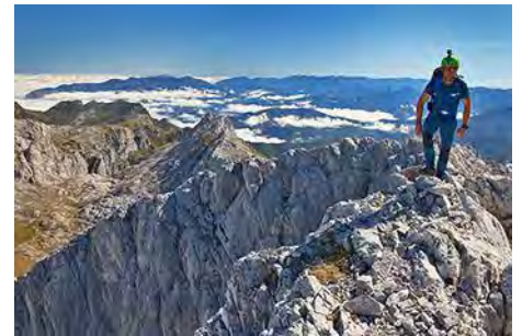
Por la cresta, llegando ya a la cima

El siguiente tramo es compartido con la vía anterior, volviendo a la brecha (o con una incómoda bajada desde la cima) para tomar el camino de las Traviesas de Salinas, hasta pasar el destrepe de II (ver la reseña anterior). Aquí tenemos ya enfrente la mole Sur de la Torre del Hoyo de Liordes, donde se esconden las canales que permiten una subida directa, trabajosa eso sí con numerosas trepadas y roca irregular, hasta las cercanías de la cima. En realidad son dos las canales gemelas, que se unen más arriba. Las divide una característica franja de roca rojiza. Nosotros remontamos por la de la derecha, con numerosas trepadas y una en concreto de cuidado (-IV), en un estrechamiento antes de converger (5 metros, roca buena). La izquierda tiene también varias trepadas, no tan difíciles.