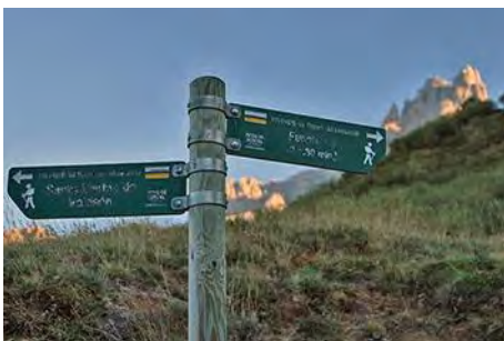
Poste de inicio, debajo del Friero

La salida la haremos desde el Valle de Valdeón. En concreto unos kilómetros por encima de Santa Marina, cerca de la vueltona y junto al kilométrico 14 de la carretera entre esta localidad y el puerto de Pandetrave, a 1365 metros de altitud. Aquí cruzamos la carretera y vemos una señal de cruce de PR, por donde torcemos a la derecha. Nuestra primera parte de la ruta va por el PR PNPE 15, que sube hacia el Este en un precioso inicio de ruta. Primero cruzamos el hayedo, luego remontamos entre escoba por senda bien despejada, y finalmente salimos al Caben de Remoña, confluyendo con la pista de Pandetrave, en unos 45-50 minutos de cómoda subida. Del cruce de caminos, tomamos el que asciende al Noreste y nos deja al poco al pie de la Canal de Pedabejo (abrevadero con fuente). Esta vez no iremos por el evidente camino hacia la canal, sino que nos fijamos en un leve sendero jitado, que asciende por la ladera de la izquierda en fuerte pendiente y varias revueltas. Es el vertiginoso Sedo Pedabejo, que sube directamente por la parte izquierda de la canal y que para nuestras intenciones nos viene al pelo. Subiendo por él con cuidado, en menos de media hora estamos bajo la arista.