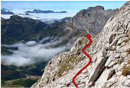
El hombro inicio de las Traviesas

Seguimos unos minutos a un segundo hombro, a la altura del primero (un jito) donde encontramos un corto destrepe por una canal (II, unos tres metros). Ahora continuamos por la parte superior de la ladera, dejando atrás la afilada cima de la Torre de Salinas y pasando bajo las canales Sur de la Torre del Hoyo de Liordes (hay una ruta directa de subida aquí, que señalamos en la siguiente ruta). El siguiente hombro a traspasar lo tenemos al fondo, un buen rato más adelante. Las Traviesas están compuestas aquí por abundante piedra suelta, algo de tierra y en cortos tramos sendero de rebecos. Hay jitos que marcan el camino, pero lo mejor es elegir un día con buena visibilidad para evitar peligrosos embarques. Como decíamos al inicio, éste es un tramo que con hielo, nieve o sólo en mojado tiene un peligro mortal potencial. No olvidemos esto, a pesar de la belleza del paseo que estamos dando.