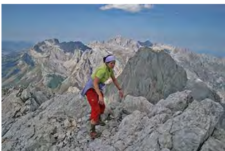
Llegando a la cima de la Torre