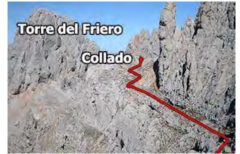
Parte final, salida al Collado del Hoyo Chico

Los últimos tramos de las Traviesas son bastante aéreos, pero en cambio la traza del sendero mejora y nos permite por fin, tras unos 40-50 minutos de recorrido, salir a la collada del Hoyo Chico, entre la torre homónima y nuestro destino, la Torre del Hoyo de Liordes.