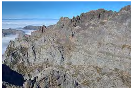
El sector de Jermoso justo al Noroeste