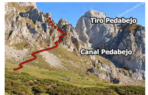
Trazado del Sedo Pedabejo