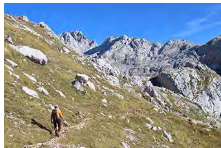
Parte superior, cerca del Alto La Canal