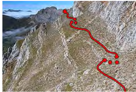
En la parte central, el paso por las Traviesas