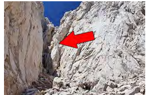
El duro estrechamiento (IV-) de la canal

En la parte superior las canales se unen, y ahora se gira a la izquierda en busca de la cima, en una vertical trepada. Es más sencillo buscar la brecha a la derecha, que separa las dos cimas de la Torre del Hoyo de Liordes, adonde trepamos cómodamente. Podemos coronar la cima Este, más baja, a la derecha, y luego volver y luego volver a la brecha para trepar a la cima principal, por la vertiente Norte (derecha). En una hora desde la cima de la Torre de Salinas, ya estaremos sobre los 2477 metros de la cima principal.