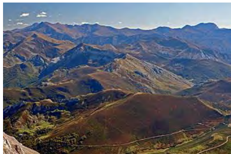
La montaña palentina se extiende al Sur

En la parte superior las canales se unen, y ahora se gira a la izquierda en busca de la cima, en una vertical trepada. Es más sencillo buscar la brecha a la derecha, que separa las dos cimas de la Torre del Hoyo de Liordes, adonde trepamos cómodamente. Podemos coronar la cima Este, más baja, a la derecha, y luego volver y luego volver a la brecha para trepar a la cima principal, por la vertiente Norte (derecha). En una hora desde la cima de la Torre de Salinas, ya estaremos sobre los 2477 metros de la cima principal.