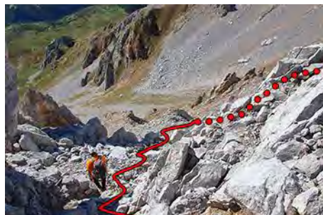
Canal de bajada del Hoyo Chico a la Chavida

No es preciso llegar a la collada, podemos coger la senda y bajar directamente por la pesada canal hasta desembocar primero en los pastos junto al Peñón Chico; luego por cualquiera de las riegas a izquierda o derecha, bajar al collado Peranieva y de ahí, justo debajo al Este, el chozo de Urdias. Aquí tenemos un sendero que sigue al Este, bajando a los prados de Cañabedo junto a la curvona, en una hora de descenso directo desde la Chavida.