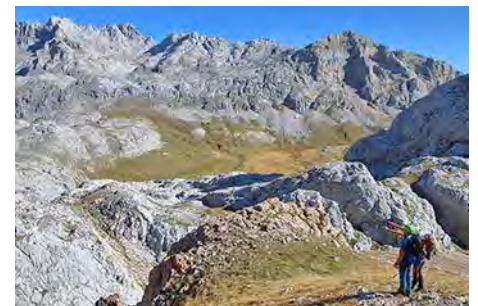
Con preciosas vistas a la Vega de Liordes

Y aquí empieza el baile: la entretenida ascensión de la arista Sureste de la Torre de Salinas, aérea y sencilla, pero que hay que tomar con cuidado. Se puede llevar algo de material (cuerda y fisureros) para los pasos clave, pero lo mejor es llegar aquí con soltura y experiencia en trepadas.