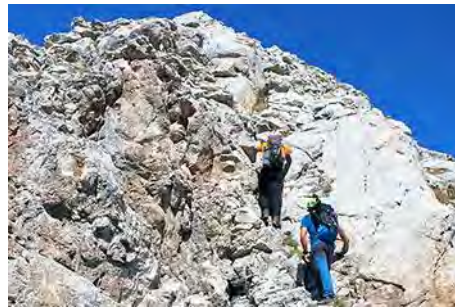
El muro de la parte superior