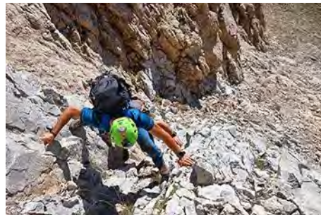
Trepadas iniciales por la variante derecha