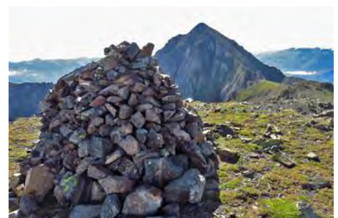
Cima del Montfaucon con el Arbizon al fondo