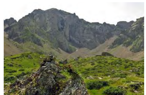
Ya abajo, mirando a la cara Norte del Arbizon

Tras cruzar este llano acometemos otro tramo de bajada, éste más cómodo por terreno herboso, atravesando la antigua morrena glaciaria y donde seguimos senda jitada. Un rato después, otra vez por terreno más llano, vemos cerca el Lac d'Arou . Podríamos ir hasta él o acortar y torcer a la derecha antes, siguiendo senda de ganado hasta llegar al camino de subida (otros 30-40 minutos desde la cabecera superior). Rumbo Este, en media hora más (hora y media desde la brecha y algo más de dos horas desde la cima del Arbizon) volvemos a la Hourquette d'Ancizan . En total, la ruta nos puede salir cerca de siete horas de marcha.