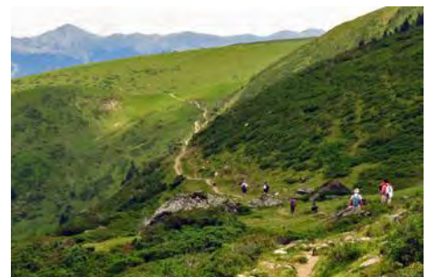
Camino a Ancizan, a estas horas concurrido

Disfrutad este paseo pirenaico, a tramos aventurero, con cuidado. Suerte y un saludo del Maquis.