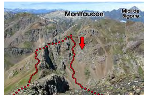
La espeluznante canal de descenso...

Es hora de comenzar el descenso. Para ello nos toca deshacer buena parte de la travesía entre las cimas. Primero perdemos altura otra vez hacia la brecha de Aurey y ascendemos por el mismo camino de ida, que bordea las agujas por su parte Sur. Tenemos que buscar la brecha de Montfaucon, sobre la cota 2650, por la que pasamos a la ida (algunos jitos ayudan a reconocer este paso).