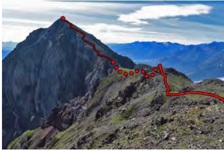
Largo camino hasta el Pic Arbizon

Vemos aún lejano el Arbizon. Para llegar allá debemos perder altura y flanquear algún tramo para evitar el peor terreno. Vamos dirección Sureste, en descenso. A los diez minutos pasamos al lado de una marcada brecha con jitos. Ojo a este punto porque es aquí donde tenemos que regresar para bajar. De momento, seguimos perdiendo altura. Varias agujas y paredes nos exigen ladear por su flanco Sur, sobre el valle de Aulon y por debajo de 2600 metros de altura (20 minutos desde el Montfaucon); subimos luego a la Breche d'Aurey , donde llega la dura subida que viene de las granjas de Lurgues. Ahora ya sólo nos falta remontar hasta la cima.