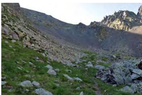
Debajo del collado y la pedrera

La senda nos deja justo al pie y vemos que no va a ser tan pesada como parece. Hay buena traza, que con varias zetas nos permite remontar de forma pausada pero continua, los metros que nos separan del collado, a 2600 metros de altura. Se nos aparece la otra cara de la montaña, e incluso vemos la estación de esquí del Pla d'Adet al Sur. A la izquierda, 100 metros encima de nuestras cabezas, el piko nos requiere el último esfuerzo. Ganando directamente la cima desde el collado llegamos a los 2712 metros de la misma en poco más de tres horas de subida y casi 1200 metros de desnivel superado desde la Hourquette d'Ancizan.