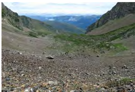
Parte baja, pedrera algo más llevadera