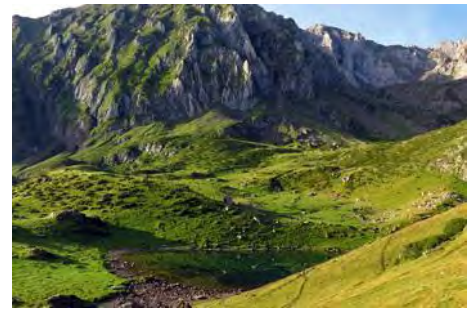
Lac d'Arou al pie de la cara Norte del Arbizon

El sendero desde Ancizan termina aquí; otra senda nos lleva al circo bajo la cara Norte del Arbizon, por la que volveremos. Ahora remontamos por la derecha del lago hacia una collada más alta, donde volvemos a encontrar otra senda. Siguiéndola nos internamos en un largo valle, por el que subimos durante un rato más por senda a tramos jitada, pero de evidente trazado, por la parte derecha del valle. Vamos doblando poco a poco hasta que vamos ya dirección Sur hacia la cabecera del valle (una hora más de marcha desde el lago). Delante de nosotros vemos el piko y una amplia collada a su derecha, de la que nos separa una pedrera con mala pinta.