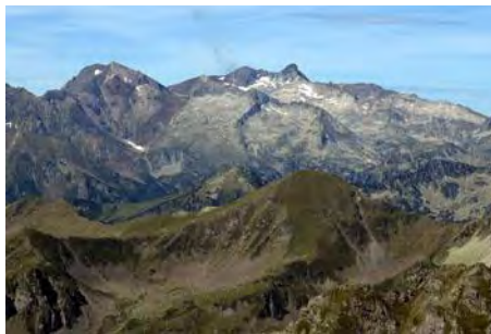
Al Sur, Campbieil y Pic Long