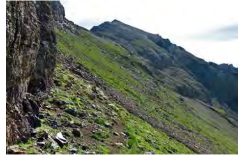
Lo que nos queda aún por subir... Paciencia...

Podemos hacerlo por el camino a toda cresta o por la senda que va por la derecha, haciendo alguna zeta que nos facilite la remontada. Finalmente, tras una hora desde el Montfaucon, coronamos los 2831 metros del Arbizon con sus gloriosas vistas a todos lados.