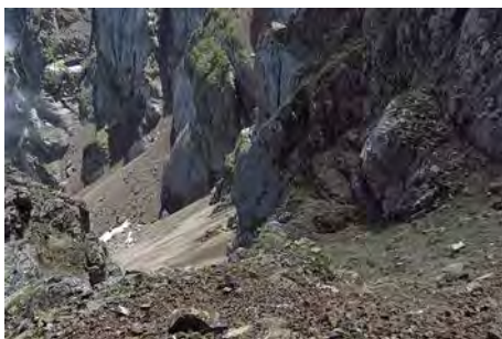
La arisca parte superior de la canal

Lo siguiente es encarar, y bajar, la pesada canal de Montfaucon. En su parte superior es de tierra dura, muy resbaladiza, y fuerte pendiente. A veces hasta nos exigirá echar las manos o algún pequeño destrepe por donde lo veamos mejor, ya que no hay senda. Verdaderamente es una canal delicada. Si no está seca o no lo vemos claro, tendríamos que plantearnos volver al pico Montfaucon y bajar por el camino de ida. Tenemos que sufrir los primeros 200 metros hasta llegar a las pedreras, que mejoran poco el andar pero donde al menos declina algo la pendiente. Al rato llegamos a encontrar algún jito y traza de senda poco marcada, que viene de las canales que caen de la cara Norte del Arbizon. En 30-40 minutos desde la brecha habremos llegado a una zona llana de pastos.