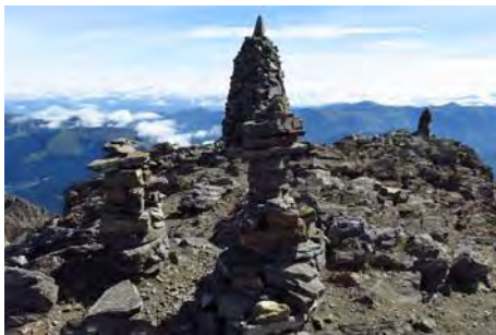
Jitos cimeros del Pic Arbizon

Podemos hacerlo por el camino a toda cresta o por la senda que va por la derecha, haciendo alguna zeta que nos facilite la remontada. Finalmente, tras una hora desde el Montfaucon, coronamos los 2831 metros del Arbizon con sus gloriosas vistas a todos lados.