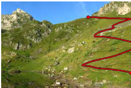
Desde el lago, continuamos la ruta

El sendero desde Ancizan termina aquí; otra senda nos lleva al circo bajo la cara Norte del Arbizon, por la que volveremos. Ahora remontamos por la derecha del lago hacia una collada más alta, donde volvemos a encontrar otra senda. Siguiéndola nos internamos en un largo valle, por el que subimos durante un rato más por senda a tramos jitada, pero de evidente trazado, por la parte derecha del valle. Vamos doblando poco a poco hasta que vamos ya dirección Sur hacia la cabecera del valle (una hora más de marcha desde el lago). Delante de nosotros vemos el piko y una amplia collada a su derecha, de la que nos separa una pedrera con mala pinta.