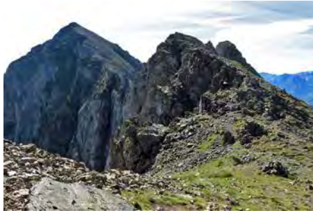
Esta es la brecha por la que bajaremos luego