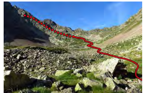
Parte alta, cerca ya del giro

La senda nos deja justo al pie y vemos que no va a ser tan pesada como parece. Hay buena traza, que con varias zetas nos permite remontar de forma pausada pero continua, los metros que nos separan del collado, a 2600 metros de altura. Se nos aparece la otra cara de la montaña, e incluso vemos la estación de esquí del Pla d'Adet al Sur. A la izquierda, 100 metros encima de nuestras cabezas, el piko nos requiere el último esfuerzo. Ganando directamente la cima desde el collado llegamos a los 2712 metros de la misma en poco más de tres horas de subida y casi 1200 metros de desnivel superado desde la Hourquette d'Ancizan.