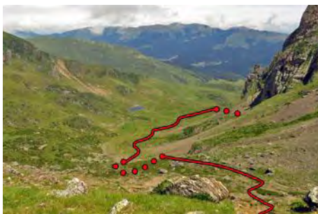
Siguiente tramo de bajada hasta el lago

Tras cruzar este llano acometemos otro tramo de bajada, éste más cómodo por terreno herboso, atravesando la antigua morrena glaciaria y donde seguimos senda jitada. Un rato después, otra vez por terreno más llano, vemos cerca el Lac d'Arou . Podríamos ir hasta él o acortar y torcer a la derecha antes, siguiendo senda de ganado hasta llegar al camino de subida (otros 30-40 minutos desde la cabecera superior). Rumbo Este, en media hora más (hora y media desde la brecha y algo más de dos horas desde la cima del Arbizon) volvemos a la Hourquette d'Ancizan . En total, la ruta nos puede salir cerca de siete horas de marcha.