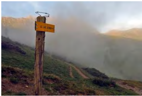
Poste de salida en Ancizan

La Hourquette d'Ancizan , punto de salida, es un collado a 1560 metros de altura al Sur del más famoso Col d'Aspin. Podemos llegar a este punto desde Bagnères de Bigorre al Oeste o por Saint Lary y el pueblo homónimo (Ancizan) al Este. En el puerto, desde el aparcamiento bajo el collado, sale una ruta señalizada con un poste que nos indica el sendero al Lac d'Arou rumbo Oeste. Por ahí, en suave ascenso, vamos durante una hora pasando por encima de las granjas de Camoudiet y subiendo hasta la pequeña laguna.