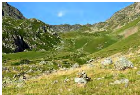
Ahora, todo el valle hacia arriba