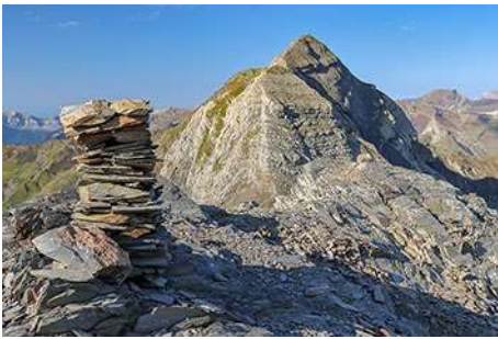
El Garlitz, vistas desde el Saoubète

Otra opción es torcer a la derecha (jitos) hasta una corta chimenea (unos 4 metros) que permite un ascenso de dificultad similar, pero más protegido. Arriba hay un anclaje de rápel, para posible aseguramiento en el descenso. Una vez terminado este paso, seguimos remontando por inclinadas llambrias, pero ya más fácil. La parte superior de la arista ve decrecer la dificultad, antes de llegar por fin a los 2798 metros que marca el montón de piedras cimero (unos 40-45 minutos desde el Saoubète, 3 horas y algo más desde el coche).