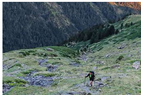
Encima del bosque ya y sobre el valle