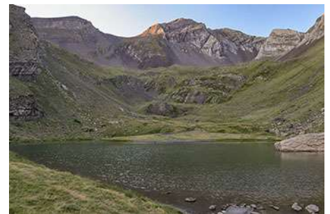
Lac Catchet, con el pico al fondo

A la izquierda encontramos una senda que asciende rumbo Norte, esquivando un muro sobre nuestras cabezas. Una vez en los prados superiores subimos, ahora rumbo Este, siguiendo algunos jitos que no sabemos si orientan o despistan más. Vamos a ir cogiendo altura hacia el Pic de Cuneille sobre nosotros: a mucha altitud, casi ya en la cresta cimera, giraremos a la derecha (rumbo Sur) para seguir sendas de ganado hacia la base del pico. Podríamos buscar directamente la base del Garlitz, pero primero vamos a visitar otra cima, una sin nombre en los mapas pero que en algunos lugares llaman el Pic Saoubète. Para ello salimos a su collada Norte y por terreno pesado de pedrera, pero sin dificultad alguna, coronamos sus 2731 metros (70-80 minutos desde el lago, dos horas y media desde el coche).