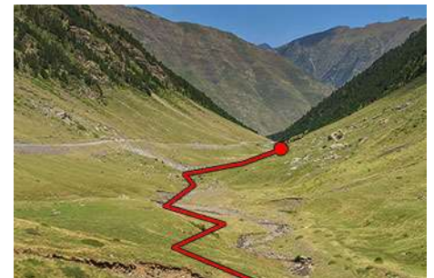
Tras el túnel, tramo final de vuelta al coche

Ahora seguimos media hora más, rumbo Norte, el descenso por el marcado camino, bastante frecuentado. Éste se adentra en el corte que nosotros esquivamos y, tras un breve estrechamiento, sale justo a la boca Norte del Túnel de Bielsa. Un kilómetro largo nos separa del aparcamiento donde salimos. Sin tocar la carretera, bajamos siguiendo el reguero hasta volver a él en otros 10-15 minutos de suave descenso. En total, bajar desde el pico nos habrá llevado poco más de dos horas, cerrando este guapo circuito por otra de esas cimas pirenaicas, secundarias en altura que no en porte, belleza o esfuerzo. Pasarlo bien y suerte allá arriba. Un saludo del Maquis.