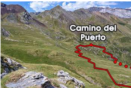
Parte baja, a buscar otra vez senda trillada

La parte baja gana pendiente, luego sale a los llanos bajo la mole cimera. Aquí tenemos que llegar al camino del Puerto de Bielsa, frente a nosotros. Lo haremos monte a través, casi en llano sin perder altura ya que el valle que atravesamos, en su parte inferior, está cortado por un vertical tajo por el que se precipitan las aguas. Por eso vamos rumbo Suroeste en llano, sin perder la cota de los 2150 metros, para cruzar un arroyo y poco después topar el camino del puerto (40-50 minutos desde la Pène Abeillere, hora y poco desde el Garlitz).