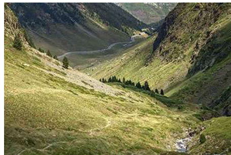
Bajando al túnel, se ve la carretera