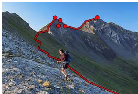
Trazado a las cimas, entre el pasto