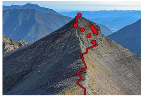
Descenso del Saoubète, visto desde el Garlitz