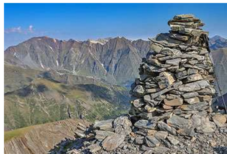
La cima, con el Campbieil al fondo