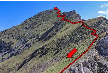
Descenso de la Arista Sur desde la antecima

Una vez disfrutadas las vistas cimeras vamos a continuar la travesía, ahora bajando rumbo Sur. Seguimos los jitos por la parte Oeste (derecha) de la montaña, la vertiente que da al túnel de Bielsa. Perdemos unos metros por terreno rocoso, sencillo pero con cuidado, para acceder a una afilada arista que atravesamos en toda su longitud. Algunos pasos aéreos de II grado nos separan de su fin, tras el cual ascendemos otra vez hasta la antecima Sur del Garlitz, casi tan alta como la principal (15 minutos desde la cima). Damos cara a la vertiente Sur del pico, una ladera herbosa enfrentada a la frontera española y los puertos de Bielsa. Por ella bajamos, esquivando los cortes que nos salgan al paso con flanqueos a la derecha (jitos), para así llegar en media hora al collado que nos separa de la cima de la Pène Abeillère. Un breve ascenso nos deja en la plana cima de esta cota (2611 metros), que por su cara Sur presenta un cortado vertical de casi 200 metros (ojo al asomarse). Continuamos el descenso, ahora rumbo Este (hacia la derecha), buscando el escape de la ladera, sin camino marcado pero fácil de seguir y algunos jitos que asoman de vez en cuando.