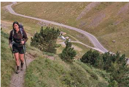
Salida, con la granja por debajo

Éste es el punto de partida a la ascensión al Lac Catchet, destino senderista y por el que vamos a subir la primera hora de ruta. Dejando la granja a nuestras espaldas cruzamos el reguero, y buscamos la poco visible senda que sube rumbo Norte por la empinada ladera. Al poco el camino, ya más marcado, remonta el pinar en fuerte pendiente, ganando altura de forma vertiginosa sobre el valle. Tras media hora de ascenso, salimos del bosque y seguimos cuesta arriba por el valle herboso otra media hora más, hacia el circo que adivinamos sobre nuestras cabezas. Una hora después de salir del coche aparecemos frente al coqueto y resguardado Lac Catchet, por encima de los 2200 metros. Frente a él, imponente, la vertiente Norte del Garlitz. Ahora vamos para allá, aunque no de forma directa como se suele hacer cuando se baja desde el pico (sentido inverso a nuestra ruta), sino dando algo de rodeo para no cansarnos mucho.