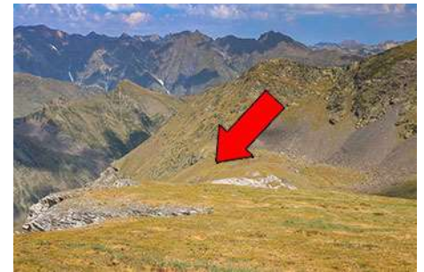
Descenso hacia el Puerto de Bielsa

La parte baja gana pendiente, luego sale a los llanos bajo la mole cimera. Aquí tenemos que llegar al camino del Puerto de Bielsa, frente a nosotros. Lo haremos monte a través, casi en llano sin perder altura ya que el valle que atravesamos, en su parte inferior, está cortado por un vertical tajo por el que se precipitan las aguas. Por eso vamos rumbo Suroeste en llano, sin perder la cota de los 2150 metros, para cruzar un arroyo y poco después topar el camino del puerto (40-50 minutos desde la Pène Abeillere, hora y poco desde el Garlitz).