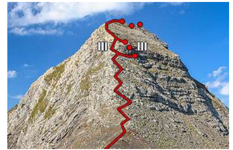
La Arista Norte del Garlitz: por ahí subiremos