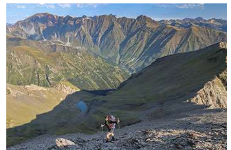
Llegada a la cima, con el Campbieil al fondo

Un corto descanso y a coronar la cima principal del día. Seguimos unos metros por la cresta, rumbo Sur, hasta llegar a un corte. A la izquierda (Este), una pedregosa canal nos permite bajar sobre 30 metros, momento en el que torcemos a la derecha por terreno incómodo, pero no peligroso, para ganar la collada Norte del Garlitz. Una vez aquí vamos a subir por las bravas, por la empinada cara Norte del pico, casi siempre sobre el filo entre las vertientes. Unas cortas trepadas iniciales nos sacan a un tramo más fácil, con algunos jitos que nos ayudan a seguir el mejor trazado, hasta llegar bajo un corto muro donde está el tramo clave. Podríamos superarlo directamente, con una breve trepada de III de unos 3 metros, pero con mucho ambiente sobre el Valle de Moudang, al Este.