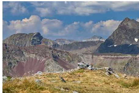
En la Pène Abeillère; La Munia al fondo