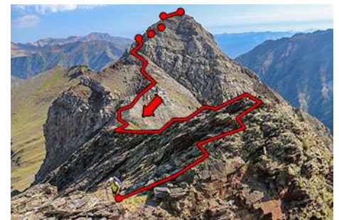
El descenso del pico, que tiene su miga

Una vez disfrutadas las vistas cimeras vamos a continuar la travesía, ahora bajando rumbo Sur. Seguimos los jitos por la parte Oeste (derecha) de la montaña, la vertiente que da al túnel de Bielsa. Perdemos unos metros por terreno rocoso, sencillo pero con cuidado, para acceder a una afilada arista que atravesamos en toda su longitud. Algunos pasos aéreos de II grado nos separan de su fin, tras el cual ascendemos otra vez hasta la antecima Sur del Garlitz, casi tan alta como la principal (15 minutos desde la cima). Damos cara a la vertiente Sur del pico, una ladera herbosa enfrentada a la frontera española y los puertos de Bielsa. Por ella bajamos, esquivando los cortes que nos salgan al paso con flanqueos a la derecha (jitos), para así llegar en media hora al collado que nos separa de la cima de la Pène Abeillère. Un breve ascenso nos deja en la plana cima de esta cota (2611 metros), que por su cara Sur presenta un cortado vertical de casi 200 metros (ojo al asomarse). Continuamos el descenso, ahora rumbo Este (hacia la derecha), buscando el escape de la ladera, sin camino marcado pero fácil de seguir y algunos jitos que asoman de vez en cuando.