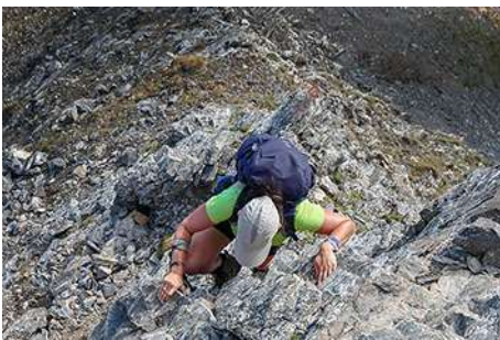
Trepando a plena arista