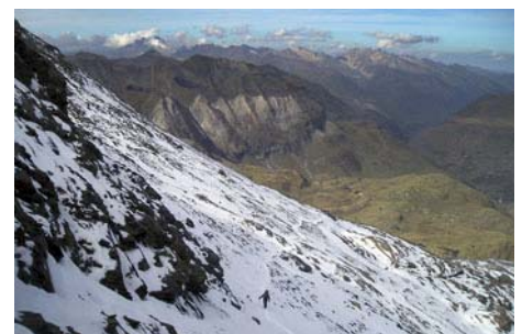
Tras El Passet, subida a la Collada de La Munia