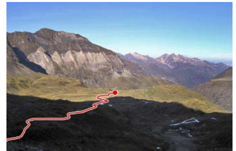
El aparcamiento y primer tramo de camino