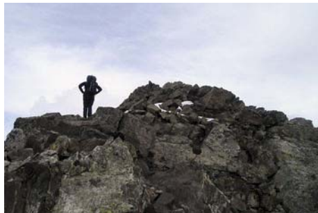
En la parte alta, ahora a seguir la cresta

Sólo tenemos que seguir la cresta, con algún corto paso, casi siempre por la vertiente francesa (Norte) o por el mismo filo. Finalmente, después de una hora y poco desde la Collada de La Munia llegamos a la cima, con sus 3132 metros y sus espectaculares vistas.