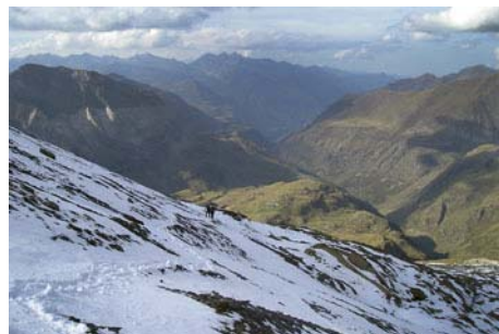
Bajando al valle con el Vignemale al fondo

El descenso lo hacemos siguiendo el mismo camino de subida. Ojo con el destrepe en las proximidades del Paso del Gato, donde podremos encontrar habitualmente algún tinglado si queremos rapelarlo, al igual que más abajo, en el murete de El Passet . Con tanto destrepe, y más si encontramos tráfico, la bajada nos puede llevar casi tanto tiempo como la subida. Por si acaso, es mejor subir con la meteo asegurada, ya que poco escape vamos a tener en esta ascensión si nos cae la tormenta o la niebla encima.