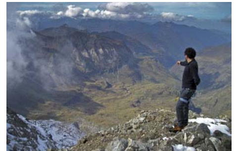
La cima sobre el circo de Troumouze, al Norte