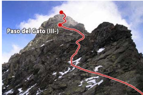
El acceso a la cima, por la cresta Oeste

Vamos remontando por la vertiente de Troumouze hasta que llegamos al famoso Pas du Chat , un corto muro vertical surcado por varias grietas que parecen arañazos. Es una corta pero aérea trepada (unos cuatro metros de III-) donde tener cuidado si la cogemos mojada, sobre todo al descenso. Tras ella seguimos subiendo, con pasos más fáciles pero con ambiente, hasta llegar a la arista cimera.