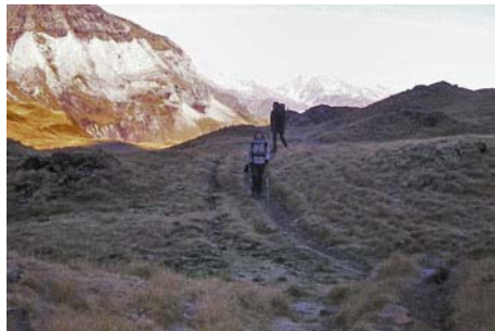
Por la senda al fresco de la mañana