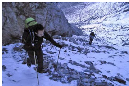
Remontando la canal a la sombra