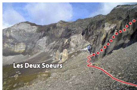
Camino a la canal de inicio