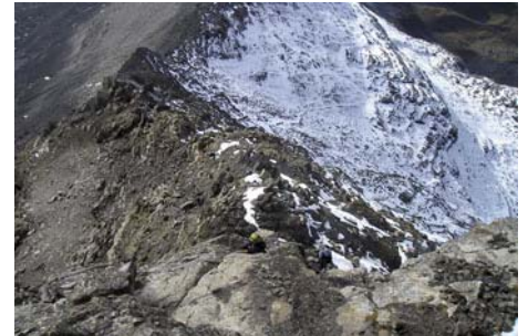
Mirando desde arriba a la Collada

Sólo tenemos que seguir la cresta, con algún corto paso, casi siempre por la vertiente francesa (Norte) o por el mismo filo. Finalmente, después de una hora y poco desde la Collada de La Munia llegamos a la cima, con sus 3132 metros y sus espectaculares vistas.