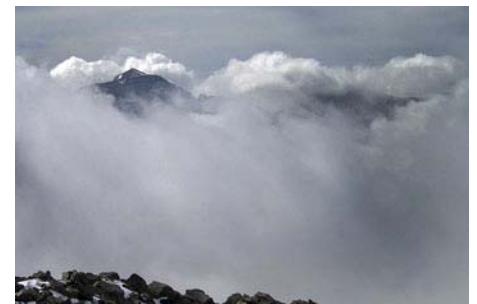
Entre las nubes, asoma el Monte Perdido

El descenso lo hacemos siguiendo el mismo camino de subida. Ojo con el destrepe en las proximidades del Paso del Gato, donde podremos encontrar habitualmente algún tinglado si queremos rapelarlo, al igual que más abajo, en el murete de El Passet . Con tanto destrepe, y más si encontramos tráfico, la bajada nos puede llevar casi tanto tiempo como la subida. Por si acaso, es mejor subir con la meteo asegurada, ya que poco escape vamos a tener en esta ascensión si nos cae la tormenta o la niebla encima.