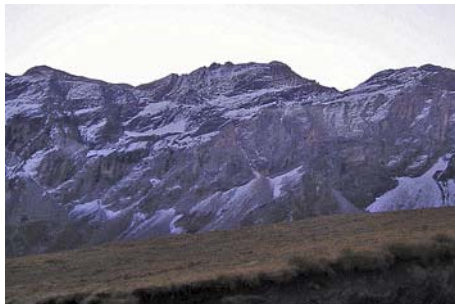
La Munia desde el aparcamiento

El primer tramo de subida nos lleva rumbo Este, por una senda que se interna en el glaciar. Antes de llegar a la hondonada de los Lacs des Aires, torcemos al Sur, ya que la senda se dirige directamente a las murallas que cierran el circo por el Sur. Nuestro camino pasa por debajo de la muralla y tuerce a la derecha para encontrar una oculta y pindia canal que nos permite superarla. Llegamos a una horcada y seguimos subiendo por canales hasta llegar a una zona más ancha. Frente a nosotros tenemos un corto muro ( Le Passet ) que tenemos que trepar (II grado, unos 10 metros) y que puede ser peleón si está verglaseado. Arriba a la derecha hay una reunión para rapelar. Llevamos casi dos horas de camino, ahora seguimos andando por la pedregosa ladera hacia el Collado de La Munia.