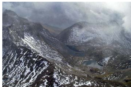
Al Sur, los Lagos de La Munia