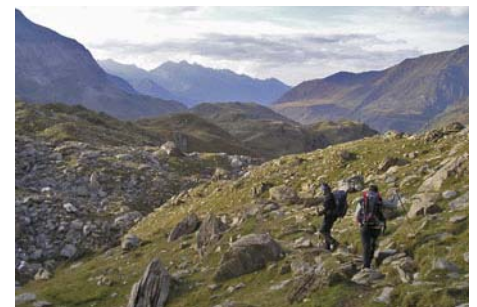
Abajo, en busca del aparcamiento

Con ésta tenemos en el bolsillo una ascensión asequible, siempre que vayamos ya curtidos, a la cota principal de uno de los más bellos macizos pirenaicos. Como decíamos en la introducción, el recorrido integral de la cresta no es de mucha dificultad (aunque de bastante longitud y ya requiere algo de material, con fáciles pero largas trepadas por encima de los 3000 metros) así que podemos apuntarlo para próximas visitas que no nos reciban, como esta vez, con la roca verglaseada.