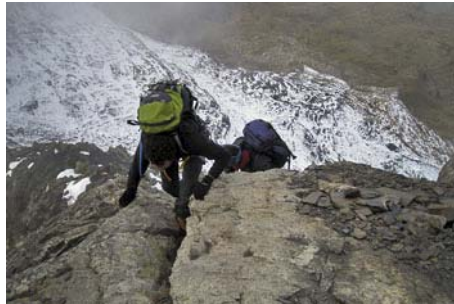
Superando el Paso del Gato, III-