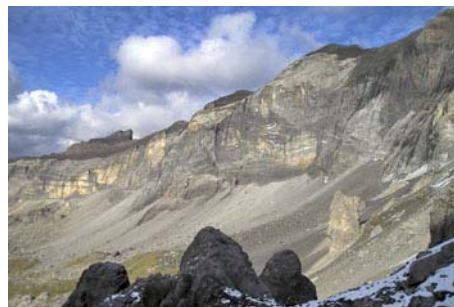
Dejamos arriba la cresta de Troumouze