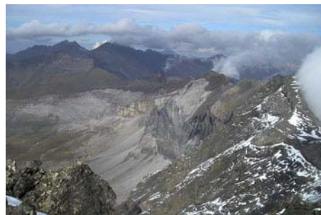
El Long y el Campbieil lejanos al Noreste