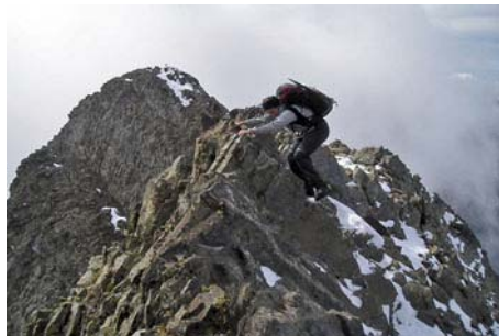
Trepando por la cresta tras pasar una anticima